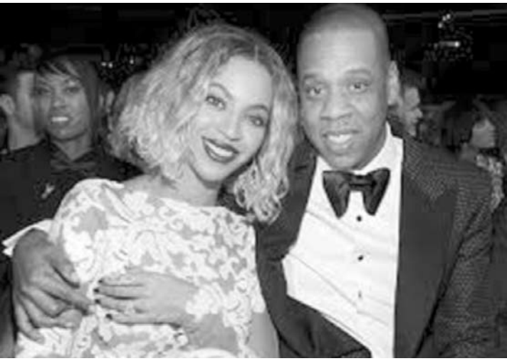
Beyoncé e Jay-Z curtem união

Beyoncé e Jay-Z renovam votos e afastam rumores de crise