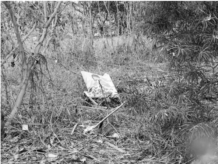
Cavalete inservível foi simplesmente descartado. E o pior, em área de preservação ambiental...