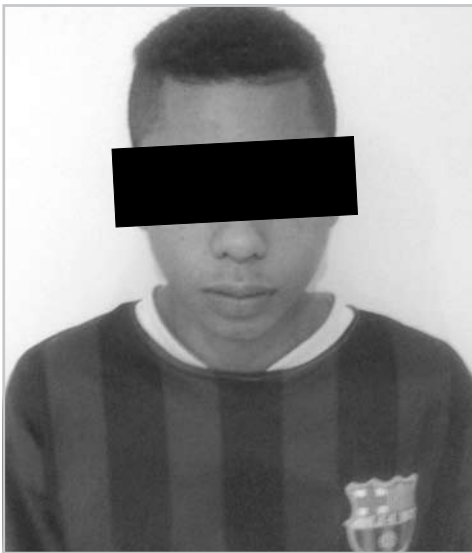
O menor confessou à Polícia a prática do roubo à residência e do Auto Posto Arueirão, com o uso da arma de fogo; a Polícia localizou na cintura do adolescente um revólver calibre 32 contendo três munições intactas (ao lado)