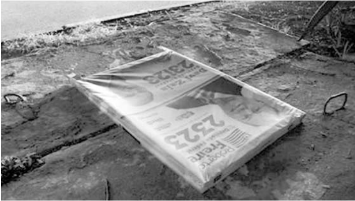
Cavalete derrubado em via pública, prejudicando o fluxo de pessoas e veículos