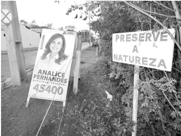
...no mesmo local, outra placa também em espaço indevido