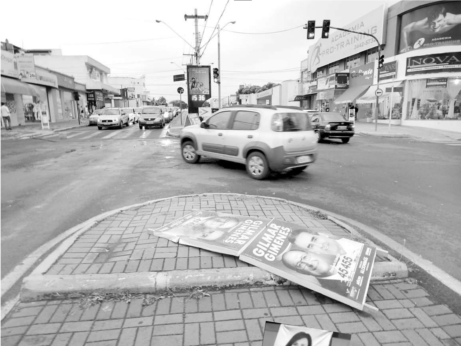
Em plena Avenida Expedicionários, propaganda impede o trânsito de pessoas e as fazem concorrer com veículos

Regras e esclarecimentos complementares da Justiça Eleitoral estão disponíveis nos links a seguir: http://www.tre-sp.jus.br/noticias-tre-sp/perguntas-e-respostas/propaganda-eleitoral ; e http://www.tse.jus.br/eleicoes/eleicoes-2014/normas-e-documentacoes/resolucao-no-23.404