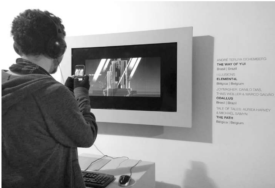
Game The Way of Yiji desenvolvido por docente da Unifev