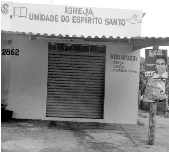
Propaganda de candidatos afixada em templo religioso. Até o governador foi multado pelo TRE por ação similar