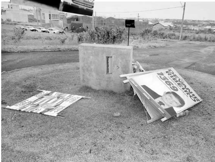
Ação dos ventos provocam quedas de cavaletes que assim permanecem durante todo o dia