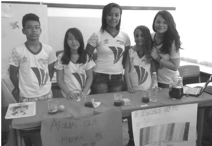
Como a água muda de cor de acordo com a escala do PH, um dos temas desenvolvidos pelos alunos