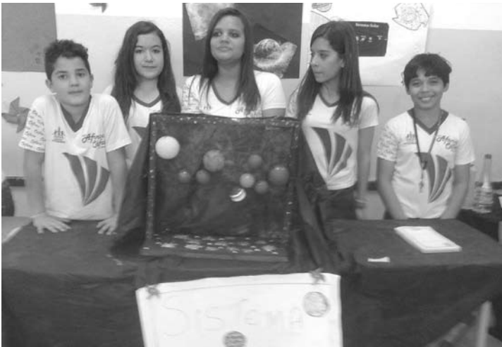
Grupo do fundamental demonstrou o sistema solar e seus elementos