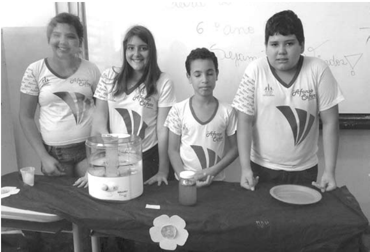
Alunos fizeram a mostra da produção de água do planeta e a sua preservação