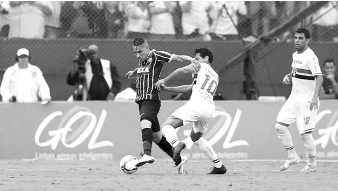
Guerrero e Ganso em lance do Majestoso de maio; ao lado, os 10 confrontos do BR-14 deste final de semana

lo na Arena de Itaquera; o Cruzeiro recebe o Atlético-MG no Mineirão; o Vitória enfrenta o Bahia na Arena Fonte Nova; e o Flamengo pega o Fluminense no Maracanã.