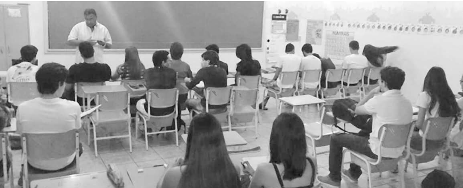
Aulas na unidade da Unesc de Iturama já começaram