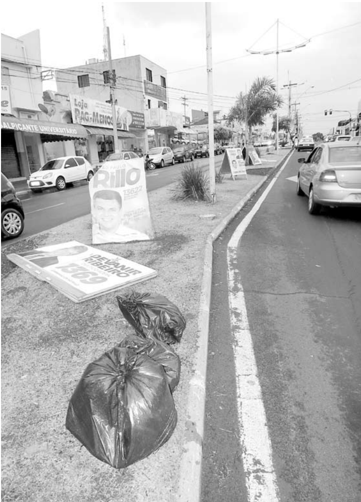
Registro de um dos principais flagrantes de desrespeito e do mau uso de propaganda política em toda extensão da “Expedicionários”