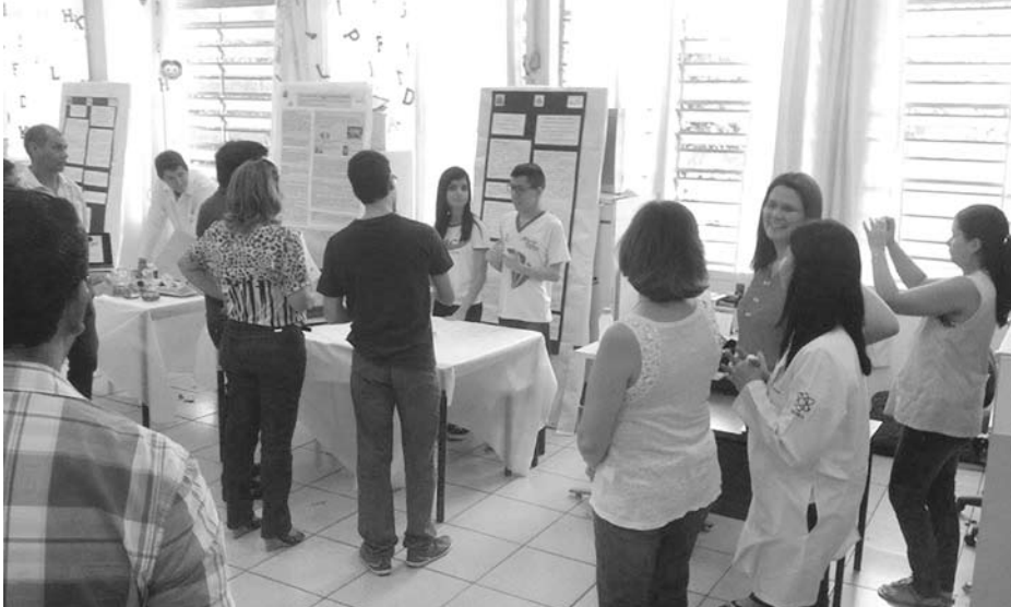
Projetos de jovens cientistas foram analisados por professores mestres e doutores de faculdades da região