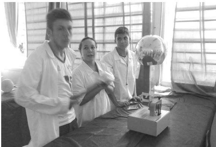
Alunos do ensino médio fizeram demonstrações de energia com equipamentos tecnológicos oferecidos nos laboratórios