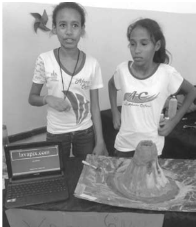
Com bicarbonato e outros produtos, alunas demonstram como funcionam os vulcões

experimentar quando estiverem na faculdade. A avaliação dos examinadores, além de ser inserida no boletim, define quais projetos tem condições de participar de concursos”, explica Fernanda Miranda.