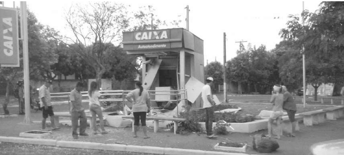
O bando explodiu o caixa eletrônico de um posto avançado da Caixa Econômica Federal