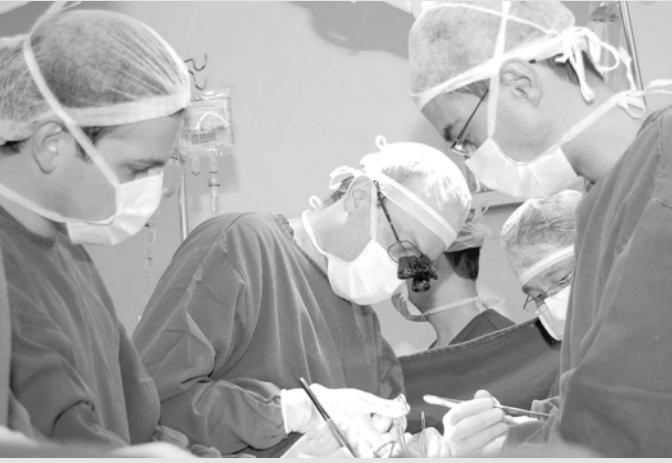
É importante a autorização para retirada de órgãos, após a confirmação do óbito

Qualquer pessoa que concorde com a doação pode ser doador, desde que o procedimento não prejudique sua saúde. O doador vivo pode doar um dos rins, parte do fígado, da medula óssea ou do pulmão. No caso de doadores falecidos, é preciso constatar a morte encefálica. O ministério ressaltou que a doação de órgãos só ocorre com a autorização da família.