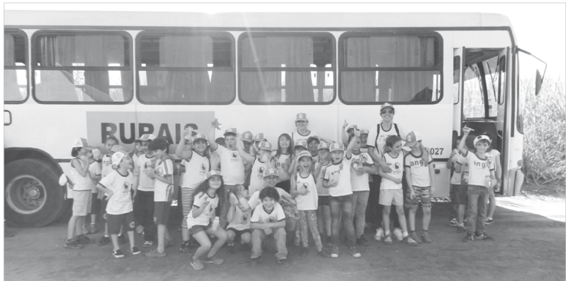
Alunos da escola Anglo

zando inúmeros benefícios ao meio ambiente e toda a sociedade.