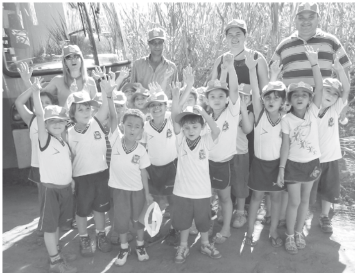
Professores e crianças da CEMEI Maria Tereza