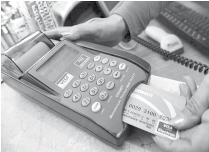
Pesquisa aponta que 63,1% das famílias têm dívidas em setembro. Em agosto, o percentual era 63,6%

Na comparação com setembro do ano passado, houve aumento do endividamento, mas quedas na inadimplência e no percentual de famílias sem condições de pagar as dívidas, já que naquela oca-