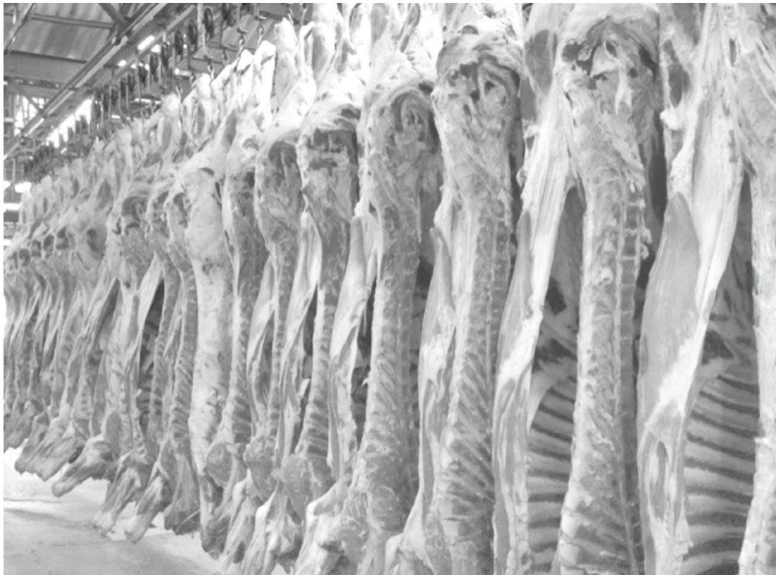
As restrições dos dois países com o Brasil são em função da doença da vaca louca