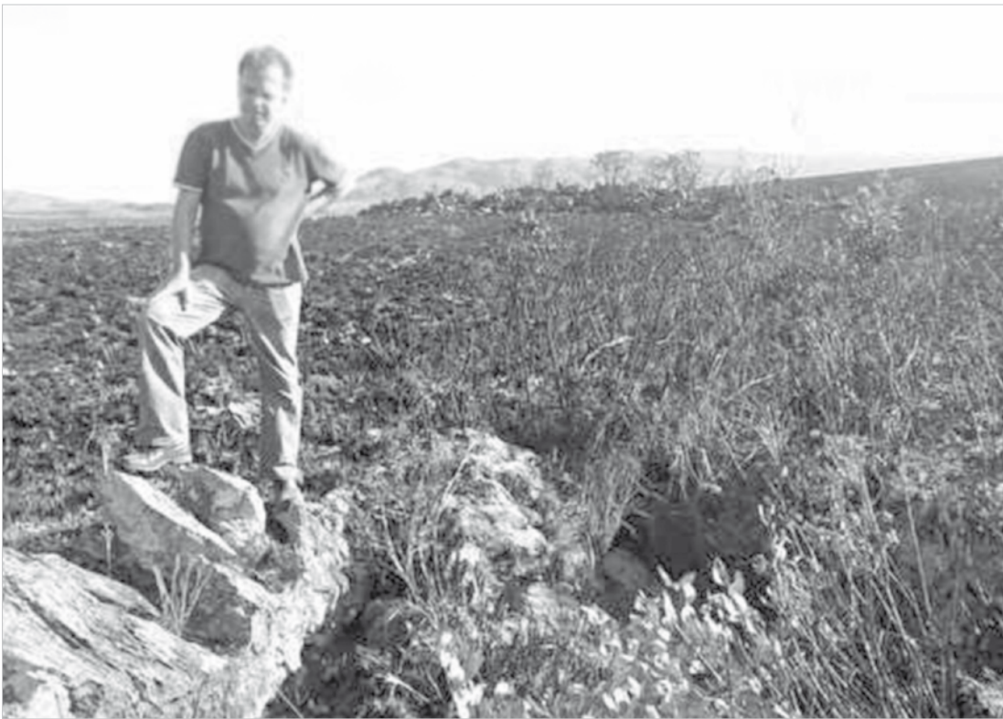
Funcionários do Parque da Serra da Canastra, onde o rio nasce, contaram que se trata de situação inédita na história e preocupante

A Usina de Três Marias, localizada na cidade mi-