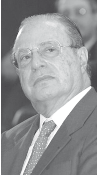
Paulo Maluf ainda depende de recurso junto ao STF

do de viajar ao exterior por estar na lista da Interpol não poderia se candidatar. A relatora e primeira a votar para impedir a candidatura de Maluf foi a ministra Luciana Lóssio. Ela foi seguida pelos ministros Luiz Fux, Admar Gonzaga e Maria Thereza de Assis Moura. Já no grupo vencido, o presidente Dias Toffoli destacou que a decisão da corte, de barrar Maluf, na prática avançava sobre o TJ-SP, que não o condenou na modalidade dolosa. Ele disse que, em casos de improbidade, o TSE poderá agora revisar decisões tomadas pela Justiça comum. Como exemplo, destacou que poderá haver casos contrários, em que alguém realmente condenado por improbidade no modo doloso seja absolvido na Justiça Eleitoral. Segundo ele, a corte po-