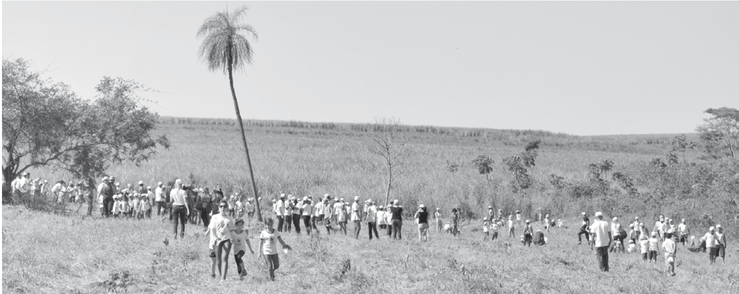
300 convidados plantaram árvores

Realizado em parceria com a empresa Arysta Life Science, e com apoio da