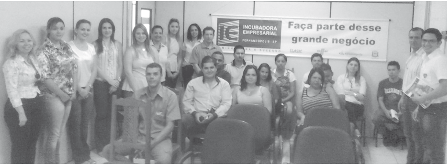
Em nova fase de projetos, ACIF estreita e fortalece vínculos com empresários da Incubadora Empresarial