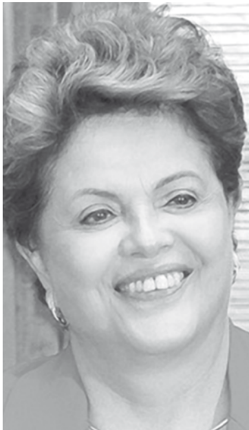
Novas pesquisas são divulgadas e presidenciais entram na reta final da campanha

De acordo com o instituto Vox Opinião Pesquisa e Projetos Ltda, o Vox Populi, Dilma Rousseff abriu