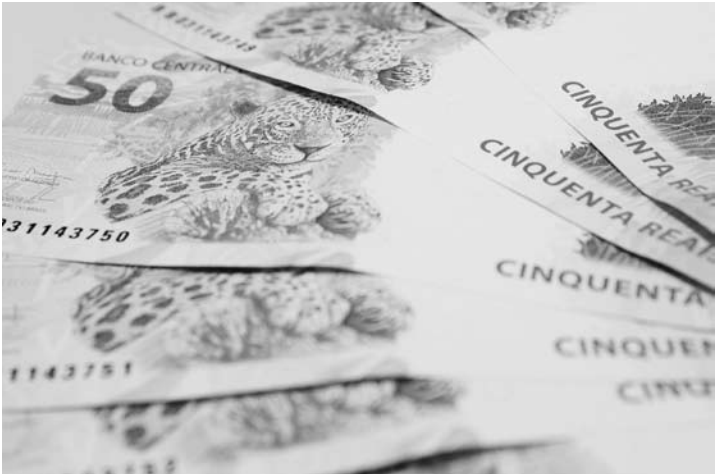
O conselho fixa em 2,14% ao mês o teto da taxa de juros para o empréstimo e em 3,06% ao mês para o cartão consignado

A margem consignável, que é o valor máximo da renda a ser comprometida, não pode ultrapassar 30% do valor da aposentadoria ou pensão recebida pelo beneficiário.