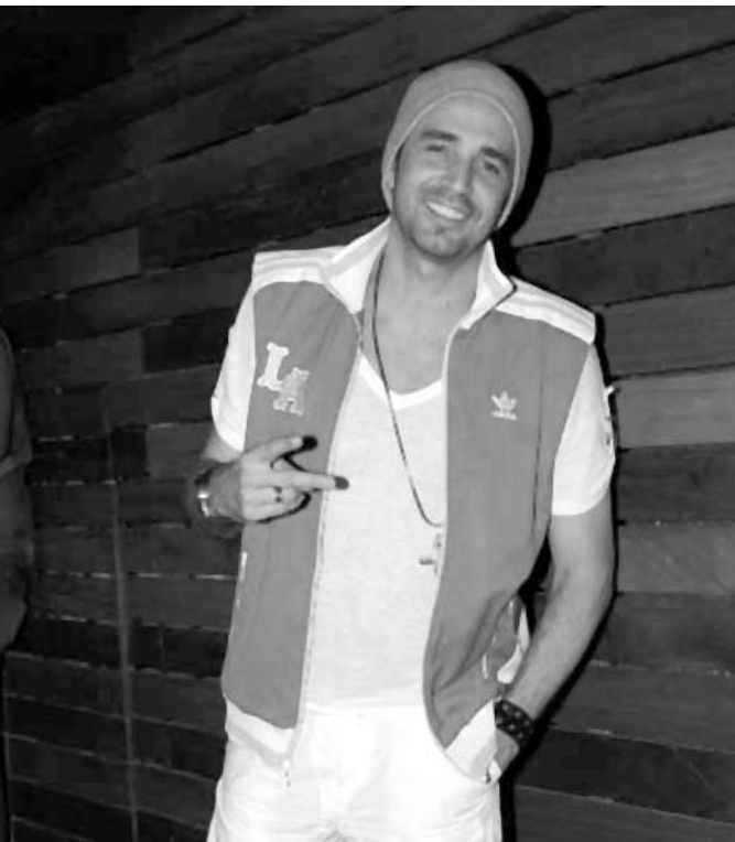
Latino é mais legal com o Twelves

Parece que Kelly Key não é a única que teve problemas com o ex-marido, Latino, por conta de pensão da filha. Uma ex-namorada, que não quis se identificar, teve um filho com ele – que, na época, estava já namorando Rayanne Moraes, sua atual esposa. E, segundo a mulher, o cantor não paga a pensão. "Ele não cumpre a ordem judicial que foi dada desde o início do ano. Já dei entrada no pedido de execução sob pena de prisão e estou aguardando o mandado", diz ela. Mesmo o filho tendo sido reconhecido pela justiça, através de exame de DNA.