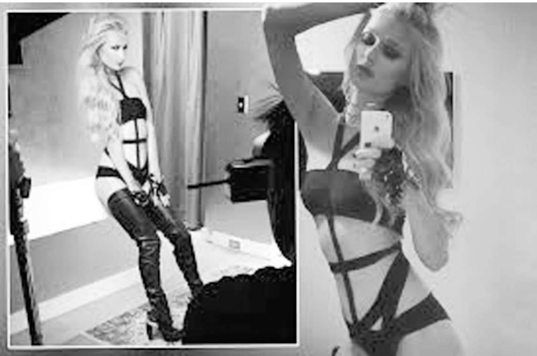
Socialite posou com looks pretos em ensaio sensual e resolveu definir o estilo no Instagram.

Com dois quilos a menos, após cortar o fast-food da sua vida, a loira mostrou um corpo bem diferente do perfil "Miss Bumbum" adorado pelos brasileiros. E aí, o estilo sensual+carão+botas longas+batom pink te convenceu?