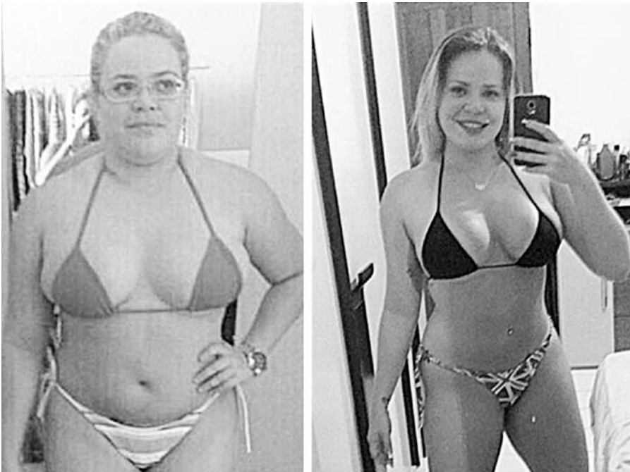
Muita malhação, dieta adequada, litros e litros de água e alguns procedimentos estéticos mudaram a ex-BBB.

Na verdade, agora que está com um corpo sarado e em dia, um de seus passatempos favoritos é postar antes e depois no Instagram. Esse é um dos mais impactantes: