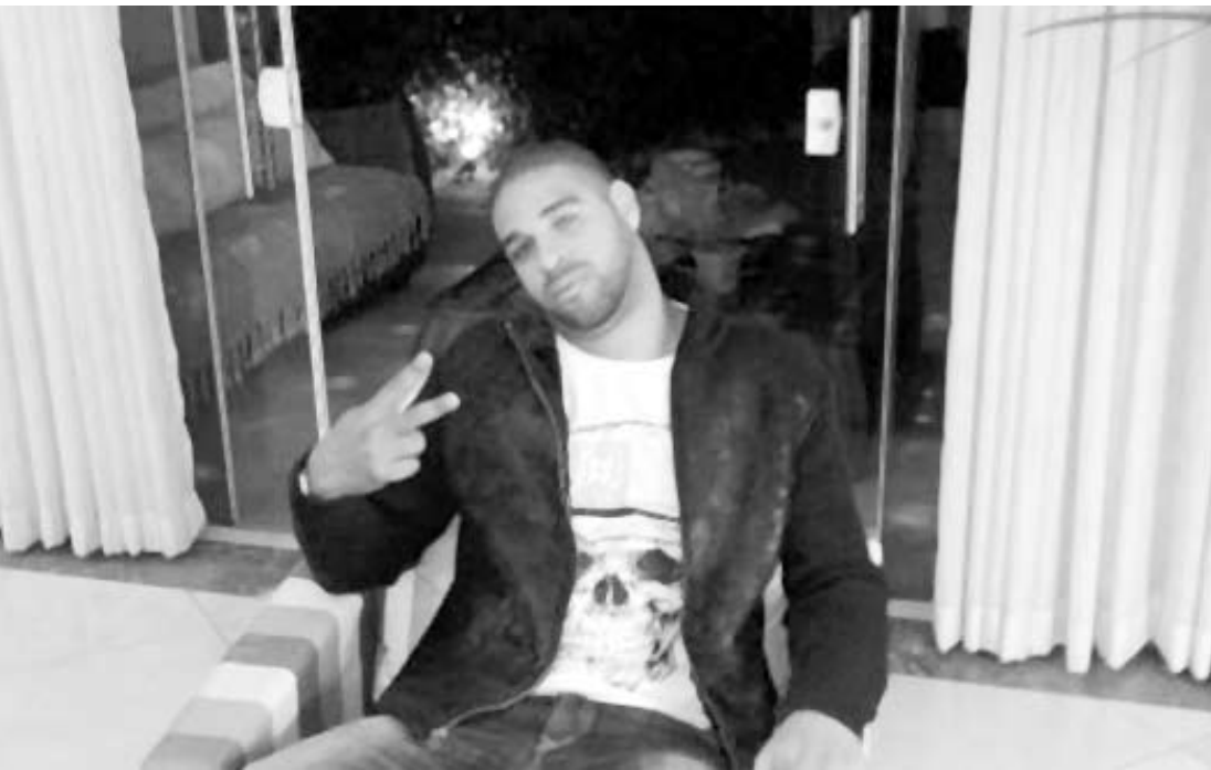
Em uma vibe mais família, imperador resolveu fugir das festas com mulheres e aproveitar o dia de outra forma.