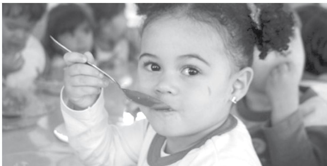
Municípios têm até o dia 10 de outubro para preencherem as informações

O mapeamento funciona da seguinte maneira: os Municípios podem acessar a prévia do questionário, reunir as informações com