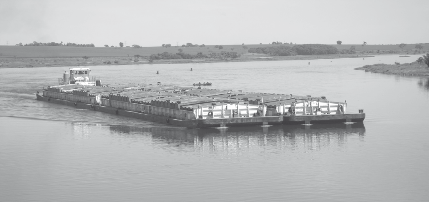
Testes que poderão normalizar a navegação pela hidrovía Tietê-Paraná, paralisada desde maio

A principal observação é com relação à sobrevivência das diversas espécies de peixes