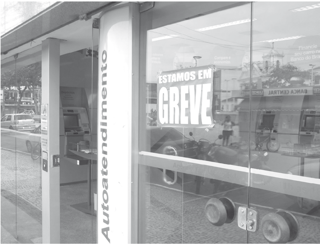
Na proposta apresentada pela Fenaban, os bancos oferecem reajuste de 7,35% para salários e demais verbas salariais

A Contra informou que está organizando, para