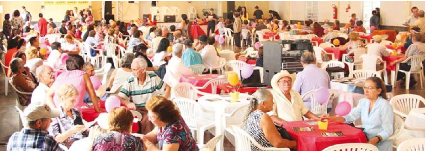
Idosos terão momentos de alegria e descontração amanhã no Recanto do Tamburi

→ ASSESSORIA DE IMPRENSA Prefeitura de Fernandópolis