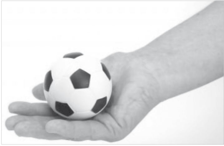
Nível da “bolinha” do atual futebol brasileiro é tão vergonhoso quanto a capacidade dos cartolas que comandam a CBF; enquanto a arbitragem registra vexames rodada após rodada no BR-14, Marin quer “revanche” contra alemães para dar moral a Dunga: é brincadeira?

cobra a entidade máxima do futebol mundial. “A Fifa tem de assumir o que faz e o que falou perante os seus instrutores. Existe um vídeo com 26 situações que ela, inclusive, proibiu de ser exibido. A CBF queria exibir para público e mostrar o que os árbitros receberam de orientação, mas a Fifa não permitiu”, disse. Gaciba ressalta que não é apenas no Brasil que as jogadas de mão na bola estão provocando polêmica. “Na Espanha, tivemos lance dentro desse modelo e no Campeonato Português o jogador estava de braço aberto quando a bola bateu no seu peito e o juiz deu pênalti. Na Libertadores, também ocorreu algo semelhante. Isso não acontece só no Brasil”.