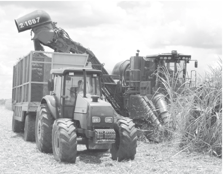
A estimativa é de uma safra de cana-de-açúcar quase 9% menor este ano

Um dos setores que será mais prejudicado além da agricultura, é o da geração de energia. Cerca de cinco usinas da região de Ribeirão vão encerrar a colheita antecipadamente. O Grupo Climatempo é a maior empresa privada de meteorologia do país. Fornece, atualmente, conteúdo para mais de 50 retransmissoras nacionais de televisão, para rádios de todo o Brasil e para os principais portais. Com cerca de 1.100 clientes, a empresa atua principalmente em dois segmentos: o de agonegócios e o de meios de comunicação. Oferece também conteúdo meteorológico estratégico para empresas de moda e varejo, energia elétrica, construção civil, transporte e logística, além de bancos, seguradoras e indústrias farmacêutica e de alimentos. O Grupo é presidido pelo meteorologista Carlos Magno que, com mais de 27 anos de carreira, foi um dos primeiros comunicadores da profissão no país.