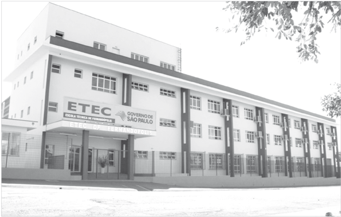
Etec oferece mais de 300 novas vagas para o primeiro semestre do ano que vem

A inscrição para o processo seletivo deve ser feita exclusivamente pela internet, pelo site www.vestibulinhoetec.com.br , até as 15 horas do dia 7 de novembro. Para efetivar a inscrição é preciso imprimir o boleto bancário e pagar a taxa de R$ 30 em dinheiro em qualquer agência bancária. O Manual do Candidato também está disponível para download no site do Vestibulinho. O exame será no dia 7 de dezembro.