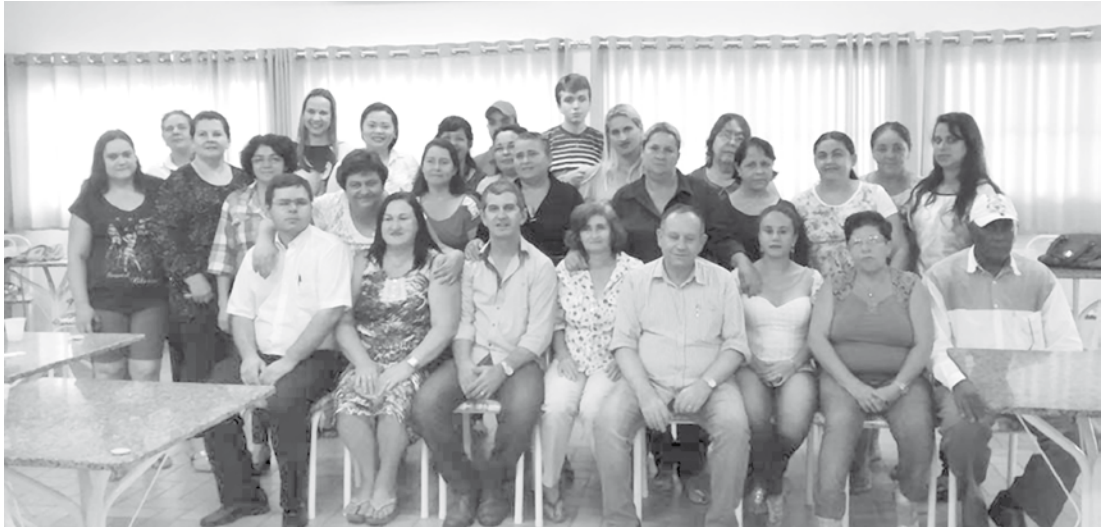
Momentos marcantes da cerimônia que reuniu os formandos do curso de Atendimento e Recepção em Pedranópolis