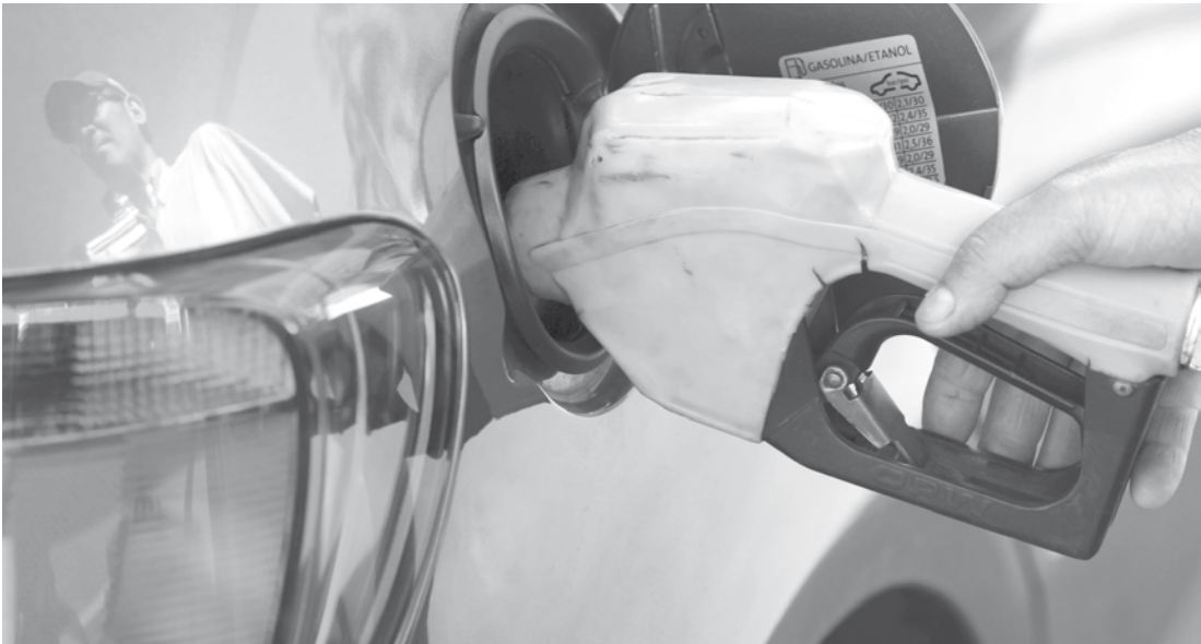
Consumidores sentirão ‘aumento no bolso’ em breve

“Quem resolve o preço da gasolina é a Petrobras. Temos uma certa regularidade. Nos últimos anos, sempre teve aumento. Um ou dois. É um setor privilegiado. A maioria dos segmentos teve reajuste de preços uma vez por