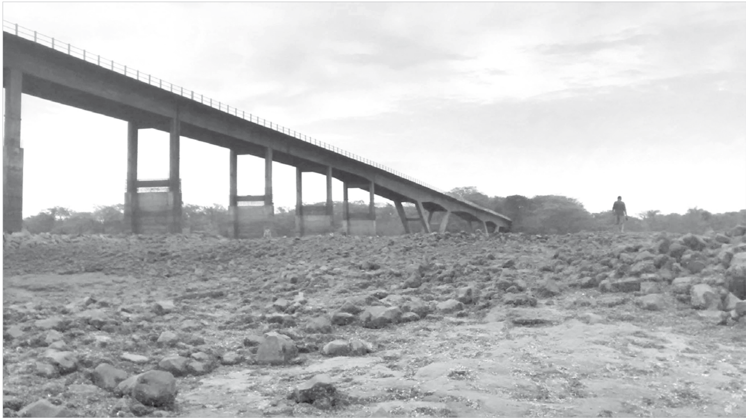
Com o baixo volume mantido no reservatório da usina, o Rio Grande sofre as consequências na altura da ponte SP/Minas, em Água Vermelha

Mas, apesar do volume do reservatório ter subido 10%, a situação continua preocupante. Quem passa pela ponte que divide os estados de São Paulo e Minas Gerais, entre Ouroeste e Iturama, sobre o Rio Grande fica impressionado. Sem a abertura dos vertedouros de Água Vermelha, a pouca água que