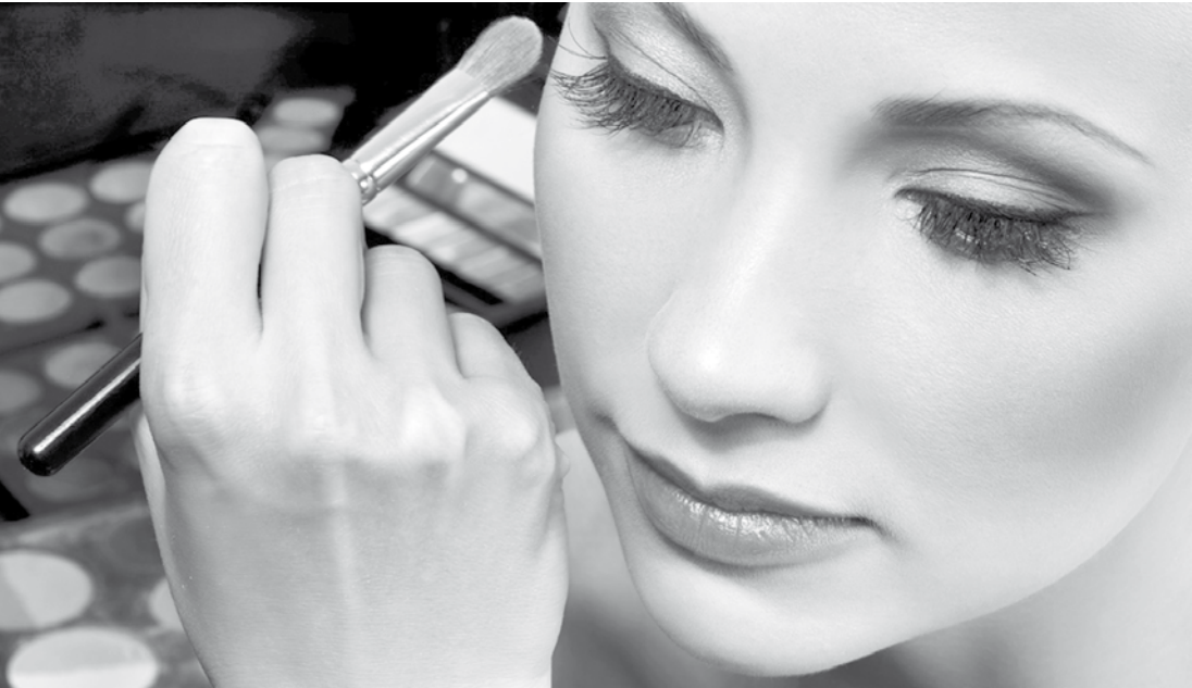
Os cursos serão oferecidos na Unidade Móvel em frente à Etec Fernandópolis

O programa está com inscrições abertas para os cursos de Qualificação Profissional de Manicure e Pedicure, Cabeleireiro e Maquiagem