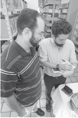
Secatto garantiu um autógrafo de Cuenca