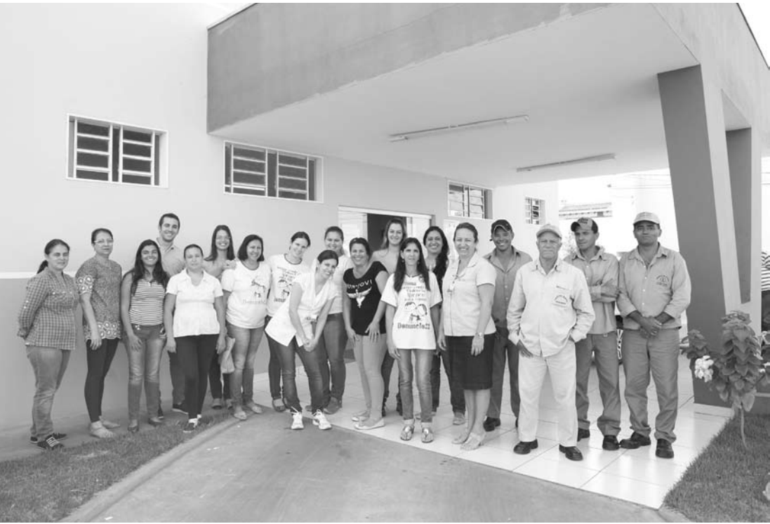
Equipe da saúde responsável pelo trabalho de prevenção contra a Dengue

Embora os casos aconteçam com maior incidência em períodos específicos, no decorrer desde ano a transmissão da doença não parou de ocorrer, por isso a Secreta-