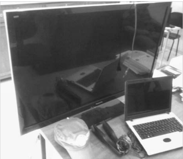
Uma chapinha e um notebook foram recuperados pela PM

O suspeito foi capturado no fim da tarde no Parque Industrial de Ouroeste