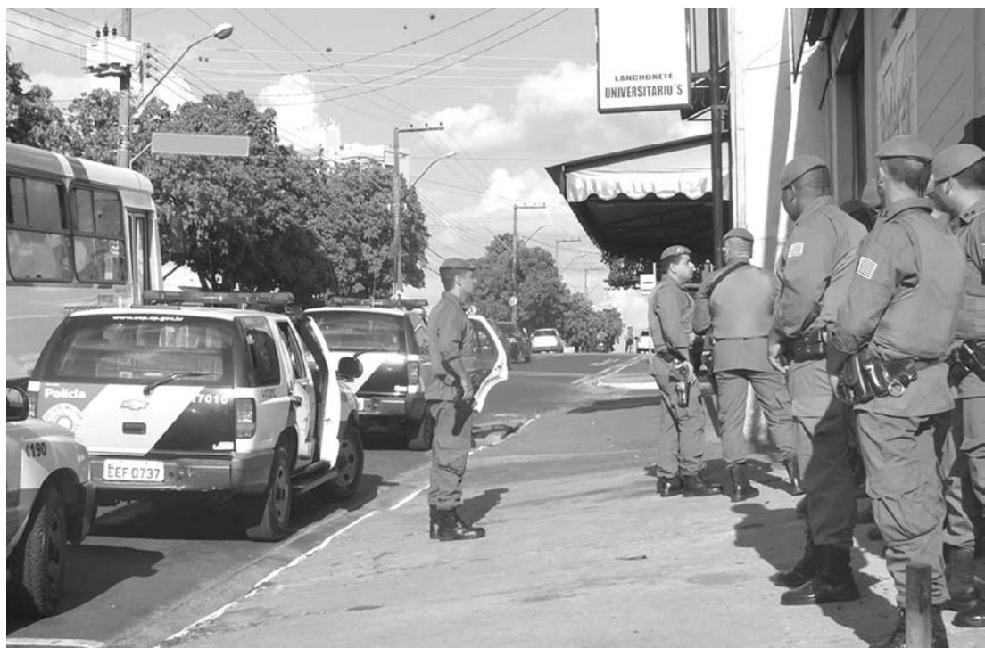
Serão realizadas rondas nos bairros e nas áreas eleitorais para coibir a panfletagem após as 22h

Haverá esquema especial de policiamento também nos locais de votação e nos cartórios eleitorais, inclusive durante a apuração. Também foram organizadas rondas específi-