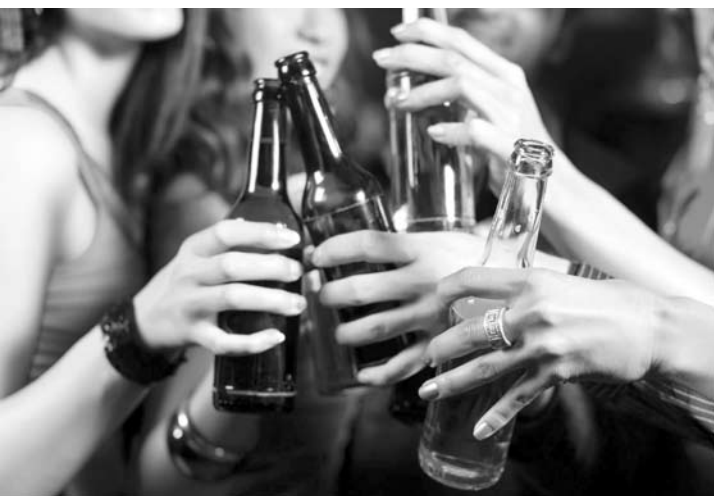
O comércio de bebidas é liberado, desde que os funcionários possam votar entre 8h e 17h

A venda de bebidas alcoólicas será permitida durante as eleições no Estado de São Paulo, segundo informou o Tribunal Regional Eleitoral de São Paulo (TER-SP). A corte, junto com a Secretaria de Segurança Pública, decidiu não elaborar portaria para proibir a comercialização de bebidas alcoólicas nos dias 5 (1º turno) e 26 de outubro (2º turno).