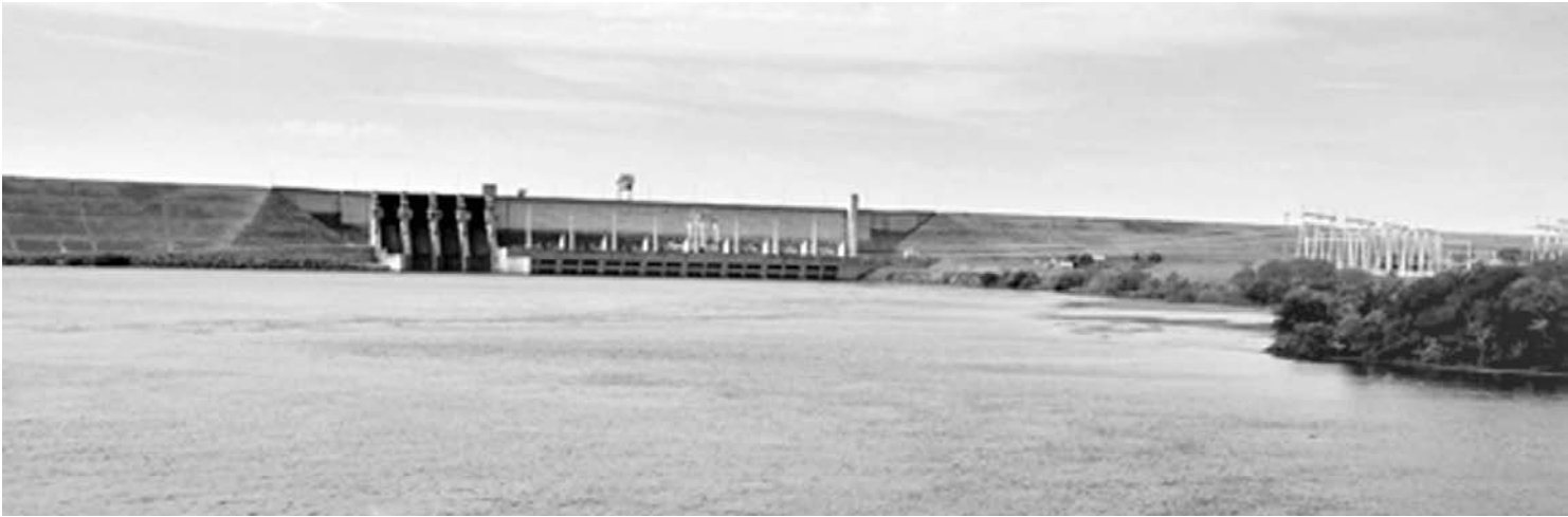
Valor é referente aos investimentos não amortizados feitos na Usina Hidrelétrica Três Irmãos

1,7 bilhão. No entanto, a proposta não foi aceita, pois a previsão era de que o pagamento fosse feito ao longo de sete anos. No cálculo apresentado no processo movido pela estatal, os investimentos na usina somaram aproximadamente R$ 4,8 bilhões, dos quais cerca de R$ 2,5 bilhões não foram depreciados a custo histórico. Atualizado pelo IGP-M (Índice Geral de Preços - Mercado), esse valor não depreciado sobe para os R$ 6,7 bilhões pedidos. O montante é praticamente