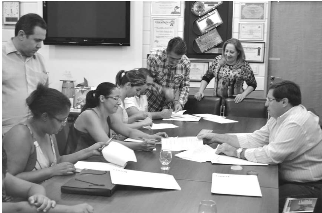
Registro da entrega das 5 primeiras chaves das casas do conjunto habitacional aos novos moradores

dias e agradeço demais a compreensão de vocês depois de tanta luta. Quero pedir que nos ajudem a cuidar das outras casas até que os trabalhos sejam concluídos, assim, a entrega será mais rápida”, disse a prefeita.