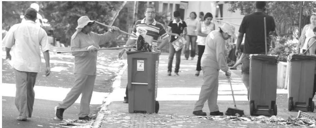
Varredoras da empresa Proposta estarão nas ruas até o início do horário de votação em 17 locais

A legislação estabelece que, no dia da eleição, é crime, sujeito à pena de detenção de seis meses a um ano e multa de R$