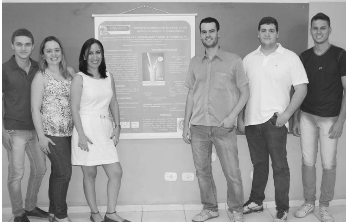
Grupo de pesquisa multidisciplinar dos cursos de Engenharia de Alimentos e Fonoaudiologia da FEF

e consolidado nos meios acadêmico, científico-tecnológico, governamental e empresarial, tendo reunido desde sua primeira edição mais de 20 mil participantes. O CBCTA é o mais tradicional evento promovido pela Sociedade Brasileira de Ciência e Tecnologia de Alimentos (SBCTA) e atinge o núcleo de interesse de diversas carreiras e, pela sua magnitude dentro da ciência de alimentos, o fluxo de trabalhos enviados é considerável, o que ressalta