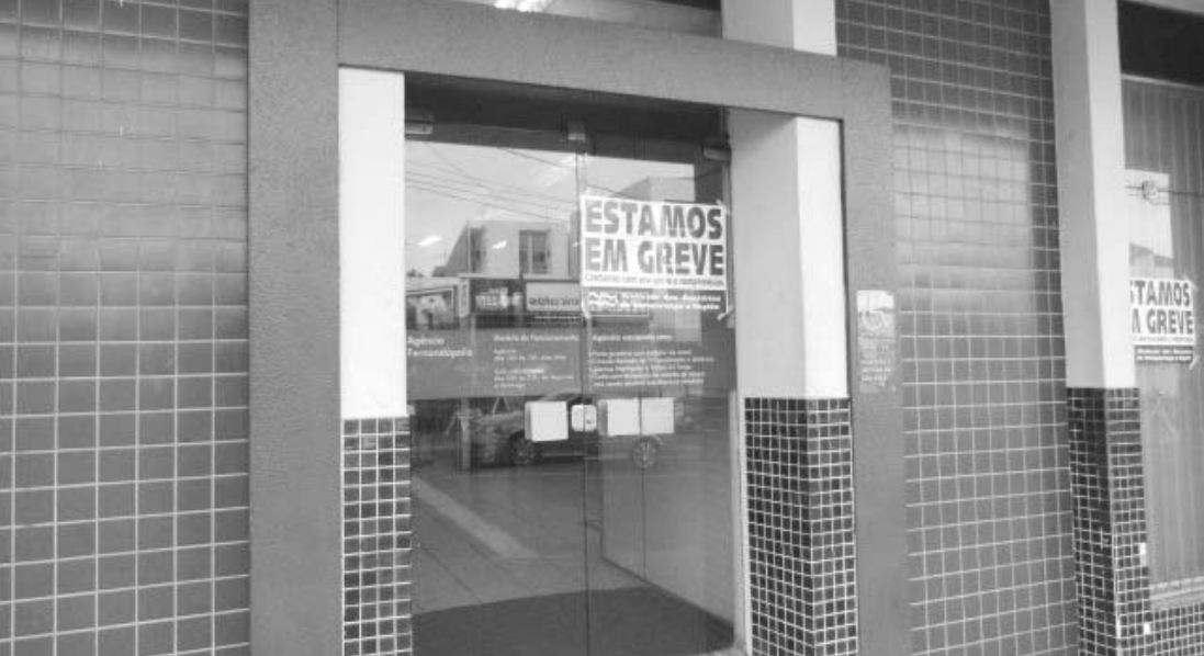
Na manhã de ontem, agências amanheceram novamente com adesivos colados nos vidros, indicando a paralisação

conta que uma rodada de negociações foi realizada na tarde de ontem. Na próxima segunda-feira, a proposta será avaliada pela categoria, que poderá dar fim à paralisação caso aconteça negociações positivas com a Federação Nacional dos Bancos (Fenaban). Mesmo com o fechamento das agências, clientes e correntistas, no entanto, não podem deixar de pagar contas e devem procurar alternativas como a internet, o autoatendimento e os correspondentes bancários, como as Lotéricas.