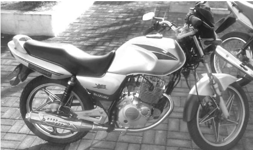
O foragido foi encontrado no Parque Industrial de Ouroeste de moto e apresentou nome falso