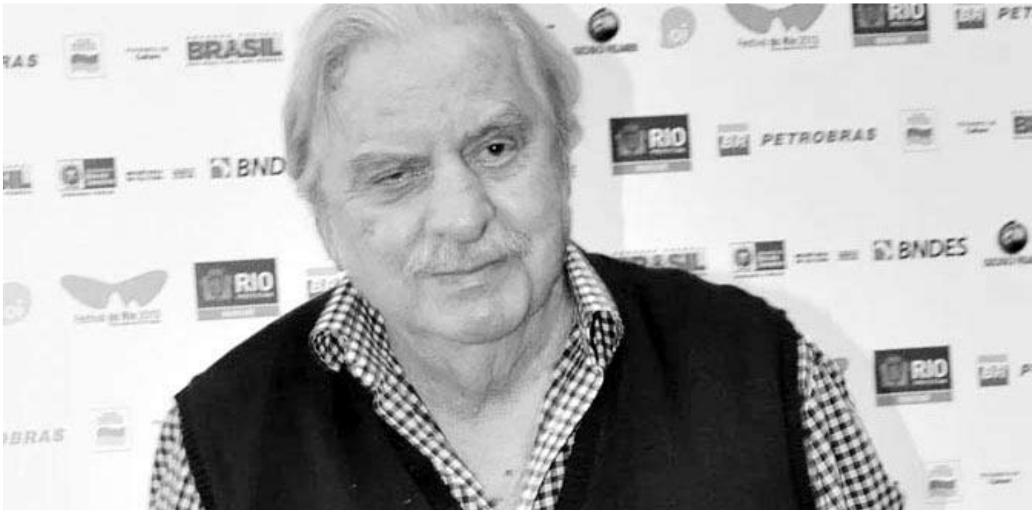
Veterano do cinema e da teledramaturgia nacional estava internado há cerca de uma semana devido a complicações causadas por um câncer no pulmão

O velório do ator aconteceu no domingo, dia 5, no Parque Lage, na zona sul do Rio. O corpo de Hugo Carvana foi cremado ontem em cerimônia apenas para familiares e amigos.