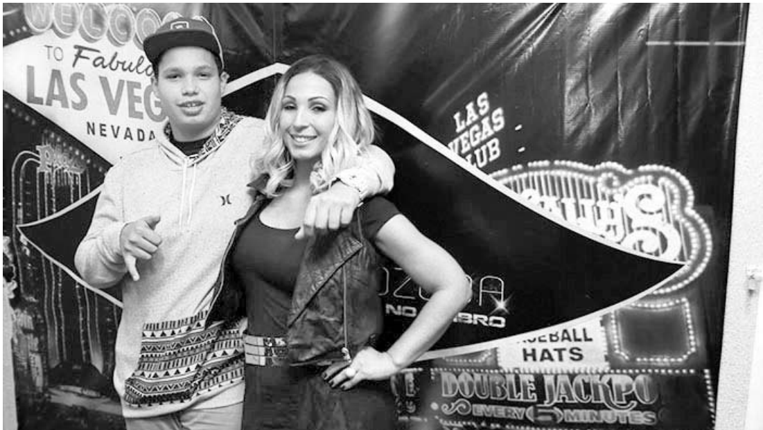
Valesca Popozuda festejou mais um ano de vida junto com o filho

Valesca Popozuda ganhou uma festona de aniversário no último domingo (5) por parte de seus amigos, porém a maior alegria para a cantora foi em poder celebrar também ao lado do filho, que também comemorou mais um ano de vida nos últimos dias.