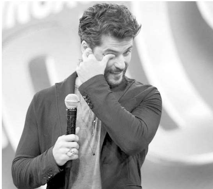
Ator participou do Domingo do Faustão e falou sobre sua carreira na televisão

mentamento com Giovanna Ewbank. Porém, o ponto alto da entrevista foi quando surgiu o depoimento da diretora a respeito de sua participação no novo seriado da emissora. Confira a fala de Glória que levou Bruno às lágrimas: “A primeira ideia foi que o Bruno fizesse (o papel de Edu na série). Fui desenvolvendo os capítulos e pensei: ‘Ele é muito jovem’. E o Bruno teimou, disse que era ele, bateu o pé. Ele fez o teste e não era mais jovem coisa nenhuma. Era o Edu perfeito. Não poderia ter sido outro. Ele é um ator visceral”.