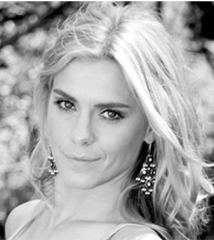
Personagem de Carolina Dieckmann sofre abuso sexual em série de TV

na infância. O criminoso foi um tio pedófilo. O papel da criança será de Mel Maia. A série, chamada Mulheres Que Amam Demais, terá ainda Marjorie Estiano e Paula Burlamaqui, vivendo um casal. Susana Vieira também está escalada, além de Marcos Caruso e Luis Gustavo.