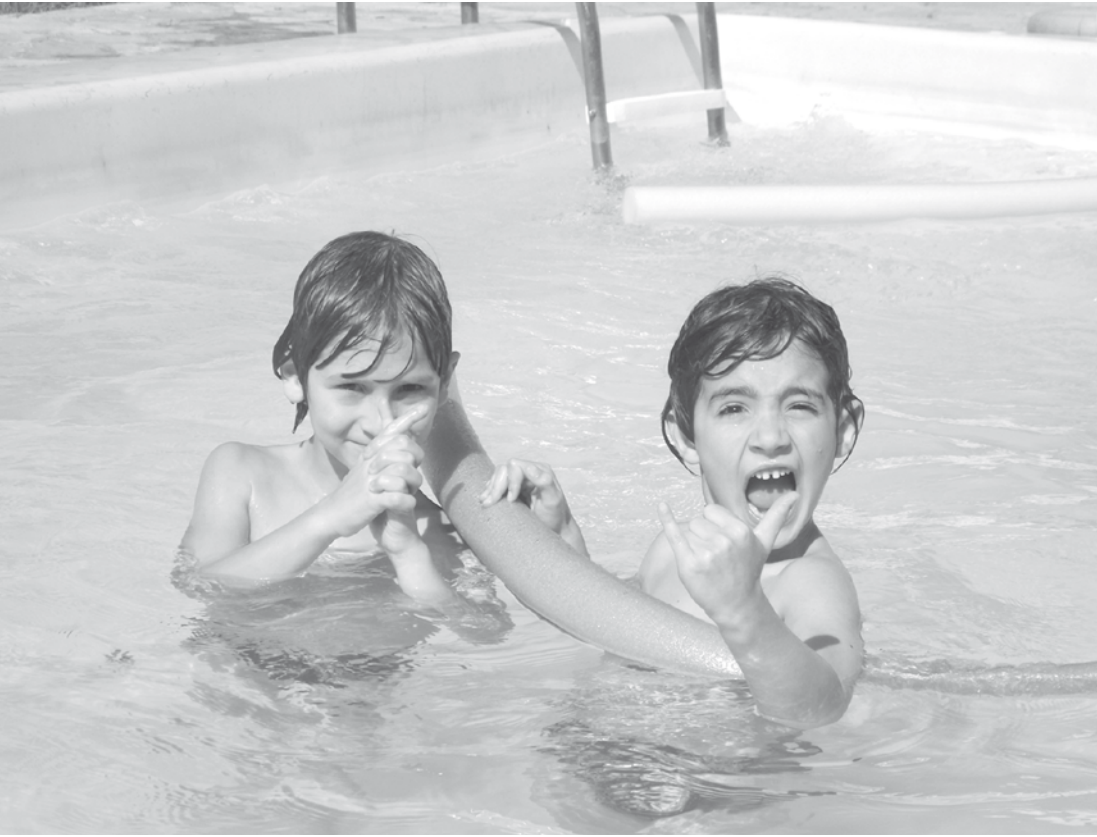
Na semana de recesso nas escolas, crianças e jovens poderão aproveitar para nadar nas piscinas e praias da região

QUEIMADAS A massa de ar seco que persiste sobre a região favorece a ocorrência de queimadas e incêndios florestais. As queimadas podem ter relação com a inversão térmica, que ficou mais forte nos últimos dias sobre a região e, com isso, o material particulado fica concentrado numa camada não maior que 800m de espessura. Mas o rompimento só deverá ocorrer com a passagem da frente fria, ainda que em alto-mar, entre terça e quarta-feira da semana que vem. CANAVIAIS Segundo a União da Indústria da Cana de Açúcar (Única), do início da safra até agora, São Paulo registrou 2.981 focos de queimadas em canaviais, número 140% maior do que o registrado no mesmo período do ano passado. Dessas queimadas, 5% atin-