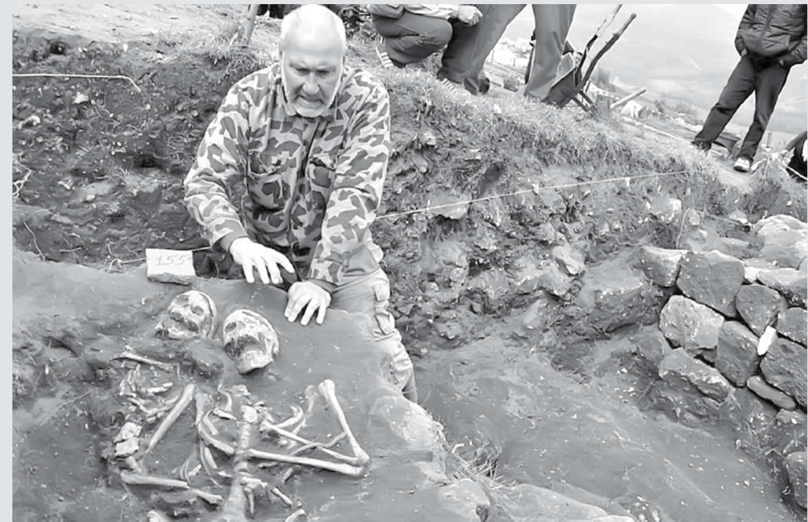
imagem do dia

Arqueólogo búlgaro mostra esqueleto do século 13, enterrado com faca no coração, em ritual para evitar que virasse vampiro. Segundo as crenças pagãs, as pessoas que eram consideradas más durante sua vida podiam se transformar em vampiros após a morte. “Este homem (de aproximadamente 30 anos de idade) não era um vampiro, mas foi submetido a um ritual pagão guiado pela superstição para impedir que virasse vampiro depois de sua morte”, explicou o arqueólogo.