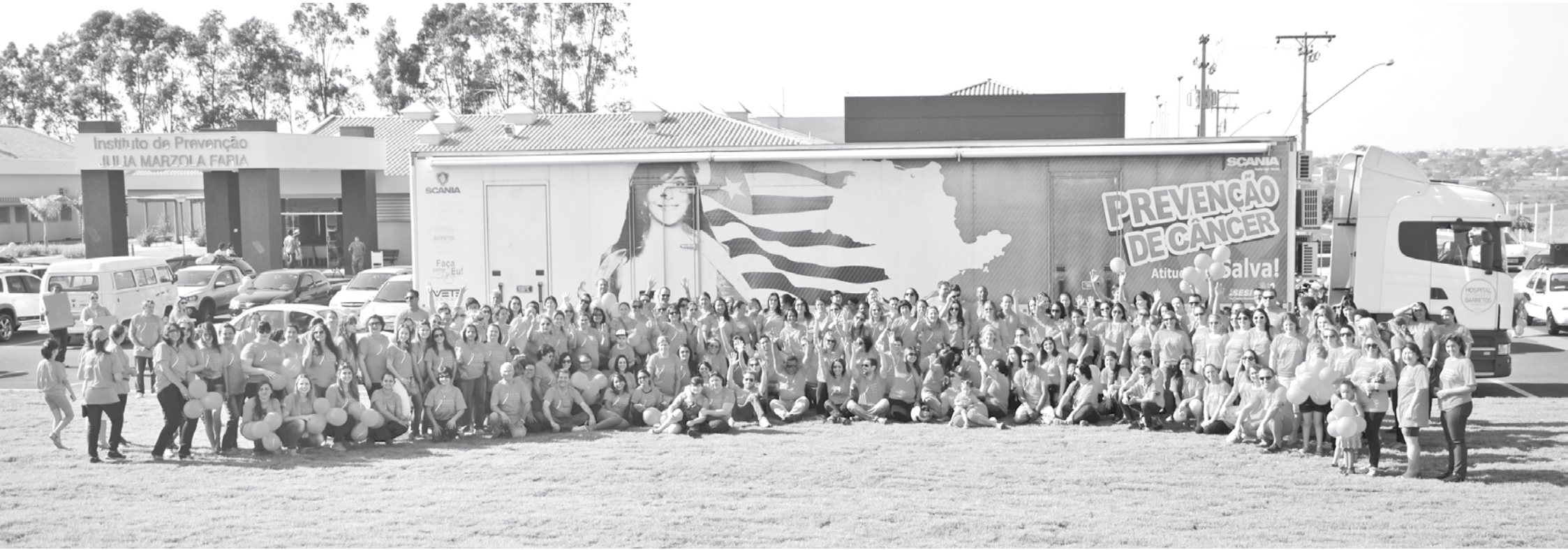
Participantes da Campanha “Outubro Rosa” usam camisetas em comemoração ao mês da conscientização da mulher

Evento que percorreu as principais ruas de Fernandópolis teve como proposta orientar as mulheres sobre a importância da prevenção e do diagnóstico precoce do câncer de mama