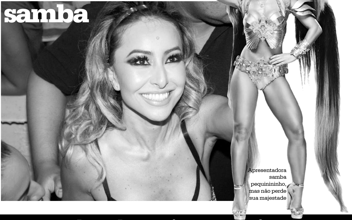
Apresentadora de samba pequenininha, mas não perde sua majestade

R ainha de Bateria que se preze não pode ficar de fora dos ensaios. Por isso, mesmo ainda se recuperando de uma operação de troca de suas próteses de silicone – algo que as mulheres adeptas da cirurgia precisam fazer, em média, de 10 em 10 anos -, ela caiu no samba na quadra da Vila Isabel no último sábado, 18. Mas tudo com responsabilidade, como mostram as fotos ali em cima, além de sua declaração para a revista Quem: “hoje vou sambar devagarzinho. Troquei o silicone há um mês e não posso dançar muito nem malhar”. Não aparecer, porém, não é uma opção. “A rainha precisa ter personalidade e saber a responsabilidade que tem sobre ela. A magia da bateria começa no coração. É impressionante como tem samba bom concorrendo e a gente está querendo ousar como sempre”. E, por fim, disse: “Cada ensaio para mim é um acontecimento. O respeito e carinho que tenho pela comunidade é enorme. No início eu vinha de shortinho e tal. Mas pensei: eles precisam que eu me arrume para eles e merecem esse carinho.