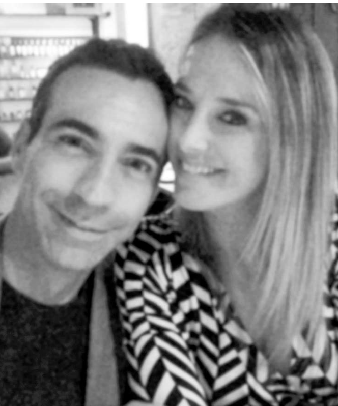
Cesar Tralli e Tici Pinheiro

Um dos casais mais inusitados entre os famosos brasileiros desde que Ciro Gomes e Patricia Pillar reatou. Estamos falando do jornalista César Tralli e da apresentadora-barra-filha-da-garota-de-Ipanema-barra-mãe-da-Rafa Ticiane Pinheiro.