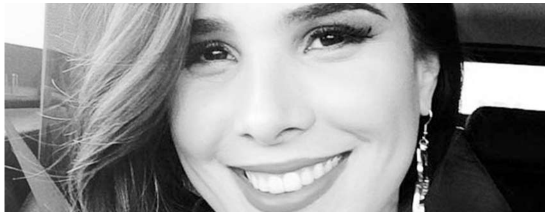
A cantora revelou que está aos poucos retomando a agenda de shows