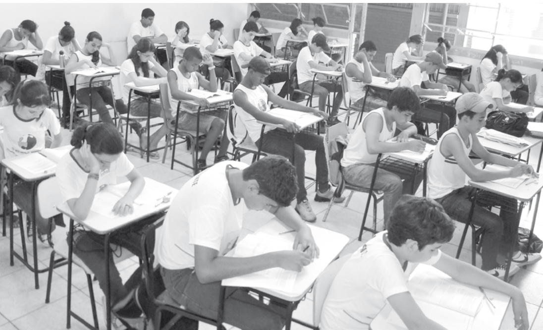
Matrículas já estão abertas e podem ser efetuadas antecipadamente

Também estão abertas inscrições para jovens e adultos que queiram ingressar nos anos finais do Ensino Fundamental e Ensino Médio