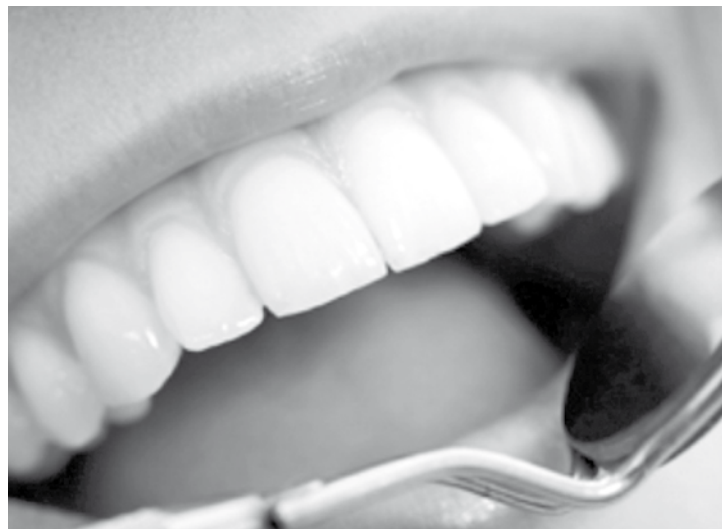
Mais uma iniciativa da OAB em benefício dos profissionais do Direito