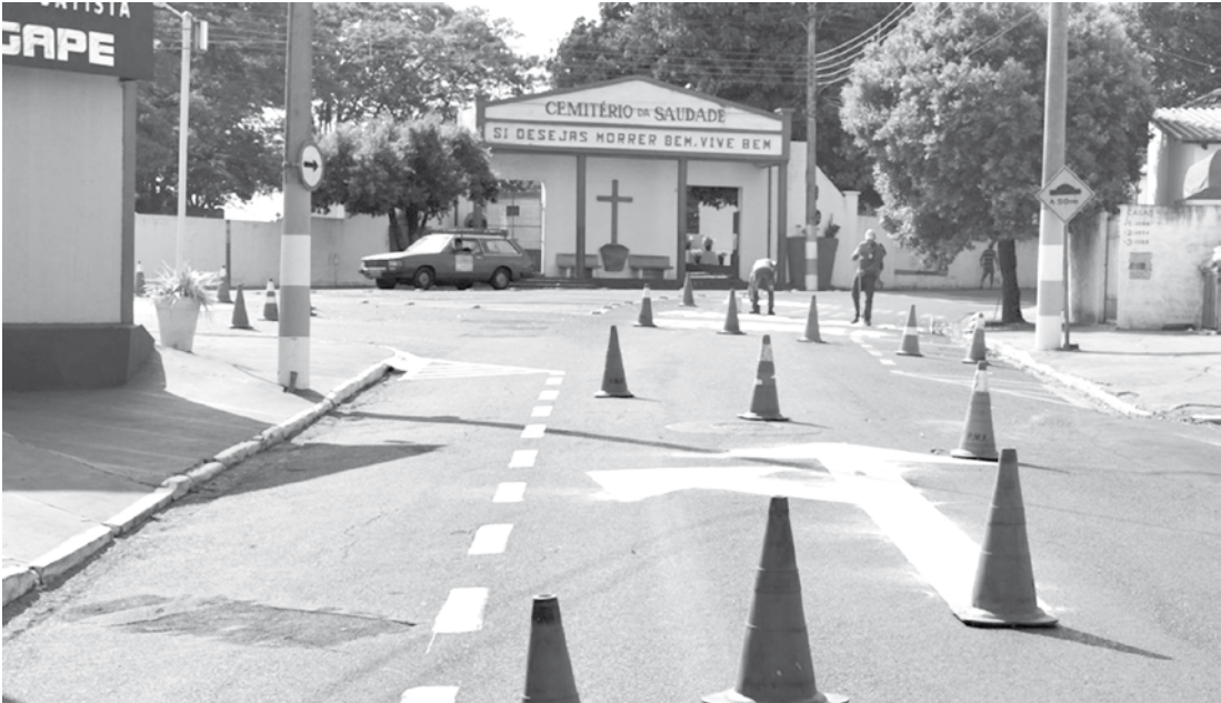
Serviços de reforma, manutenção e demais preparativos para o Dia de Finados são realizados na cidade

SERVIÇO: Escritório dos Cemitérios Avenida da Saudade Telefone – (17) 3442-2800