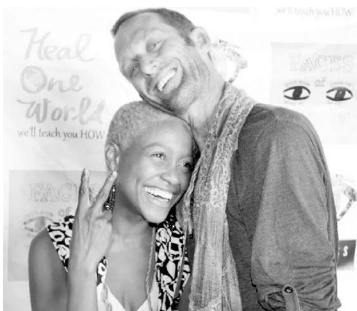
Danièle e o namorado

a polícia de Los Angeles acusou os dois por atentado ao pudor público, o que pode levar a até seis meses de prisão. A autuação está baseada nos áudios das denúncias feitas por telefone, no áudio da abordagem feita pelos policiais e em fotos do casal dentro do carro.