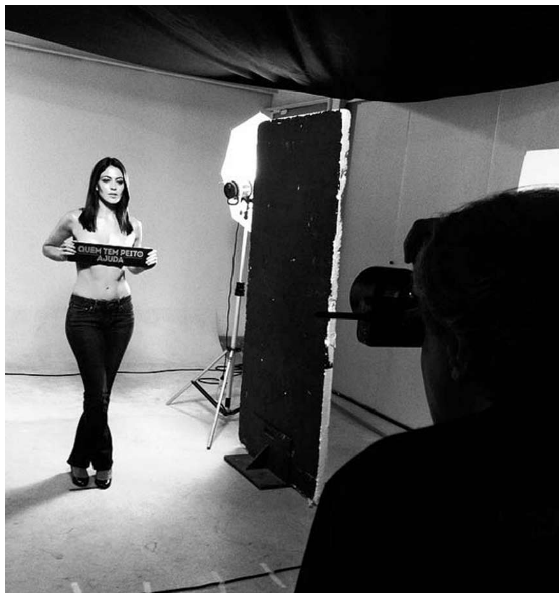
A atriz posou como parte de uma campanha para conscientização