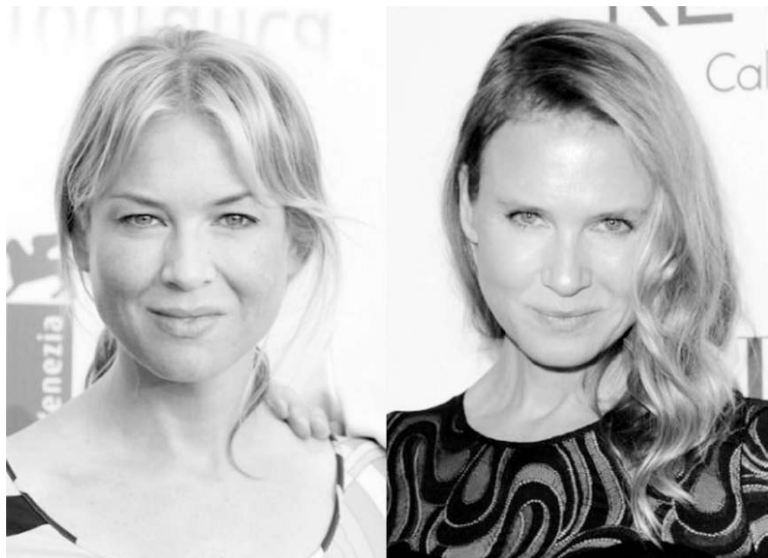
Intérprete de Bridget Jones não tem mais as bochechas características de sua face, está com um novo nariz e um olhar bem diferente.

Renée Zellweger, a eterna Bridget Jones, surgiu irreconhecível em festa realizada pela revista Elle Mulheres em Hollywood. Depois de algum tempo fora dos holofotes, a atriz exibiu um rosto completamente diferente. As rugas