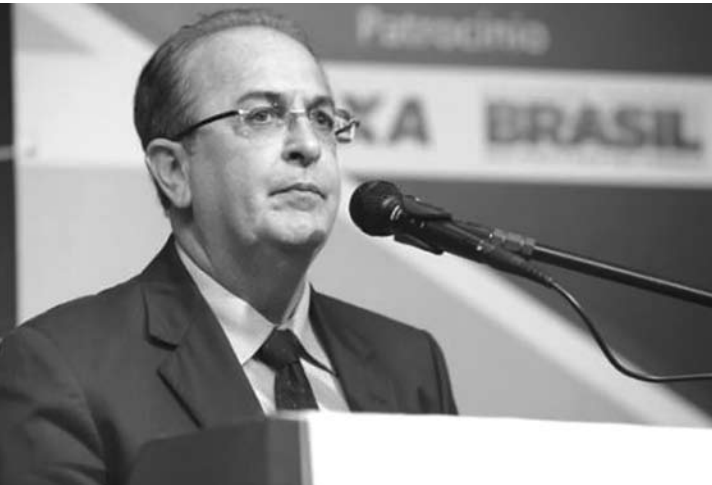
Motta afirma que confiança dos eleitores foi o maior presente que já recebeu em sua vida

benefícios, assistência jurídica, orientação trabalhista, serviço odontológico, vídeo locadora e sala de informática.