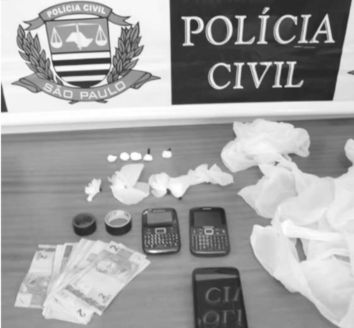
Dinheiro, droga e celulares apreendidos