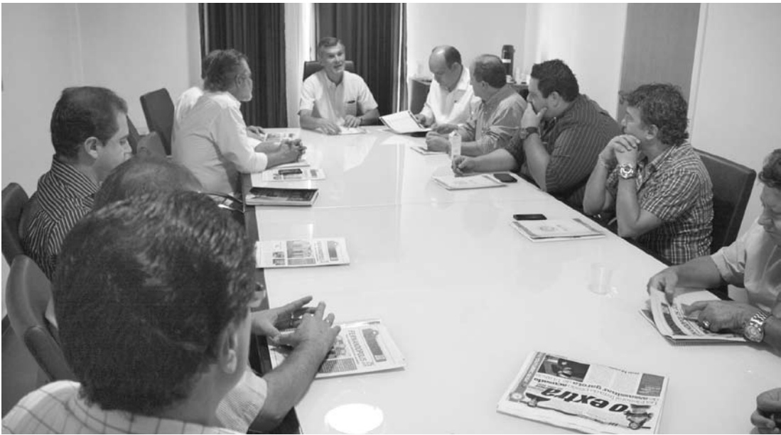
Encontro na manhã de ontem na FEF debateu sobre a rádio FM da Fundação; abaixo, registro dos participantes do café da manhã na instituição de ensino de Fernandópolis

Neste café da manhã, todos os presentes confirma-