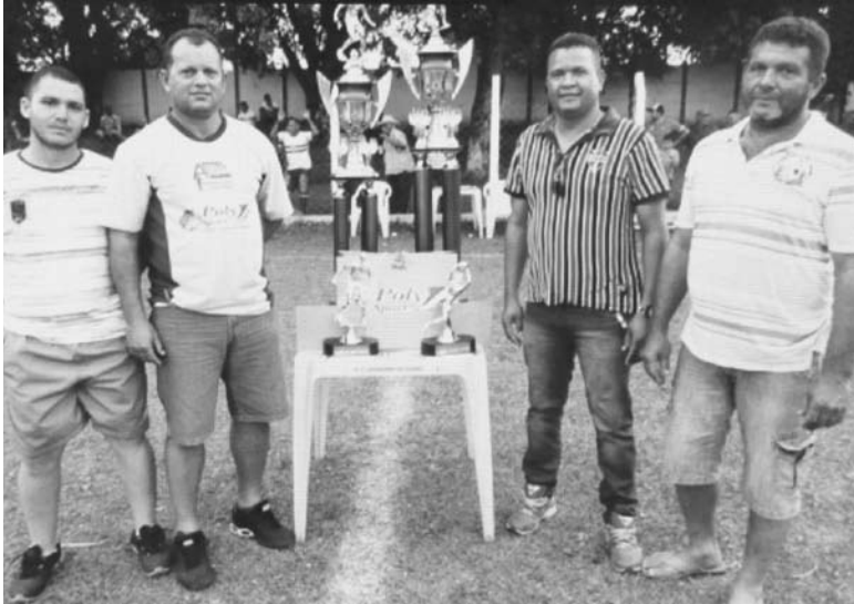
Membros da Associação de Bairro “Amigos de Arabá”, responsável pela organização do campeonato