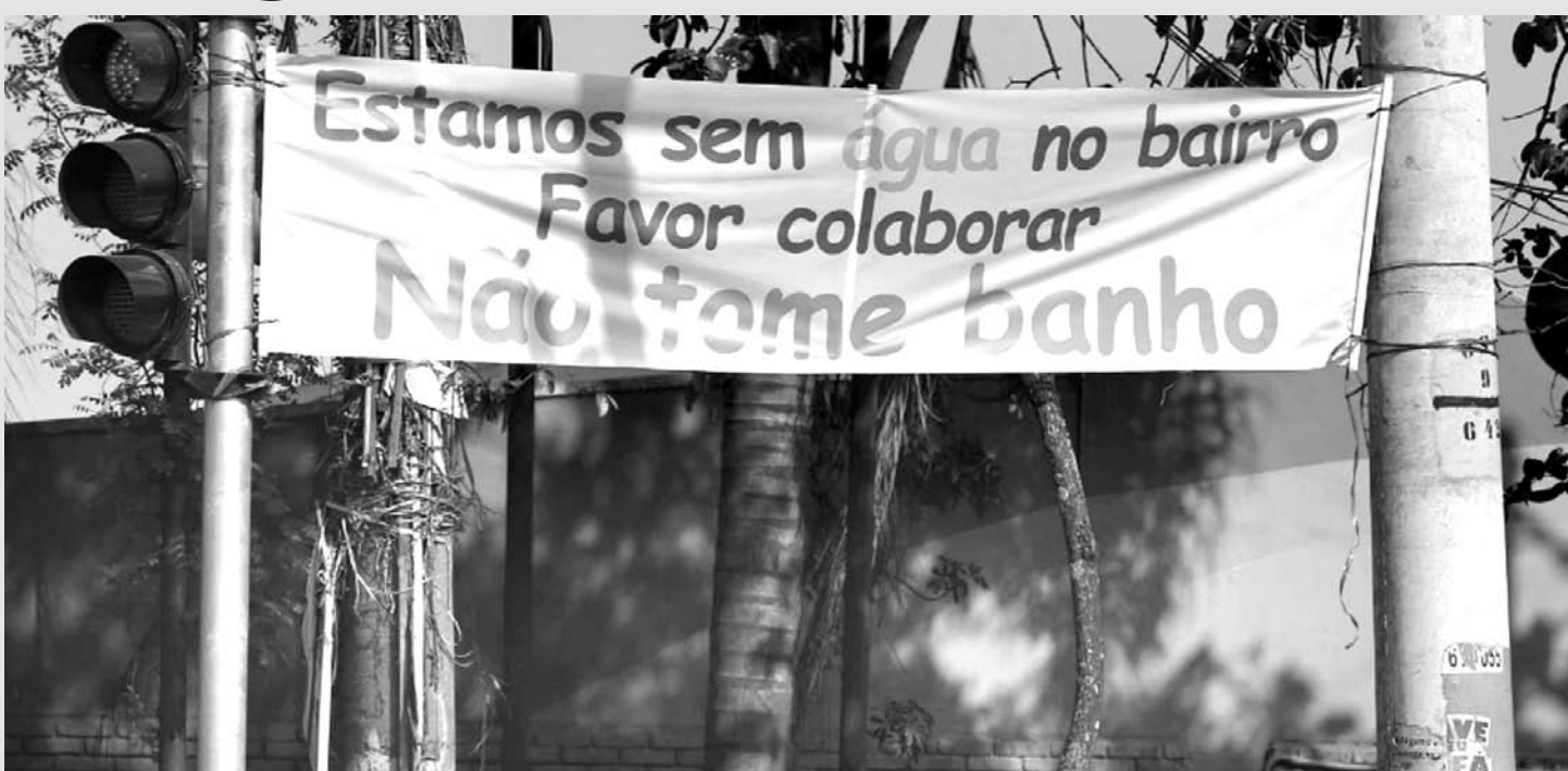
Na manhã de ontem (24) moradores do Bairro Helena Maria, em Osasco (SP), estenderam faixa em que pedem para a vizinhança evitar tomar banho devido à falta d'água.