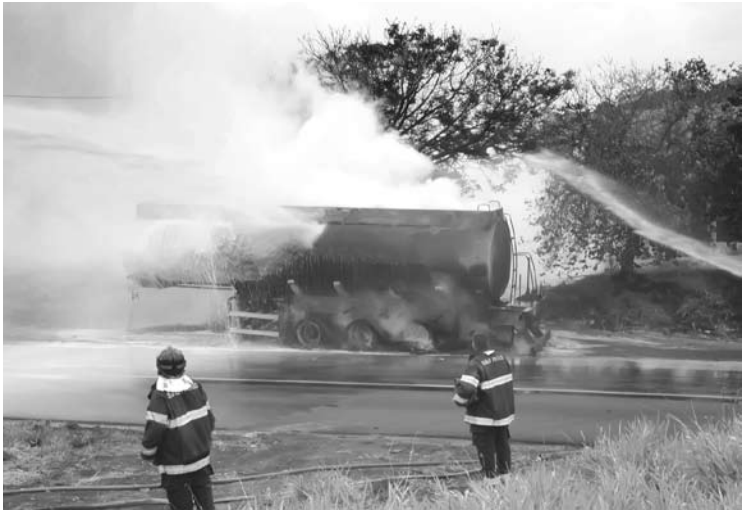
Fogo foi controlado pelo Corpo de Bombeiros com apoio da Prefeitura de Mira Estrela; a Polícia Rodoviária fez o controle do trânsito