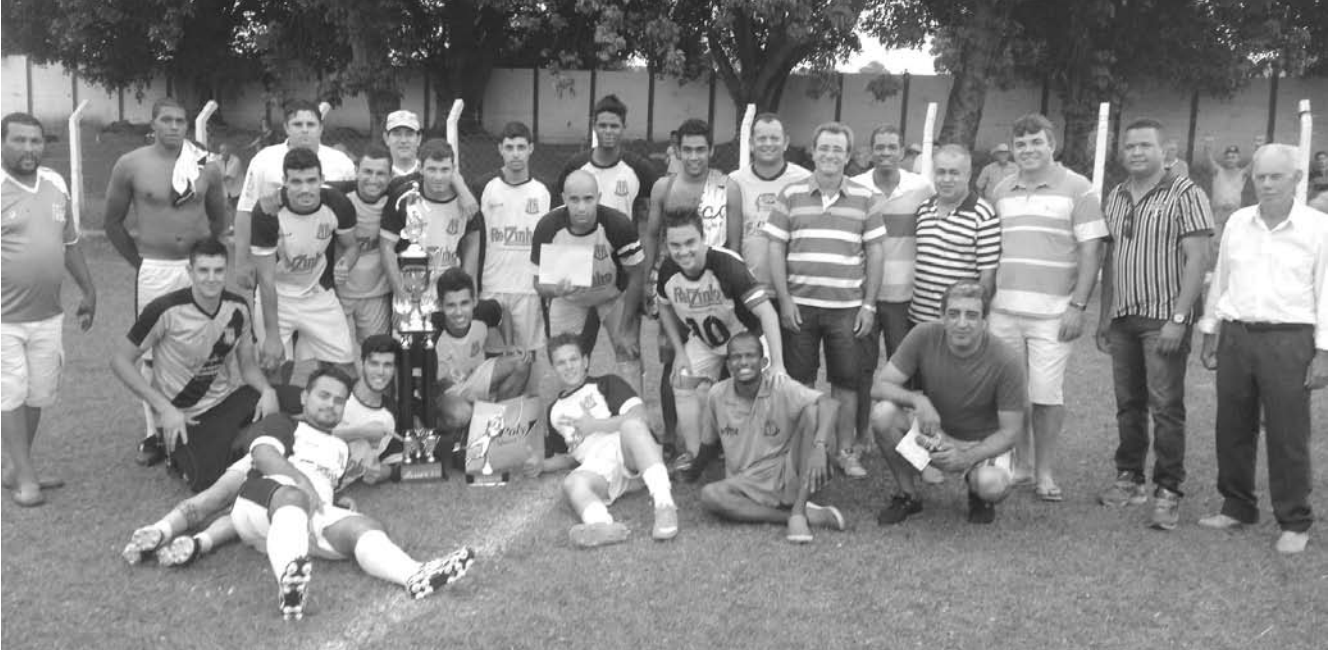
Jogadores e equipe técnica que integram o Clube Esportivo de Ouroeste junto aos torcedores após a conquista do título

ce, uma premiação em dinheiro e teve o artilheiro da competição. O campeonato teve início no mês de agosto com a partici-