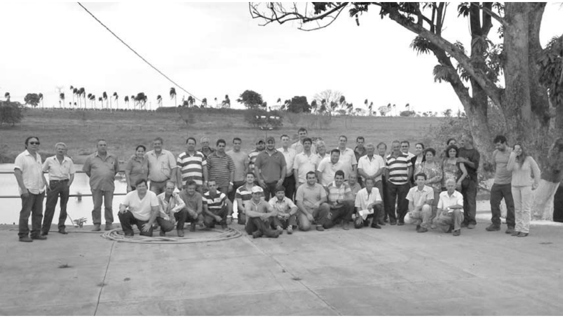
A capacitação sobre Piscicultura contou com a participação de 51 pessoas, entre piscicultores da região e técnicos da Regional da CATI de Fernandópolis