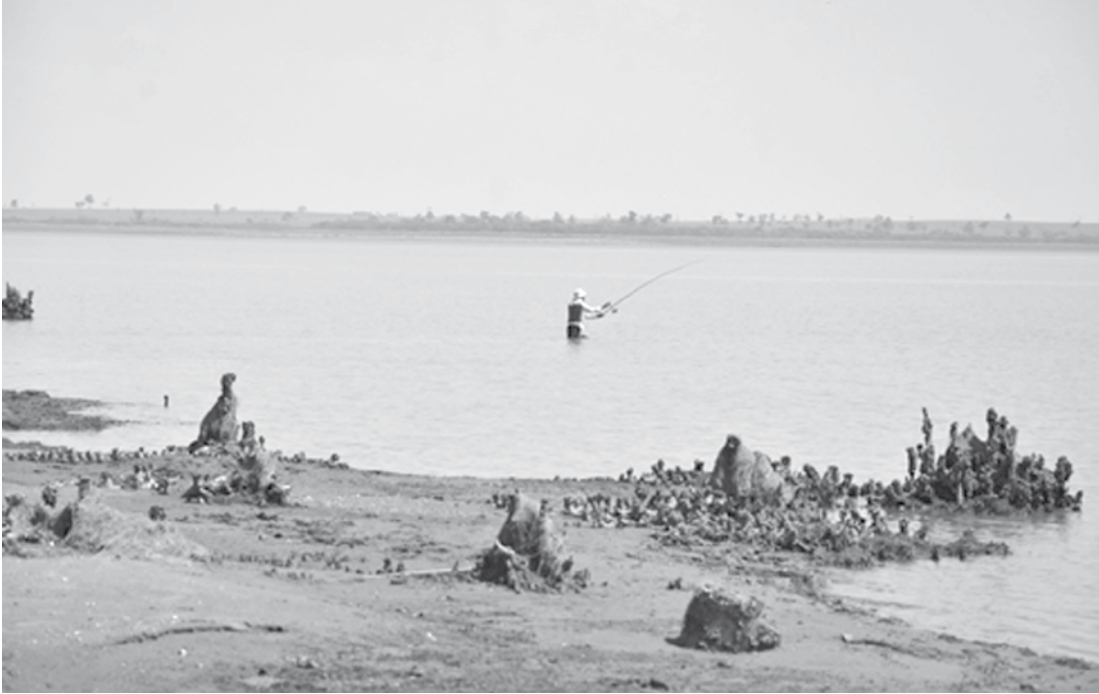
A falta de água nas margens prejudicou a entrada dos turistas na água

A diretora de Turismo de Ilha Solteira, Osmarli Al-