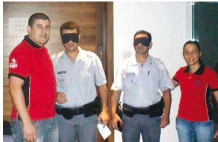
Convidados e autoridades participaram da dinâmica de vivência proposta pela entidade