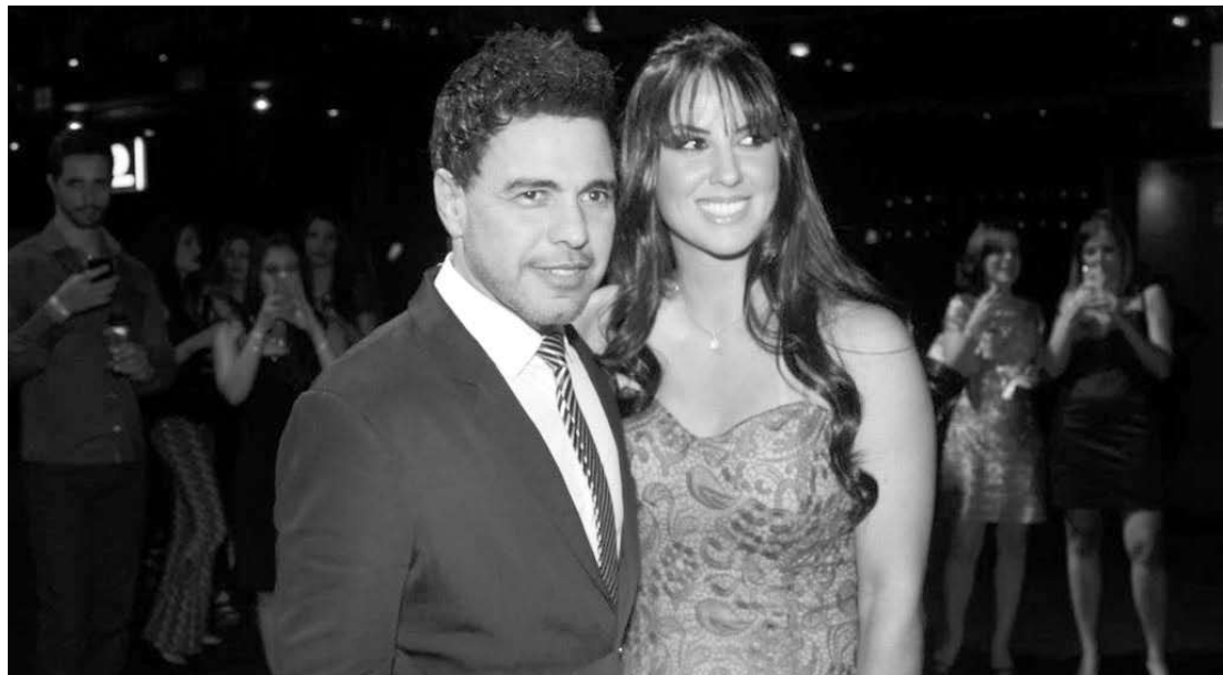
Cantor disse que homenagem foi uma surpresa, mas alguns seguidores duvidam da autenticidade