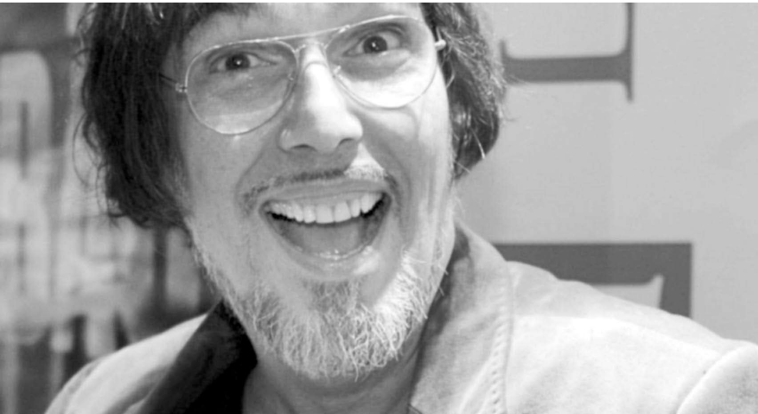
“Diga ao povo que fico” escreveu o cantor na rede social após a decisão das eleições. Blefou na disputa eleitoral