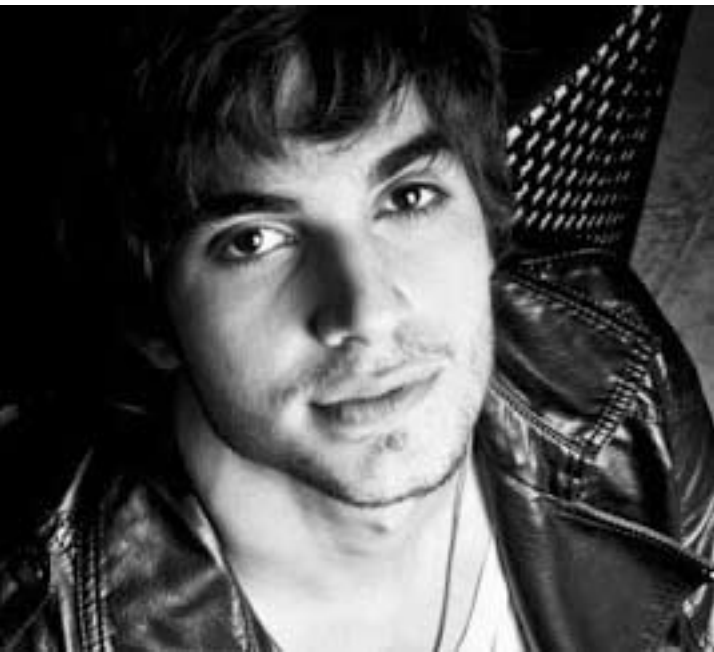
Jovem cantor e ator está curtindo sua nova fase