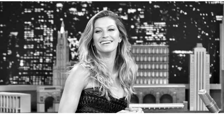
A modelo esteve com o líder espiritual no último sábado, primeiro de novembro