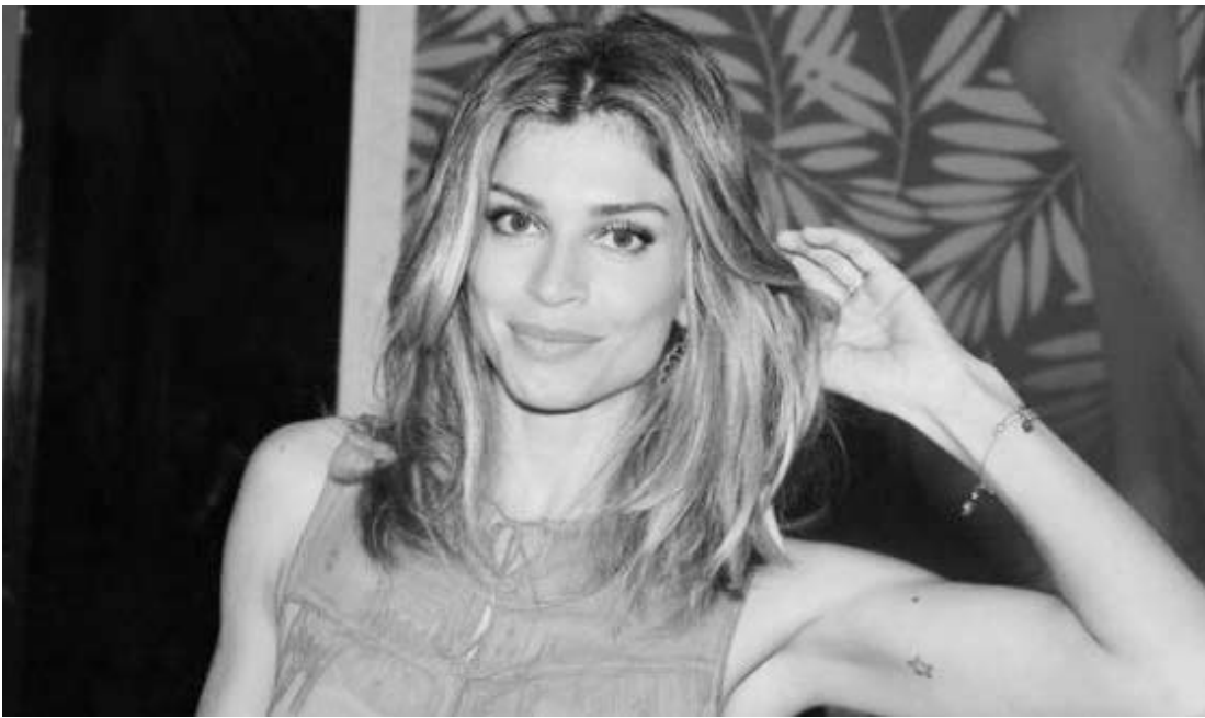
Ex-casal reacendeu a possibilidade de que estariam juntos compartilhando a mesma imagem no Instagram.

tem Sophia. No mês passado, o ex-casal causou alvoroço nos fãs após compartilhar a mesma foto no Instagram. Apesar de sempre tentarem driblar os paparazi, os encontros dos dois estão se tornando cada vez mais frequentes.