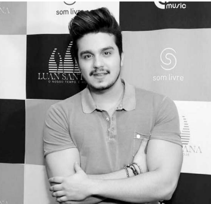
Para o cantor está tudo bem se são todos adultos, vacinados e conscientes

O que para muitos homens é um sonho inatingível, para Luan Santana é uma experiência a mais em seu currículo como cantor sertanejo. Estamos falando de sexo com mais de uma pessoa ao mesmo tempo.