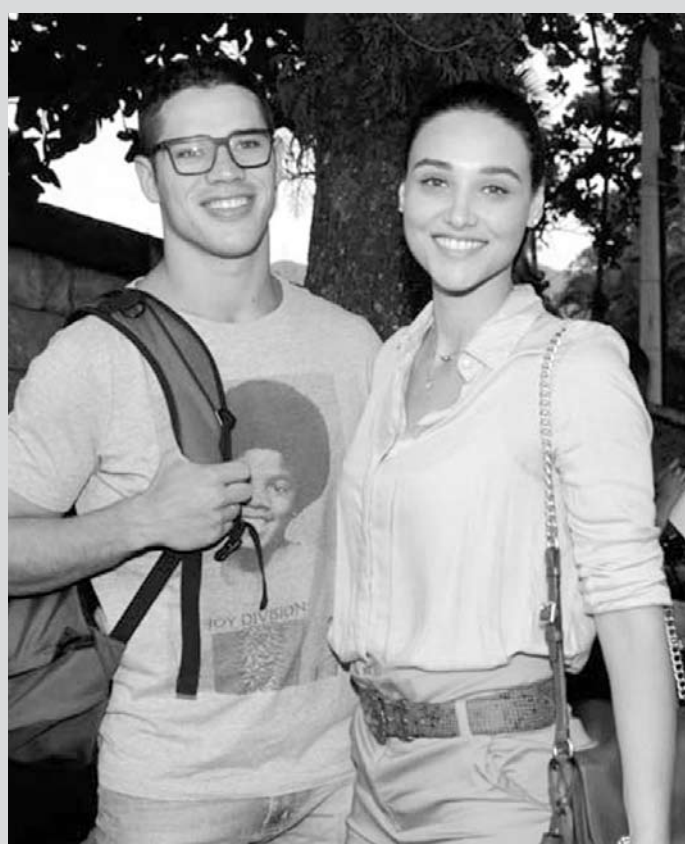
A atriz acha que as pessoas têm a cabeça muito fechada

Mas gostaria de não estar: “Gosto mais de namorar do que ficar sozinho. Sou romântico, gosto de tratar minha namorada bem, de dar presentes. Mas equilíbrio as coisas: não sou pegajoso demais, não fico ligando a toda hora. Gosto de menina meiguinha, com cara de bonequinha, mignonzinha, sabe”?