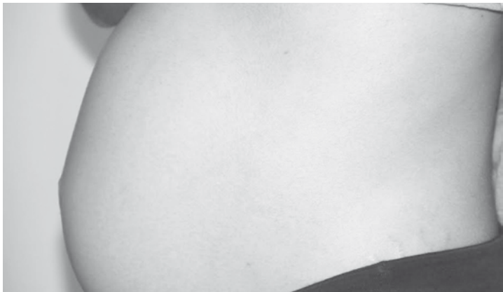
Toda gestante que estiver entre a 27ª e 36ª semana de gestação deverá ser vacinada