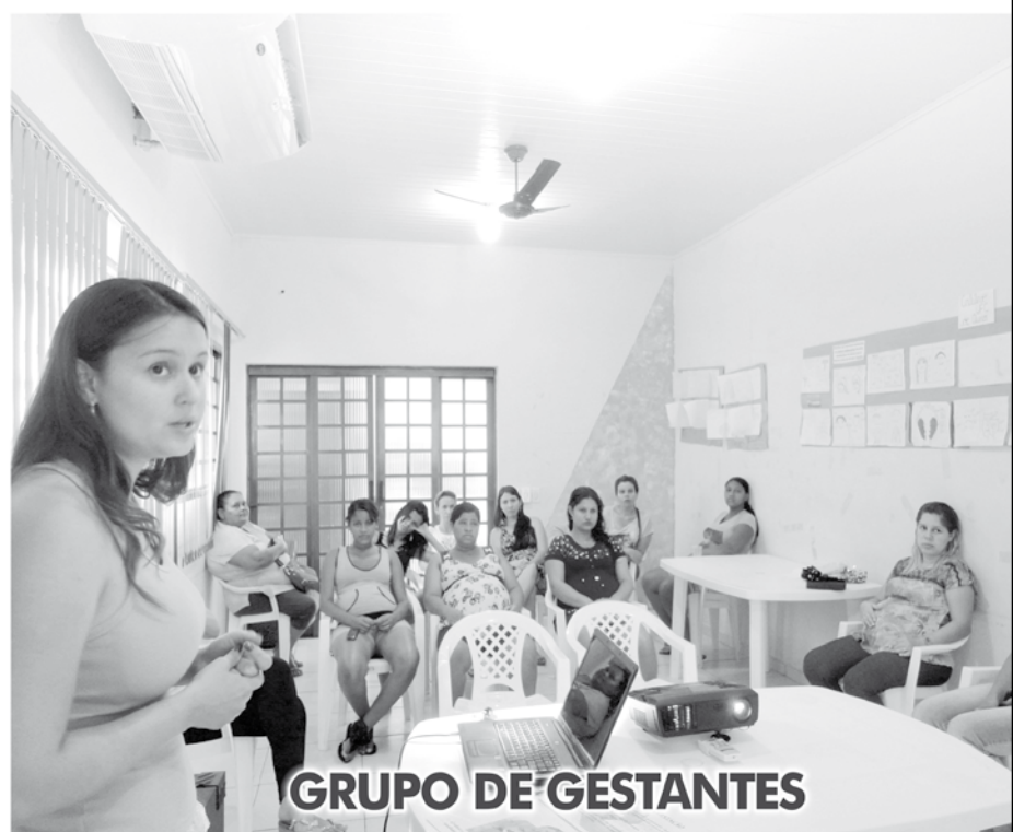
GRUPO DE GESTANTES