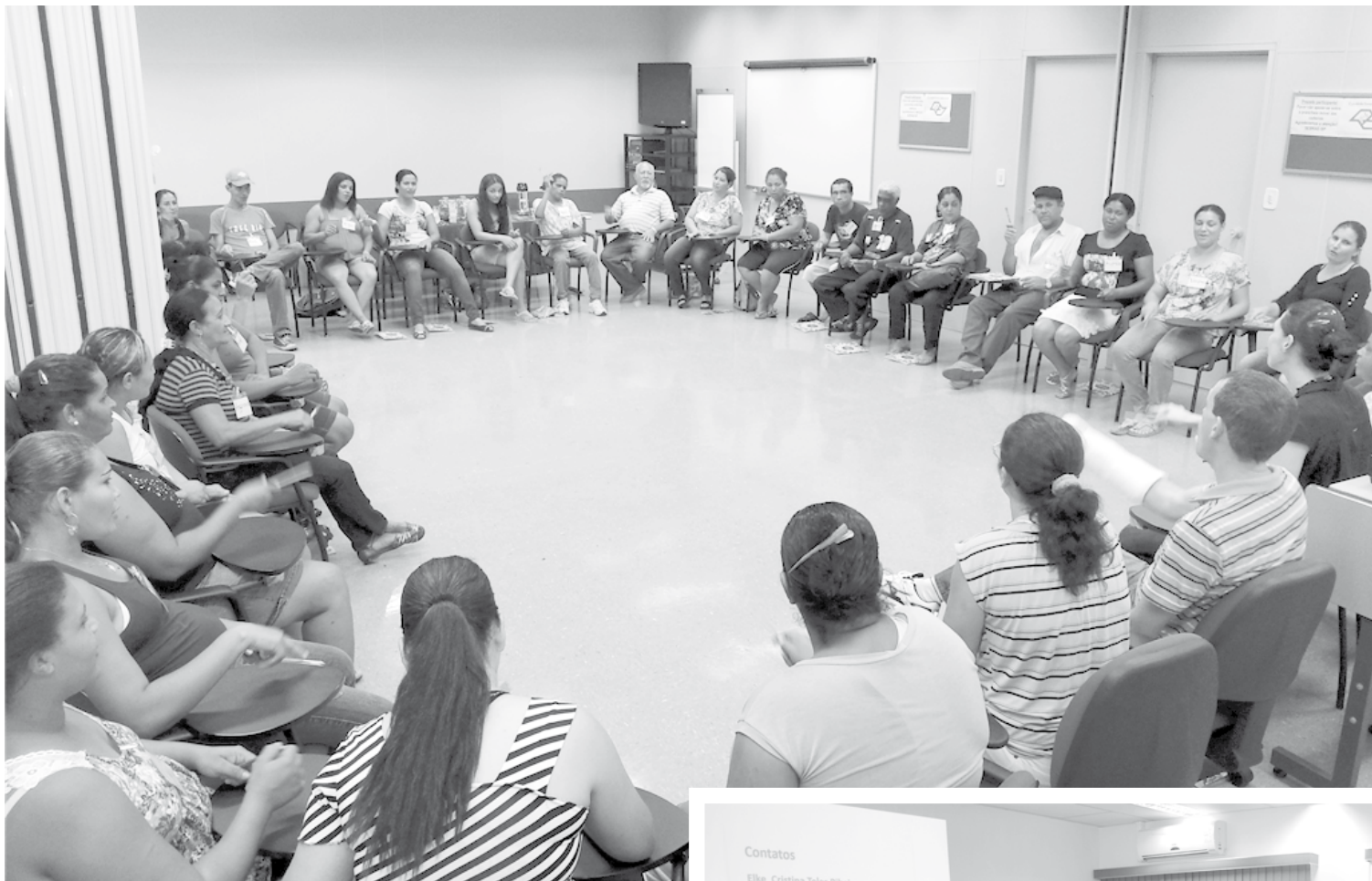
Registros de seminários realizados pelo Sebrae-SP; em Fernandópolis, parceria com a ACIF proporcionará ampla orientação

Pela primeira vez em Fernandópolis, o Escritório Regional do Sebrae-SP promove amanhã, dia 7 de novembro, às 9h, o Seminário “Acesso a Crédito”. Na oportunidade, empreendedores poderão solucionar dúvidas e entender como podem se beneficiar com produtos oferecidos pelo BNDES (Banco Nacional de Desenvolvimento Econômico e Social). Após o seminário com representantes do BNDES, os participantes terão a oportunidade de conversar também com representantes do Banco do Brasil, Caixa Econômica Federal e Bradesco sobre linhas de crédito e financiamentos. O seminário é gratuito e será ministrado pelos técnicos do BNDES no auditório da ACIF (Associação Comercial e Industrial de Fernandópolis). As inscrições já estão abertas e as vagas são limitadas. “O Seminário de Crédito é um evento ancorado em uma apresentação realizada pelo BNDES, onde é exposta toda a sua carteira voltada às micro e pequenas empresas, o que por si só já é um grande atrativo. Em seguida, se dará uma rodada de crédito, onde além do BNDES, outros bancos convidados farão atendimento ao