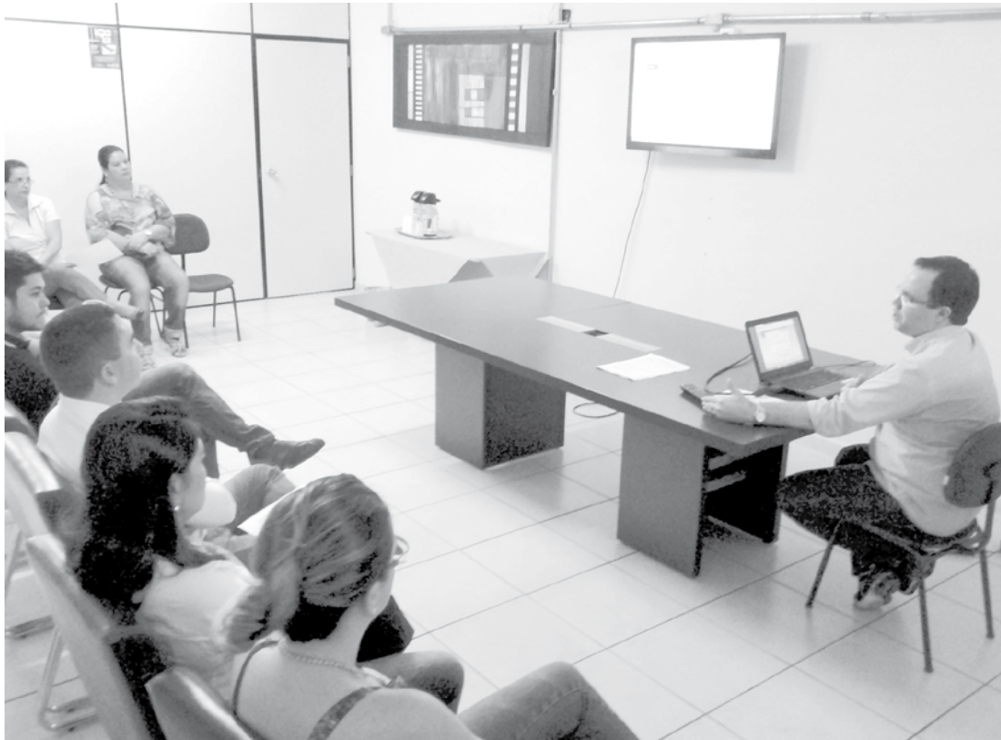
Em reunião na última sexta-feira, grupo de empresários participou de uma demonstração do funcionamento da campanha

Além das reuniões na Associação, a equipe da ACIF está realizando visitas aos empresários interessados em aderirem à campanha “Moro e Compro Aqui”. Nessas oportunidades são esclarecidas dúvidas sobre o software e a respeito dos procedimentos como cadastro, premiação e outros benefícios.