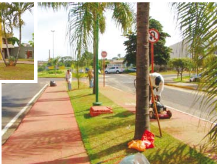
Praça do Teatro (no detalhe) e AV. Raul Gonçalves Jr., acima

A Prefeitura de Fernandópolis, através da Secretaria do Meio Ambiente, está realizando um mutirão de limpeza em vários pontos da cidade. Nesta segunda-feira (03), a Praça Cesar Azadinho, que abriga o Centro Cultural, teve a grama aparada e cuidados nos canteiros. A equipe da Secretaria também esteve realizando serviços de limpeza e poda de grama na Marginal Litério Greco e Avenida Raul Gonçalves. Nesse período de chuva, os cuidados com as praças e avenidas precisam ser redobrados, pois a grama cresce mais rapidamente.