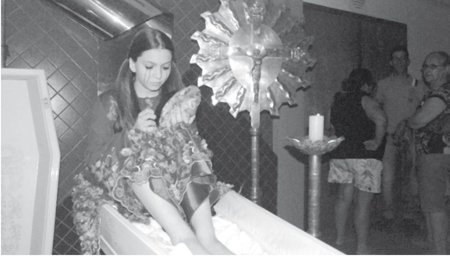
Espectáculo atraiu grande público ao Teatro Municipal “Merciol Viscardi”: peça foi acompanhada atentamente por toda a plateia

recentes – inclusive alguns ocorridos na cidade e região. Violência doméstica (física e psíquica), pedofilia, estupro e assassinatos reais, narrados por atrizes vestidas de vermelho posicionadas nas laterais do palco, enquanto a trama acontecia