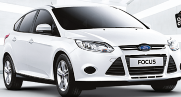
Focus Hatch S 1.6 2015 (cat. QAJ5)

Motor 1.6 Sigma (135cv) | Direção elétrica Ar-condicionado | Freios ABS com EBD Airbag duplo | Rodas de liga leve 16" Sync® Media System com Bluetooth e comandos de voz