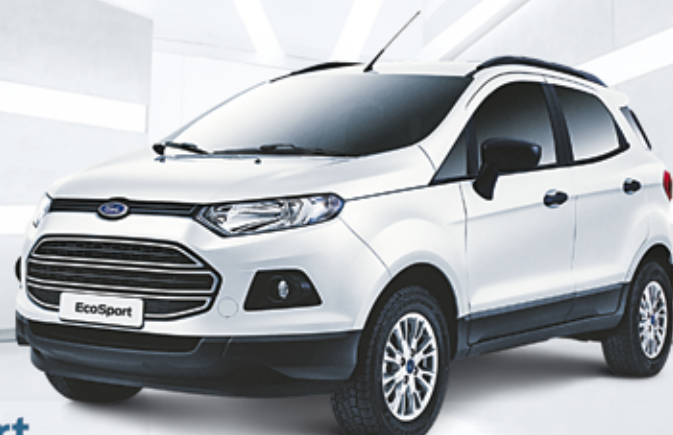
Ford EcoSport SE 1.6 2015 (cat. ECD5)

Freios ABS com EBD | Direção elétrica Rodas de liga leve 15" | Airbag duplo | Ar-condicionado Sync® Media System com comandos de voz e Bluetooth Vidros, travas e espelhos elétricos