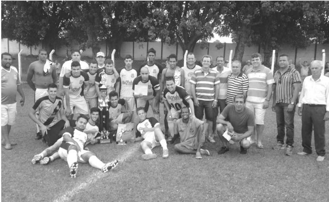
Jogadores e equipe técnica que integram o Clube Esportivo de Ouroeste junto aos torcedores após a conquista do último título, em Arabá

CATEGORIAS DE BASE Também neste domingo, acontece mais uma rodada do 2º Campeonato Regional de Futebol Amador de Categorias de Base, que vem sendo re-