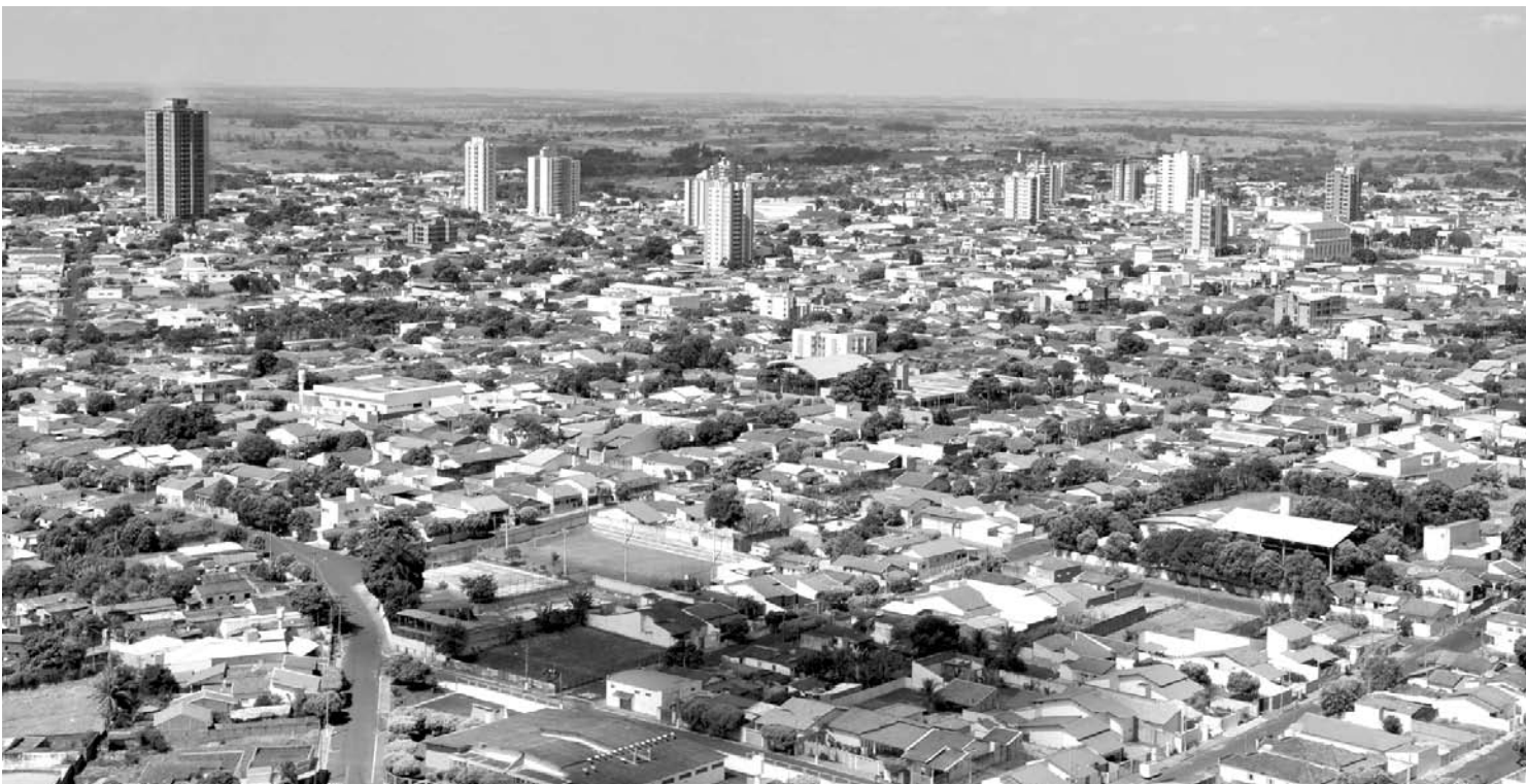
Fernandópolis receberá R$ 688 mil em 2015 e praticamente R$ 1,5 milhão em 2016

Em Jales o recurso do ano que vem será de R$ 556.740 e