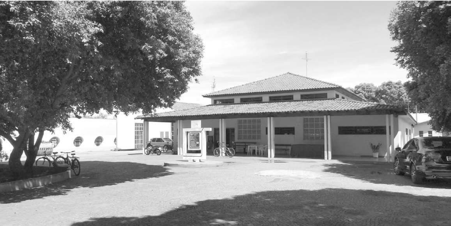
Fachada do CCI- Centro de Convivência de Idosos de Ouroeste