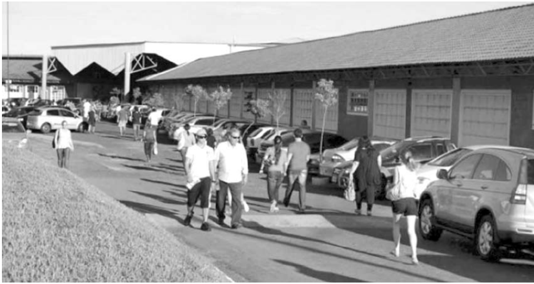
Unicastelo e Vunesp informaram a Seccional de Polícia sobre a suspeita de fraude no Vestibular

sitário, mas a nossa presença pode ter frustrado a ação de parte dos suspeitos. Nós abordamos dois irmãos, que ao final da prova do período da manhã, estavam com diversos celulares, portavam alguns aparelhos e outros foram encontrados no carro que utilizavam. Nenhuma mensagem com conteúdo sobre respostas de testes ou relacionada à prova foram encontradas, mas os aparelhos foram apreendidos e passarão por perícia pois encontramos alguns códigos, que podem estar relacionados ao gabarito. À tarde, abordamos mais um rapaz, ainda numa das salas onde a prova estava sendo aplicada. Ele portava, contra as orientações dos responsáveis pela avaliação, um celular, e acabou revelando que havia contratado um 'serviço' para sua aprovação no vestibular. O valor total pela vaga teria sido combinado em R$ 45 mil, sendo que havia pago adiantado R$ 10 mil", disse o delega-