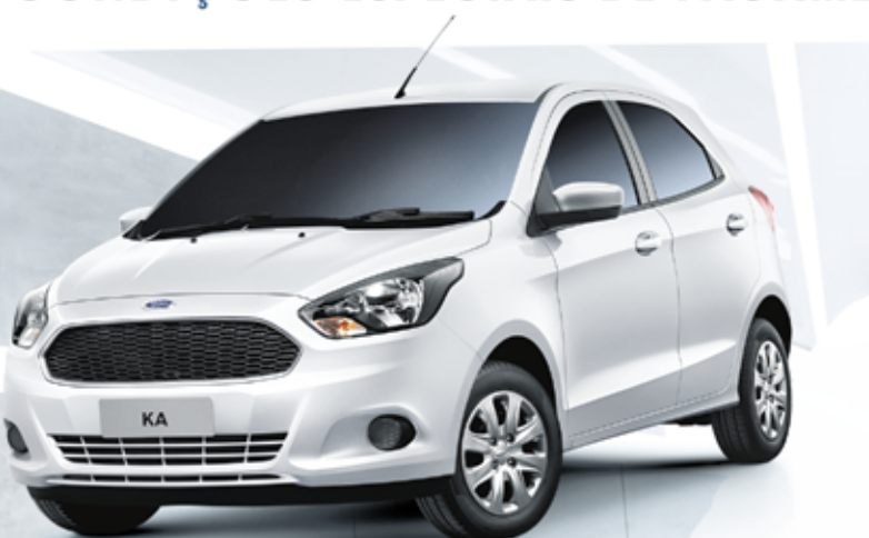
Novo Ka SE 1.0 2015 (cat. KCC5)

Ar-condicionado | Direção elétrica Motor 1.0 TIVCT (85cv) – o mais econômico* da categoria | Vidros elétricos dianteiros Travas elétricas com controle remoto My Connection com Bluetooth e My Ford Dock®