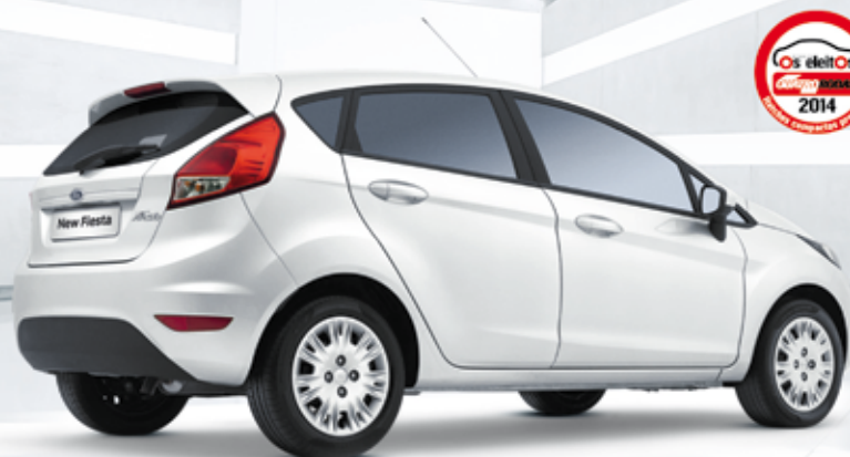
New Fiesta Hatch S 1.5 2015 (cat. RBB5)

Motor 1.5 Sigma 16V Direção elétrica | Airbag duplo Freios ABS com EBD | Ar-condicionado Vidros, travas e espelhos elétricos Rádio MY CONNECTION GEN 3