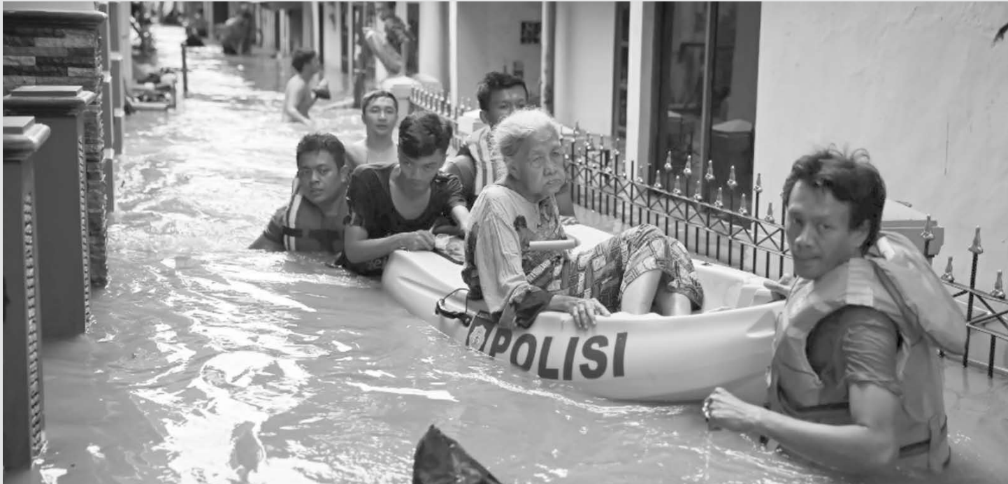
Voluntários utilizam um bote para transportar uma idosa para um local seguro, em Jacarta (Indonésia)