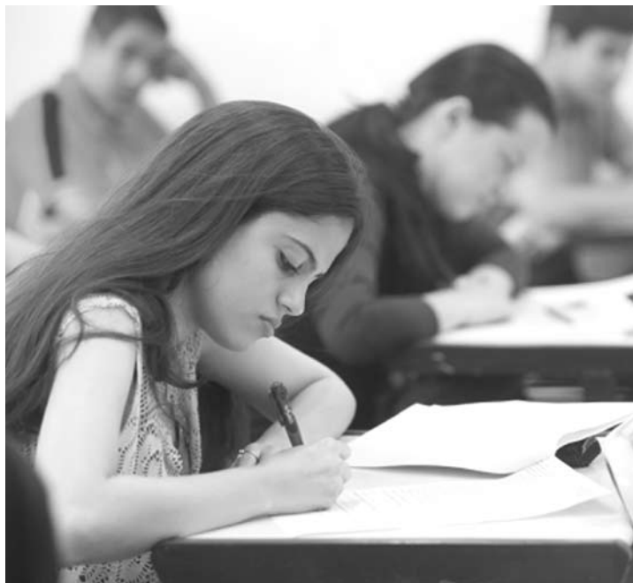
Alunos da rede estadual podem fazer os cursos que têm duração máxima de seis módulos semestrais

É importante que o aluno aprenda um segundo idioma e que é essencial para se destacar em uma melhor colocação no mercado de trabalho. Durante o período do 7º ano até o 3º ano do ensino médio, o aluno pode fazer os dois cursos, já que tem duração de três anos.