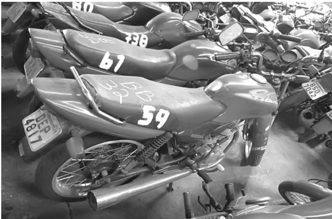
O leilão reúne 18 motos, com direito a documentação em dia

Para participar no leilão do DETRAN, basta comparecer no dia do evento. Qualquer pessoa pode participar, desde que seja penalmente imputável, que aceite as condições e normas do leilão, e que portem os documentos obrigatórios como RG e CPF. As pessoas jurídicas precisam de cópia autenticada do contrato social, cópia do CNPJ, comprovante de estabelecimento e procuração no caso de não ser o representante legal.