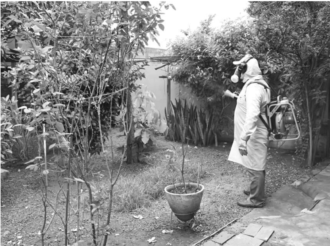
Conscientização da população é o foco: parcerias importantes foram firmadas nesta luta

seguinte frase: “Contra Dengue o Melhor Remédio é a sua Atitude”. Serão realizadas outras ações; divulgação com o carro de som nos bairros, divulgação por meio de rádios locais e distribuição de panfletos. “Considerando que a situação do município é de controle pelo baixo índice de casos positivos, com a chegada do período de chuvas o risco de transmissão da dengue aumenta. O objetivo da vigilância epidemiológica é reduzir os casos de den-