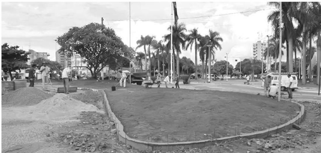
Foram retirados os canteiros frontais da Praça e serão feitos outros modernos com novo paisagismo

→ ASSESSORIA DE IMPRENSA Prefeitura de Fernandópolis A Prefeitura de Fernandópolis, através das Secretarias de Infraestrutura e Meio Ambiente estão a todo vapor trabalhando nas Praças Joaquim Antonio Pereira e da Matriz. Na Praça da Matriz foram retirados os canteiros frontais e no lugar serão feitos outros modernos com novo paisagismo com novo paisagismo com plantio de grama e plantas ornamentais.