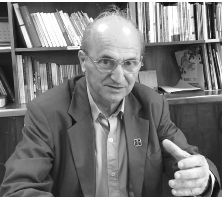
Dom Demétrio Valentini tem provocado uma série de questionamentos pastorais sobre a vida cristã e espiritualidade

sua renúncia num contexto mais amplo e mais livre. Não impondo uma data obrigatória de referência, de 75 anos. Poderia se deixar o espaço de cinco anos para que ao longo deles o Bispo faça pessoalmente o discernimento do momento adequado para a sua renúncia. Sempre lembrando que não é preciso esperar os 75 anos para renunciar. Pois dependendo das circunstâncias, o testemunho do bispo que renuncia publicamente pode ser muito mais eficaz e produzir inesperados frutos, que costumam brotar de ânimos generosos, como mostrou Bento XVI. Em todo o caso, a renúncia sempre deveria comportar a possibilidade de viver com intensidade o que Jesus afirmou: “Ninguém tira a minha vida, eu a dou livremente”.