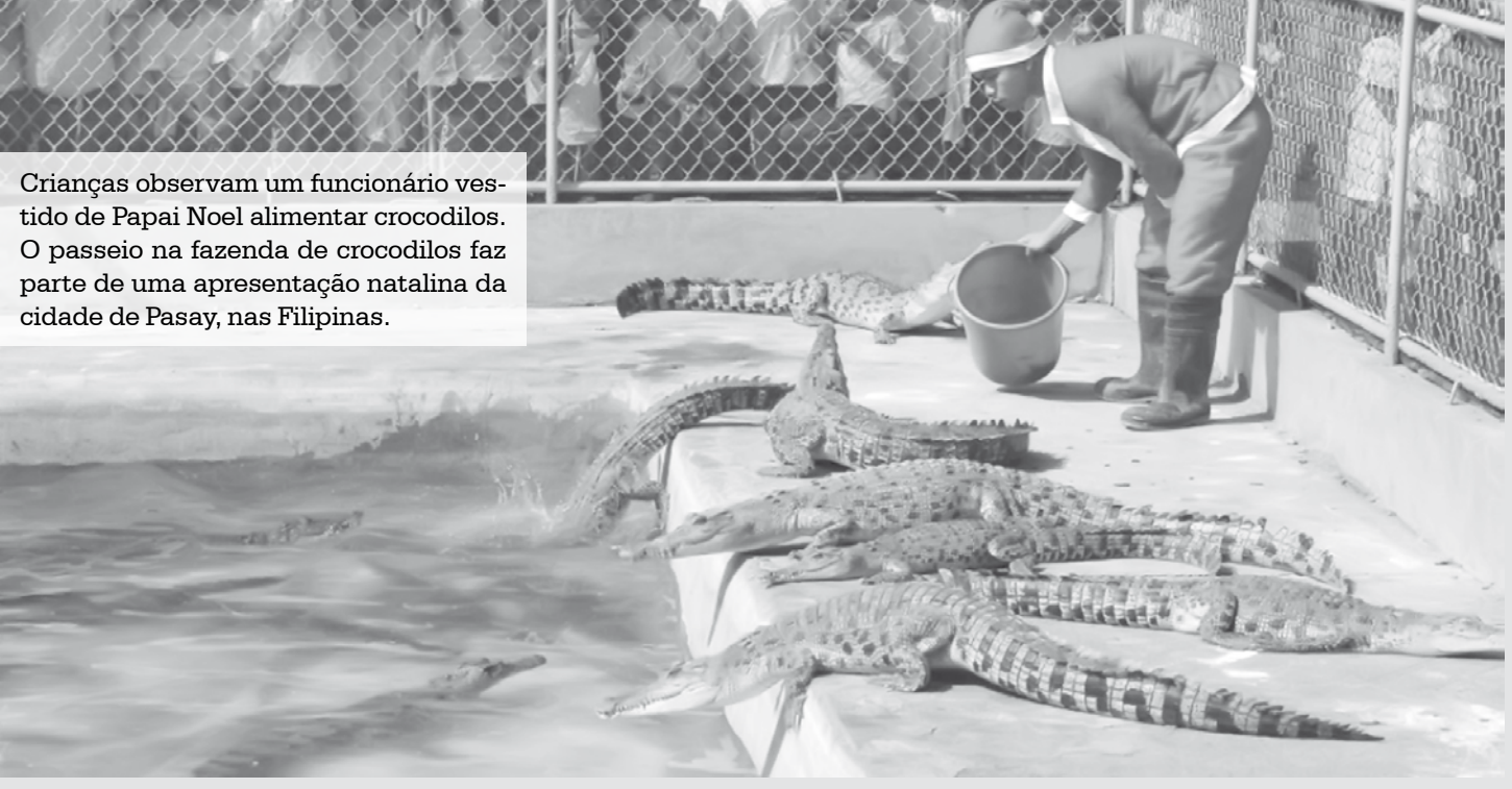
Crianças observam um funcionário vestido de Papai Noel alimentar crocodilos. O passeio na fazenda de crocodilos faz parte de uma apresentação natalina da cidade de Pasay, nas Filipinas.