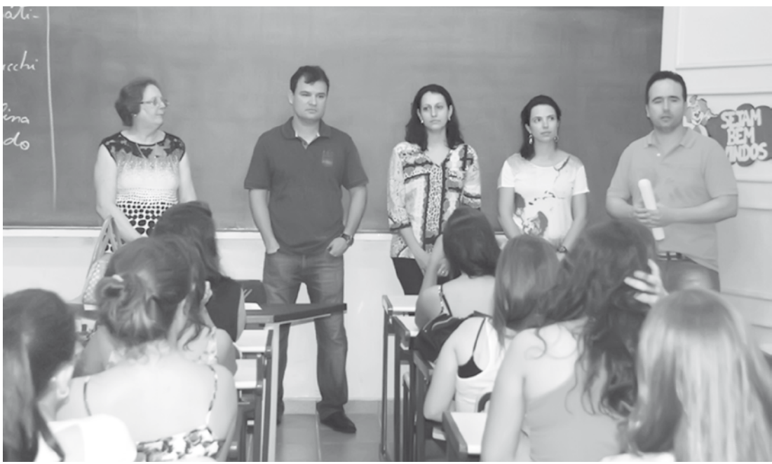
Professores orientam os alunos dos novos cursos do IFSP de Fernandópolis

Os cursos são gratuitos e cada turma tem em média 35 alunos