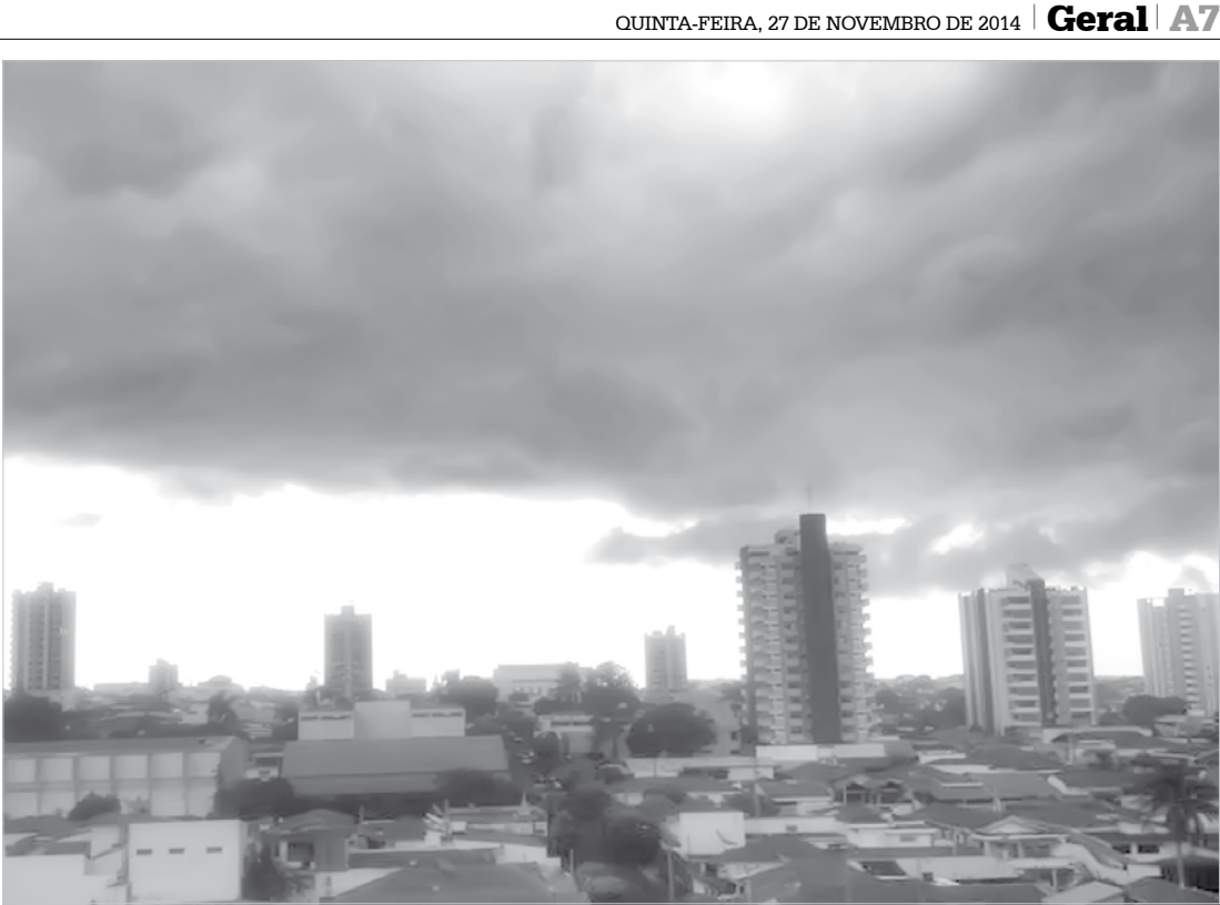
Segundo as medições pluviométricas mensais nos últimos 19 anos no Núcleo de Sementes, o mês de novembro em Fernandópolis registra média 128,48 ml de chuva

está relacionada à geografia das áreas e as chuvas localizadas, comuns nessa época do ano. Geralmente a quantidade de chuva medida é sempre maior na região Oeste da cidade, onde a precipitação é mais forte. AGRICULTURA A agricultura é um dos segmentos mais importantes da cadeia produtiva na região e é o que mais depende das condições do tempo. O ambiente, basicamente solo e clima, controla o crescimento e o desenvolvimento das plantas. Por isso, as condições ambientais devem ser adequadamente avaliadas antes de se implantar uma atividade agrícola. No mês de novembro a quantidade de água no solo na região está adequada para o crescimento das plantas, algo em torno de 60-70% de reservas hídricas.