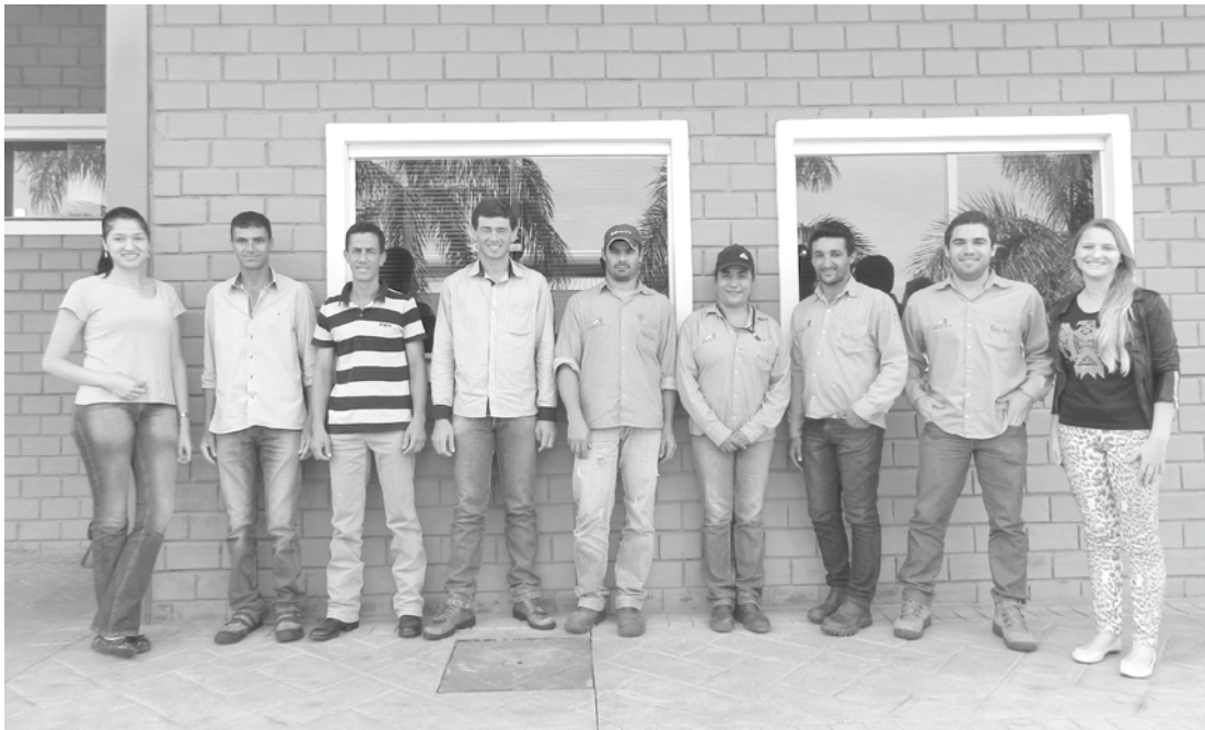
O treinamento de lideranças é constante na Alcoeste