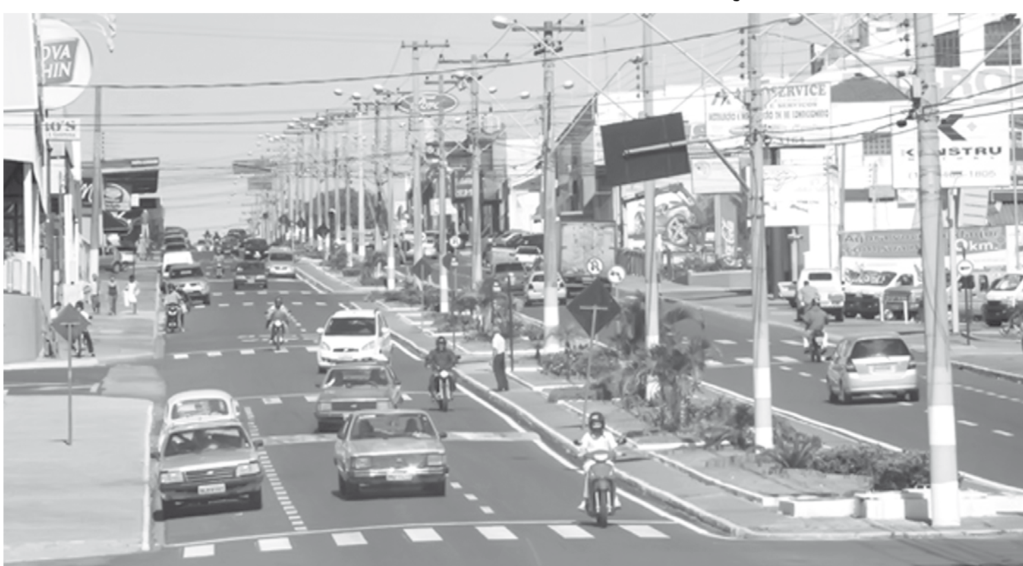
Objetivo é a atividade mista em horários específicos, quando boa parte da população vai ao trabalho ou deixa filhos na escola

De acordo com o novo comandante da policia mi-