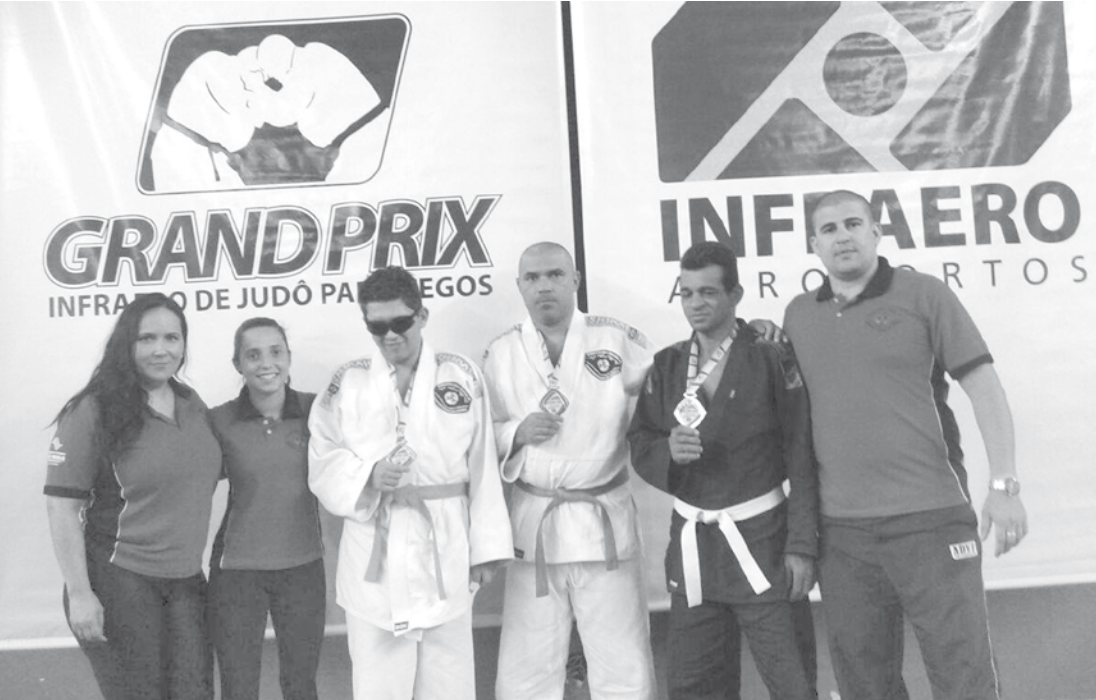
Judocas medalhistas e equipe da ADVF participantes do GP de judô para cegos

Fernandopolenses subiram no pódio e conquistaram medalhas