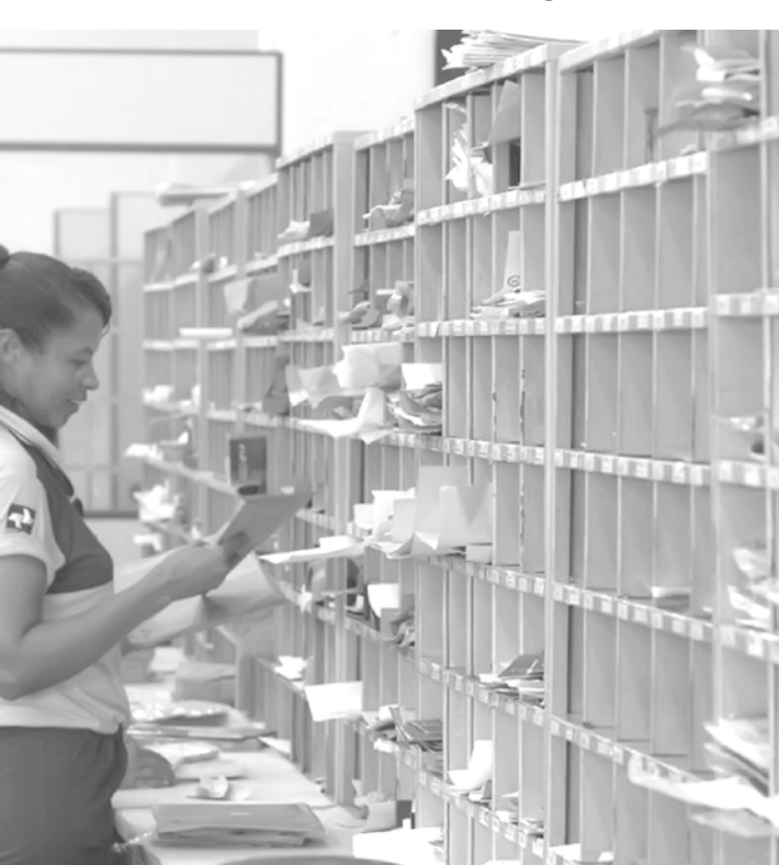
Nos próximos cinco anos os recursos vão totalizar R$ 80.220,00 para cada prefeitura

Cada convênio tem vigor até outubro de 2019 e tem por objetivo proporcionar atendimento à população de cada localidade