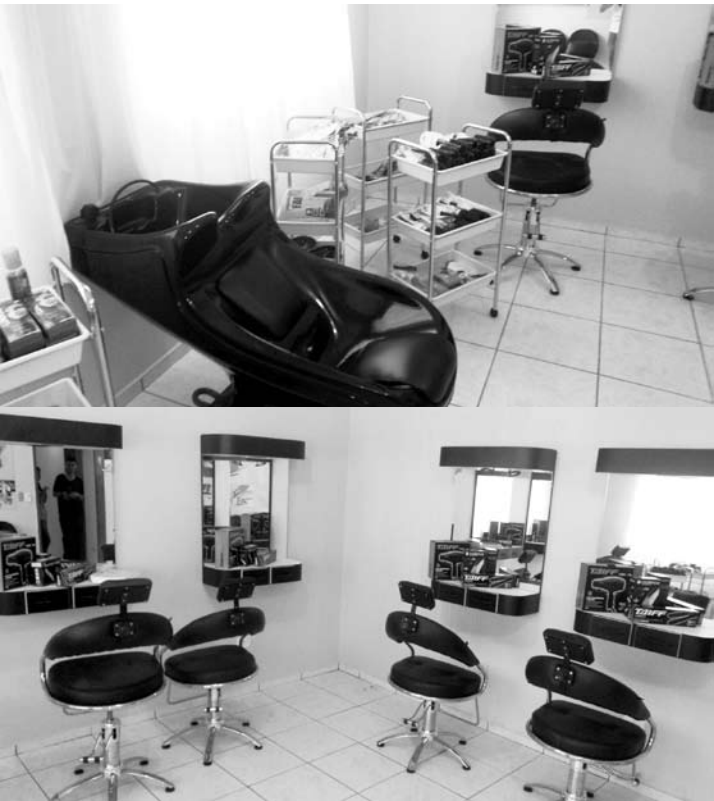
Sala do curso de cabeleireiro com equipamentos e espaço físico adequados para as aulas práticas

→ Da REDAÇÃO contato@oextra.net Foi inaugurada nesta segunda-feira (24), a Escola da Beleza, um projeto do Fundo Social de Solidariedade do município de Mira Estrela. Este projeto está