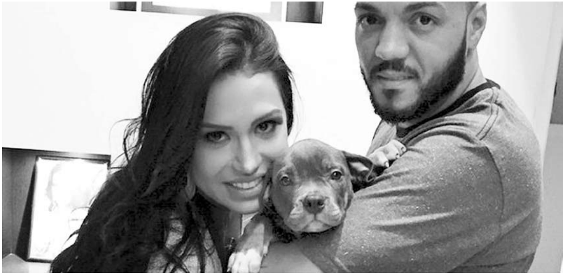
Após perder 20 quilos, cantor comemora a nova fase fitness: “me sinto mais bonito”

para o final do ano”. O pagodeiro, que ficou afastado dos palcos para o tratamento de estresse, já voltou aos shows e está lançando “Mistérios”, seu novo CD. Romântico que só ele, o cantor afirmou que os fãs não irão se decepcionar com o novo trabalho: “o amor sempre foi o que reinou nos meus discos. E nesse álbum eu abusei bastante, sem deixar minhas origens, mas mostrando também minhas outras referências para este público jovem”, adiantou.