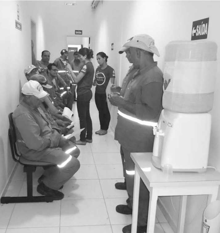
Cerca de 80 colaboradores fizeram a coleta de sangue para realização do exame de PSA