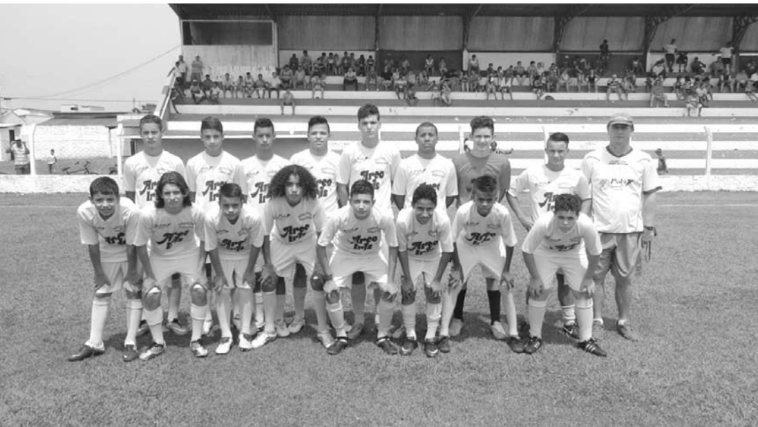
O FUTURO DA ÁGUIA: com “sangue novo” nos campos da cidade e região, jovens talentos conquistam títulos e experiência no futebol

→ ASSESSORIA DE IMPRENSA Prefeitura de Fernandópolis