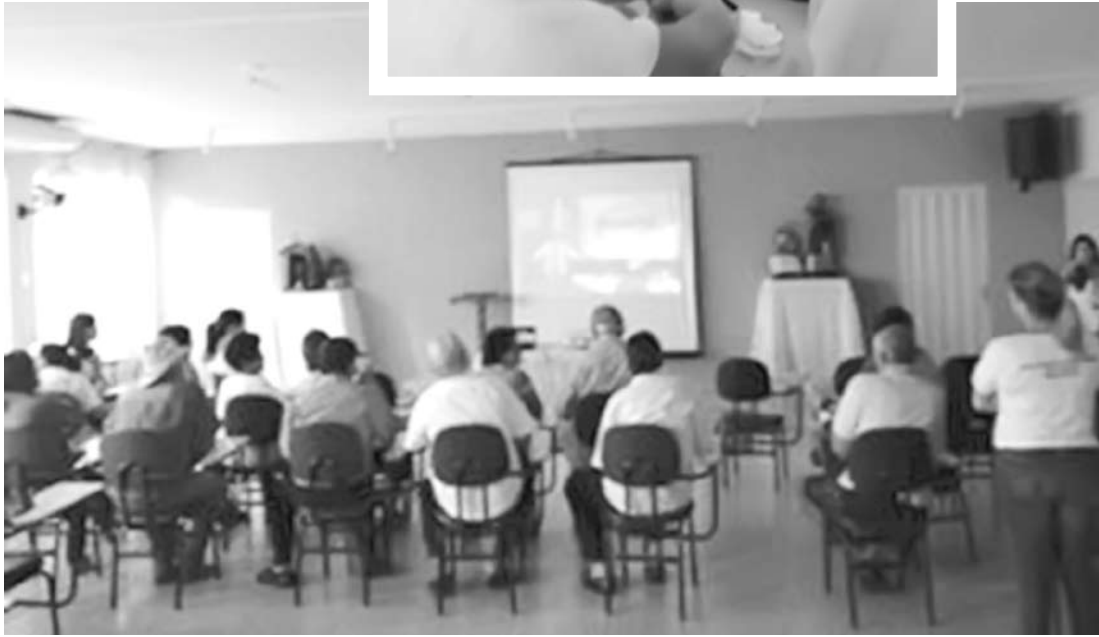
A palestra contou com uma equipe multiprofissional que orientou sobre a doença, atividades educativas e preventivas para combater a diabetes

Enfermeiras garantem que é de suma importância levar à comunidade ações que alertam e previnam tais doenças