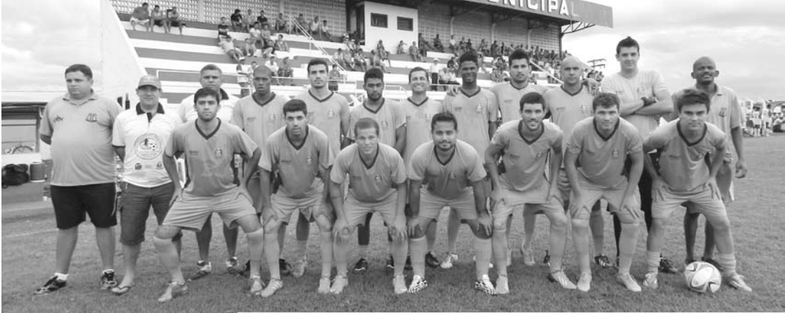
Acima, os jogadores que integram o Clube Esportivo de Ouroeste; à direita, atletas da categoria de base do Macedônia, que entram em campo hoje

Hoje, logo mais às 8h, no Estádio “Manoel Dias da Silva”, as categorias de base das cidades de