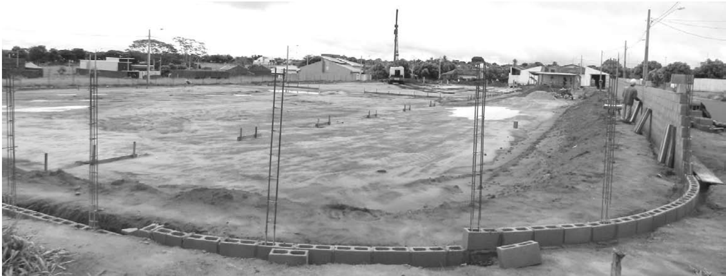
Construção da nova unidade escolar já está em andamento na cidade de Ouroeste