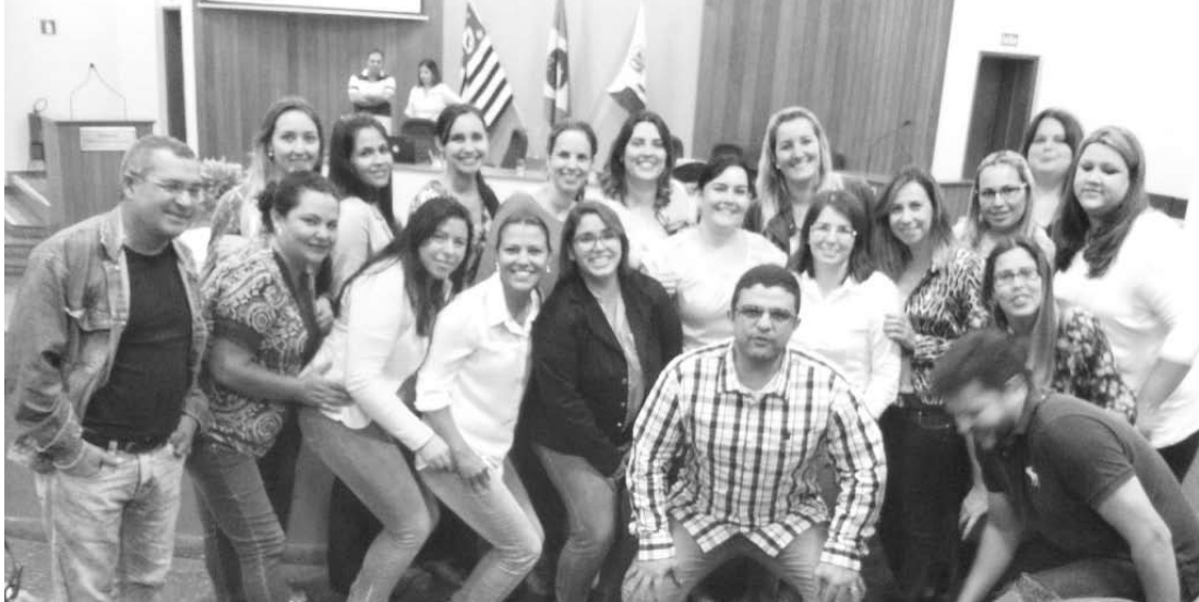
Equipe do Centro de Controle de Zoonoses de Fernandópolis no Seminário Regional de Leishmaniose Visceral Americana

O encontro reuniu cerca de 150 profissionais de Saúde das Secretarias municipais e Estadual de Saúde, Sucen, Instituto Pasteur do Estado de São Paulo e Instituto Adol-