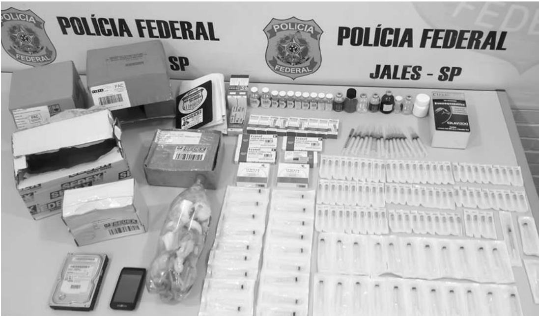
A Polícia Federal intensifica investigações e novas prisões podem ocorrer nas próximas semanas

VR.D.J. foi autuado em flagrante delito no crime do artigo 273 do Código Penal. Se condenado, estará sujeito a uma pena de 10 a 15 anos de reclusão. O preso será encaminhado à Cadeia Pública de Jales e permanecerá à disposição da Justiça Estadual de Urânia.