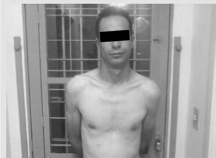
Homem detido em Ouroeste tem diversas passagens criminais