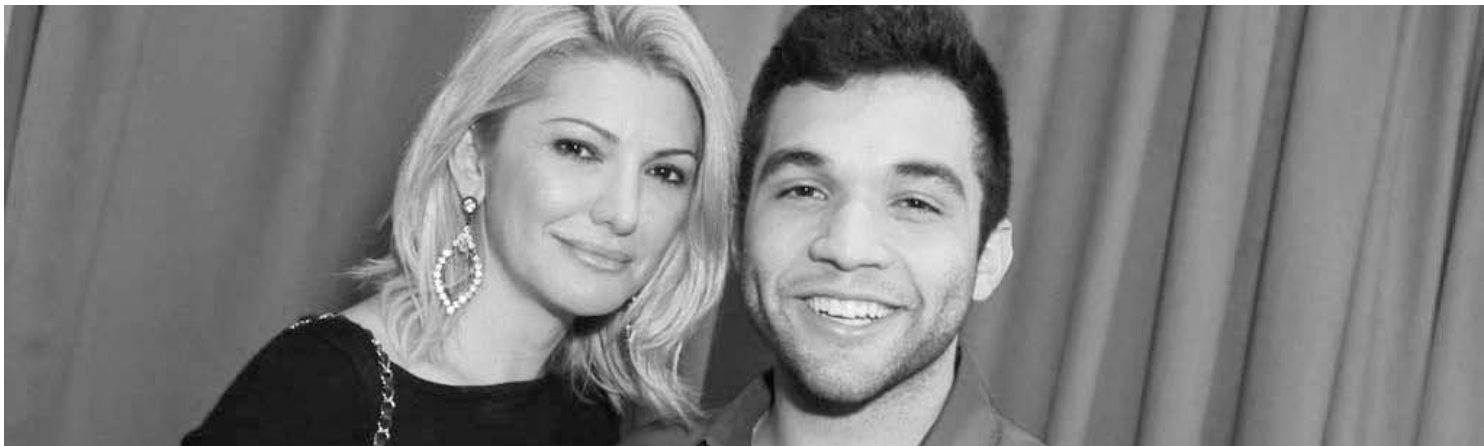
O ex-funkeiro não apenas admitiu a relação, como é todo elogios para a namorada

Juju é famosa por seu perfil trincado, conquistado através de muitas horas de treino diário e alimentação mais do que regrada. E ela ainda vai aumentar tudo isso pelos próximos três meses. Ela diz que o bonito para ela são seus músculos definidos, veias saltadas e gordura corporal beirando o zero: “O padrão de beleza para as revistas, para o mundo da moda e para muitas mulheres é o padrão de mulher magra, pois dizem ser mais elegante. Eu acho que toda mulher tem sua beleza, independentemente do corpo, e todas podem ser sensuais e elegantes SIM! Passo boa parte do ano bem mais magra, menos musculosa e mais fina, já que preciso muitas vezes me encaixar em certos padrões. Mas quer saber? Eu gosto mesmo é de estar forte, amo músculos, amo meu estilo de vida e é assim que sou feliz, sendo bonito ou não para muitas pessoas! Que venha o carnaval e vamos botar os músculos pra sambar”.