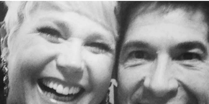
Sertanejo continua causando com a sua biografia e, depois de falar de Eliana e de Tiazinha, ele parte para a Rainha dos Baixinhos