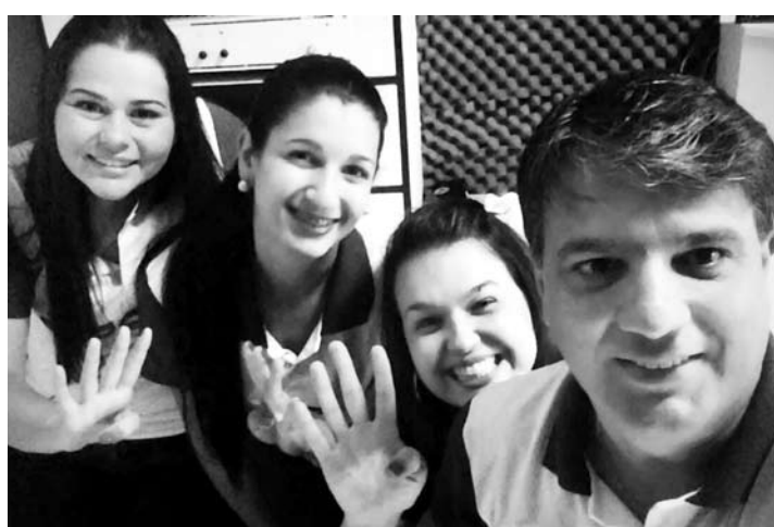
Destaque para a selfie da galera Arena FM comemorando quatro anos da rádio sertaneja em Fernandópolis. Sucesso!