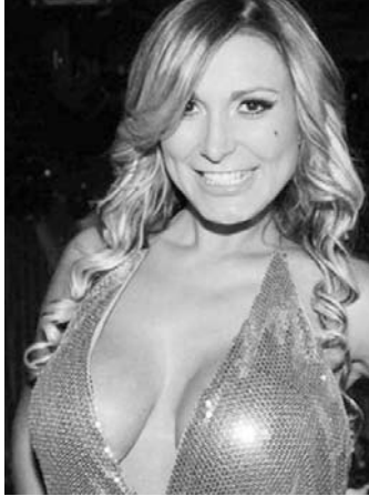
Assessor de imprensa do hospital confirmou que o estado de saúde da vice-Miss Bumbum é grave

A morena disse que está sem notícias claras sobre o que está acontecendo com a amiga. “Não posso passar nenhuma informação sobre o que está rolando, porque não