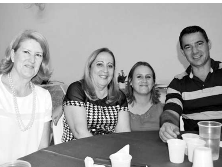
Clima de confraternização de final de ano e o setor da Saúde saiu na frente com a festa do pessoal da UBS do Por do Sol, com direito a presenças ilustres.