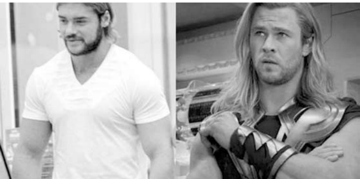
Com 100 kg de puro músculo, filho de Eike Batista e Luma de Oliveira tenta fazer jus ao nome