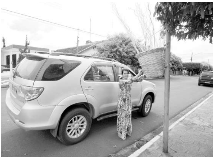
Enfeites feitos de material reciclável serão colocados nas Praças de Pedranópolis e nas Praças dos Distritos de Santa Izabel e Dulcelina