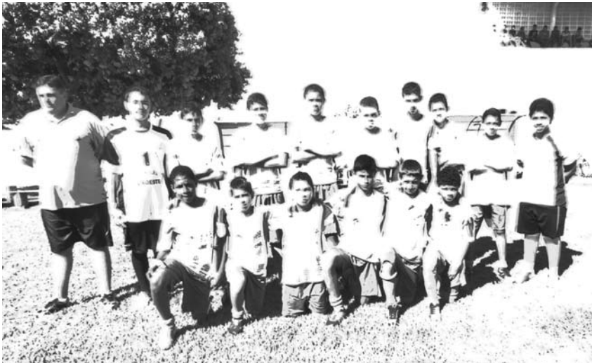
Categoria de base da cidade de Ouroeste que disputa três finais hoje

nia e Iturama. A partir das 17h, Ouroeste enfrenta o time da Brasilândia, de Fernandópolis.