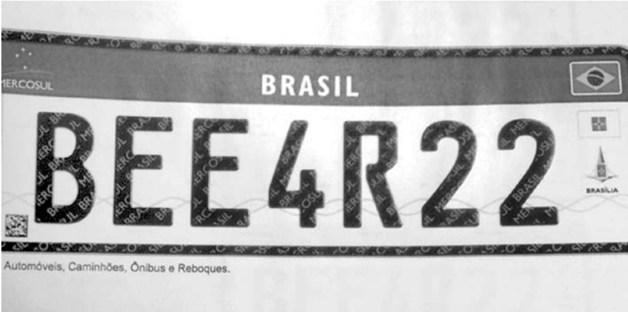
Novo modelo de placas de automóvel, no padrão do Mercosul, vai ser aplicado no Brasil a partir de 2016; a placa acima será usada em carros

O Departamento Nacional de Trânsito (Denatran) apresentou nesta quinta-feira (4) o novo modelo de placas de veículos que será usado no Brasil e demais países do Mercosul, Argentina, Uruguai, Paraguai e Venezuela (veja as imagens ao lado). No Brasil, a placa será obrigatória para veículos novos a partir de janeiro de 2016. Para os veículos que atualmente já estão emplacados, a mudança será opcional. O novo modelo adotará quatro letras e três números, diferente da placa atual, que apresenta três letras e quatro