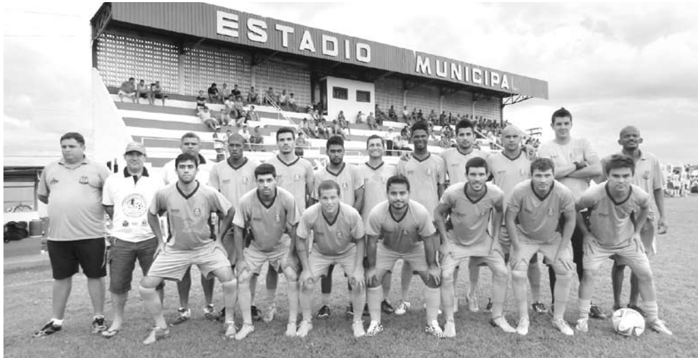
Jogadores que integram o Clube Esportivo de Ouroeste

→ Da REDAÇÃO contato@oextra.net Três das quatro categorias de base do Clube Esportivo de Ouroeste estão na grande final do 2º Campeonato Regional de Futebol Amador e Categorias de Base, que acontece hoje, dia 6, no Estádio Manoel Dias da Silva, em Ouroeste. De acordo com a organização do campeonato, os jogos acontecem a partir das 8 horas. Confira a programação. Na categoria Sub-09, Ouroeste x Cardoso. Na categoria Sub-11, Estrela d'Oeste x Cardoso. Na categoria Sub-13, Ouroeste x Cardoso. E na