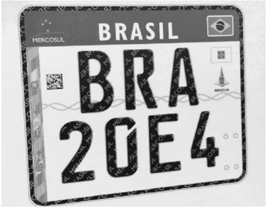
No lado direito da placa, ficarão as bandeiras do Brasil, do estado e do município de registro do veículo; a placa acima será usada em motocicletas

números. A distribuição entre letras e números na nova placa será aleatória. Com isso, segundo o Denatran, serão possíveis mais de 450 milhões de combinações diferentes, contra as pouco mais