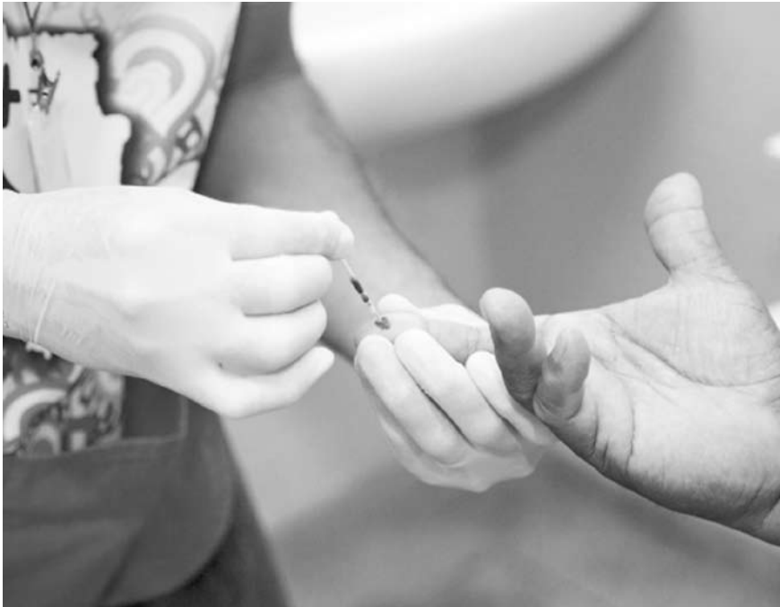
O teste é seguro, confiável, rápido e sigiloso