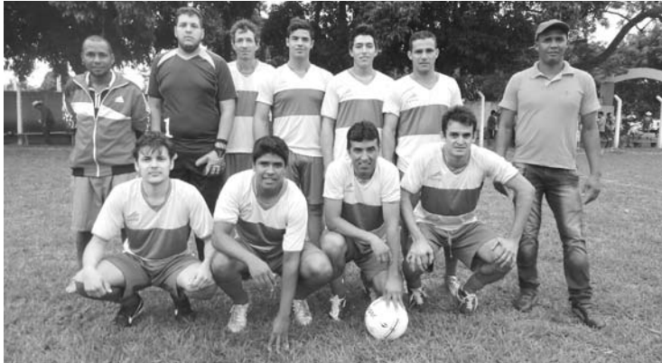
Torneio contou com equipes da região, fortalecendo o Futebol Society em Guarani d'Oeste