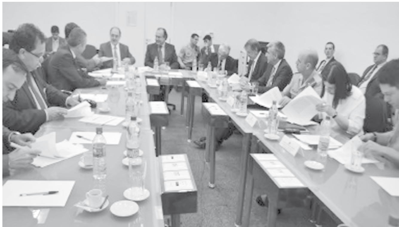
Reunião para assinatura do novo edital que prorroga por mais 5 anos as ações da AICC

Dentre as recentes conquistas no Brasil destaca-se a Lei Antifumo, decreto da presidenta Dilma Rousseff que entrou em vigor esse mês. A nova legislação torna os ambientes fechados de uso coletivo 100% livres de tabaco, protegendo a população do fumo passivo e contribuindo para diminuição do tabagismo entre os brasileiros. As mudanças da legislação brasileira nos últimos anos impactaram positivamente no hábito de fumar e grande parte dos fumantes pensaram em parar de fumar devido a estas advertências, no entanto ainda há muito a se conquistar, pois a meta do governo é que, até 2022, o país chegue a 9%. Ainda é preciso que haja uma redução de 5,7% em relação aos dias de hoje, meta que possivelmente deverá ser alcançada se houver um trabalho conjunto de conscientização.