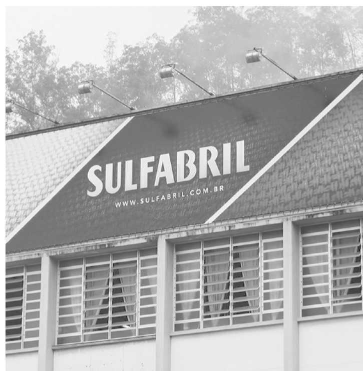
Fachada da Sulfabril em Blumenau/SC

Os lotes serão oferecidos separadamente e, para facilitar a venda, a Justiça determinou lance mínimo de 80% do valor de avaliação dos bens. A crise da Sulfabril teve início em meados da década de 1990, com a abertura do Brasil ao mercado internacional. Em seu auge, nos anos 1970 e 1980, a companhia empregava mais de 5 mil funcionários. Suas coleções eram anunciadas no horário nobre da televisão e nas principais revistas do país, com garotas-propaganda como Regina Duarte e Sandra Bréa.