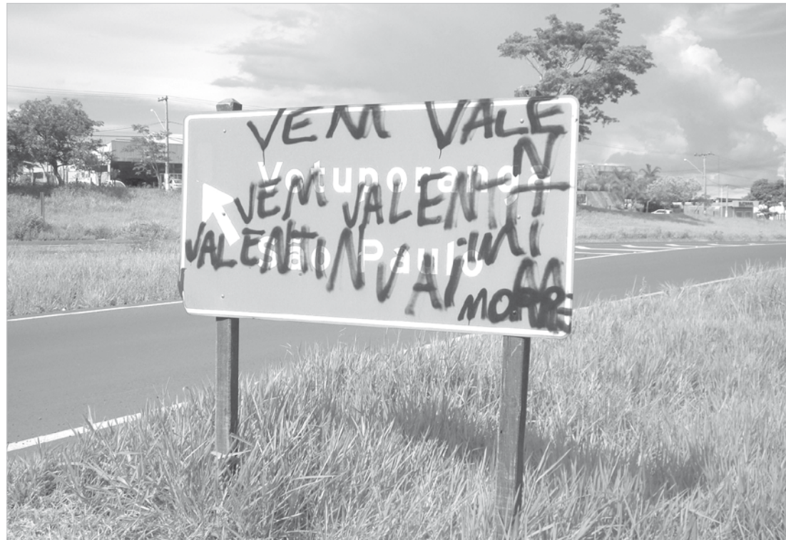
O vandalismo também já atingiu placa na saída de Fernandópolis para a Capital