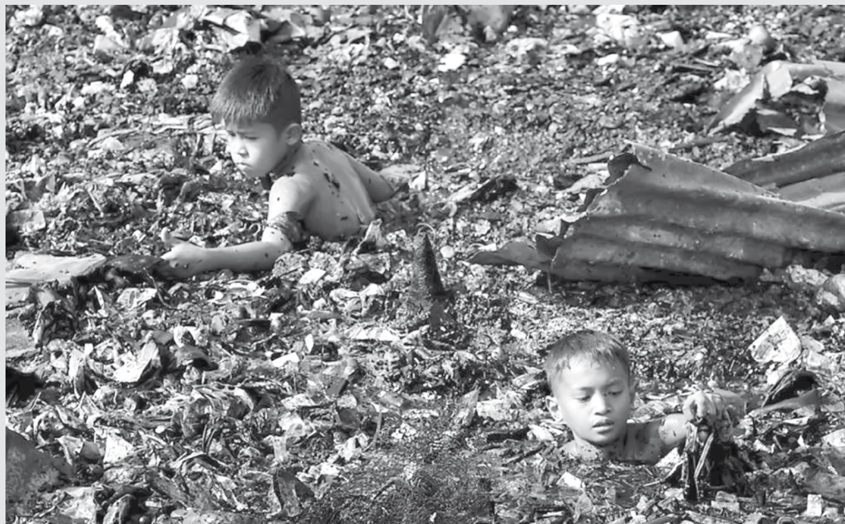
imagem do dia

Em meio à lama e escombros, crianças buscam objetos após incêndio em assentamento na cidade de Anilã, nas Filipinas; mais de 200 casas foram atingidas deixando mais de mil pessoas desabrigadas.