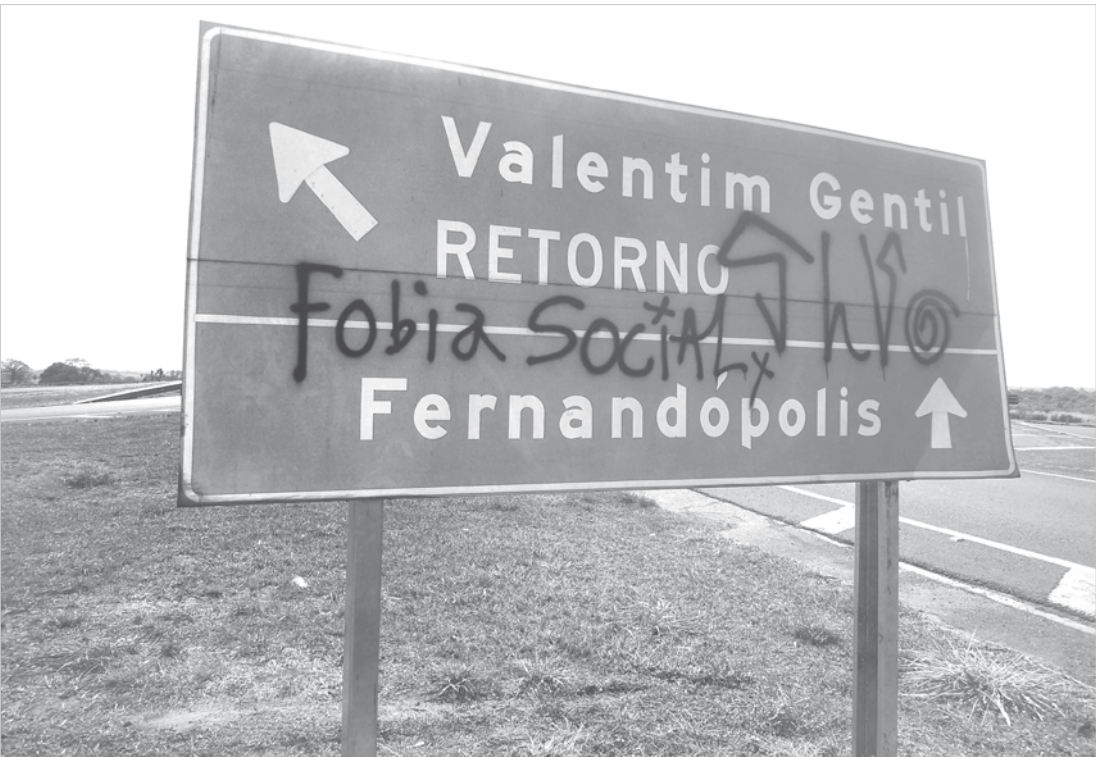
Placa de sinalização no trevo de Valentim Gentil contendo pichação