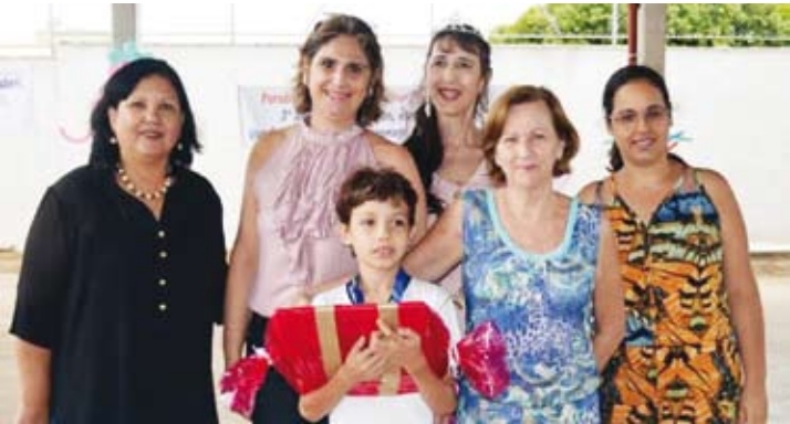
Aluno premiado e equipe de educadores da Ivonete