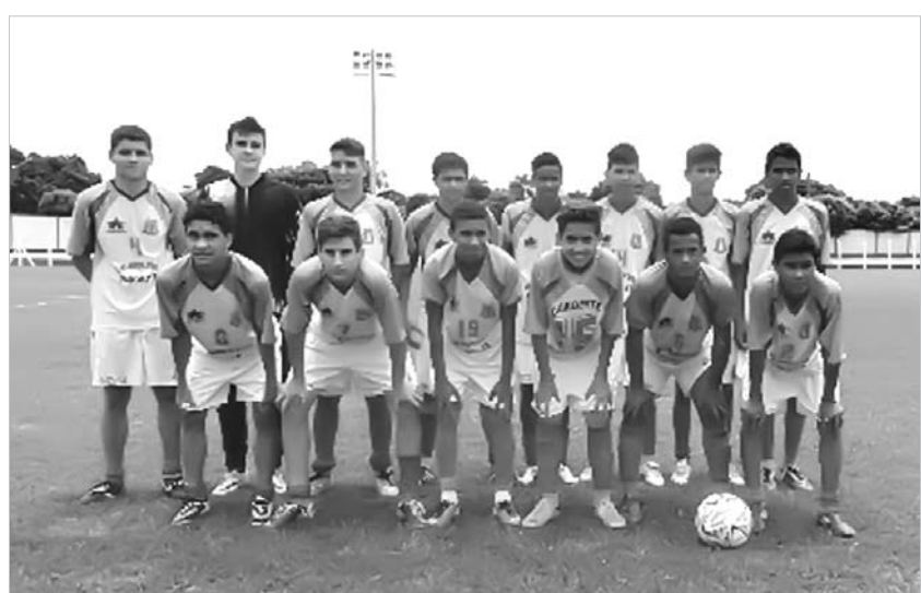
Jogadores da categoria de base Sub-15 de Ouroeste, que conquistaram o campeonato