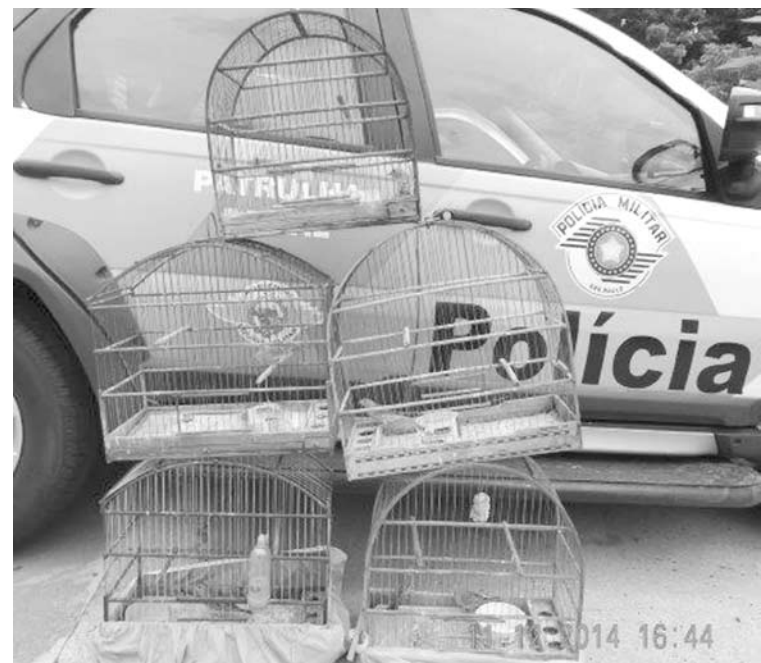
Registros das apreensões realizadas pela Polícia Ambiental durante a "Operação Revoada", desencadeada em toda a região

zação do órgão ambiental e está condicionada ao cadastro do criador e do respectivo plantel, cadastro este que deve ser atualizado sempre que houver alteração das informações registradas, como fuga, morte ou transações das aves do plantel", salienta o Comandante Machado. Vale ressaltar que as aves devem ser mantidas bem cuidadas, em ambientes limpos, providos de água limpa e fresca, à sombra, alimentadas, e com anilhas expedidas pelo órgão ambiental competente que as identifiquem, dentre ou-