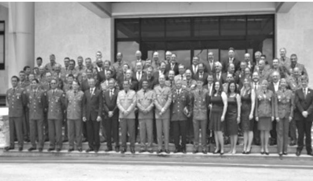
Formaram-se 30 delegados e 43 oficiais da Polícia Militar, sendo 10 deles de outros Estados

ram promovidas linhas de pesquisa com produção de artigos científicos e teses, que permitem propostas práticas para a área de segurança pública. “Sonhem com uma polícia cada vez melhor, uma instituição cada vez mais coesa, uma sociedade cada vez mais justa e tenham sempre esperança de conquistarem esse sonho”, disse o delegado-geral e patrono das turmas. “Coloquem todo esse conhecimento e aptidão a serviço da população, a quem servimos, e a nossa sociedade será melhor”. Para ingressar no CSPI, os delegados precisam ser de 1ª classe e os policiais militares estarem há pelo menos seis meses no posto de major. Entre os PMs, 10 são dos estados do Amapá, Roraima, Amazonas, Paraíba e Espírito Santo. Desde 2007, foram formados no curso 506 policiais - 326 oficiais da PM e 180 delegados da Polícia Civil.