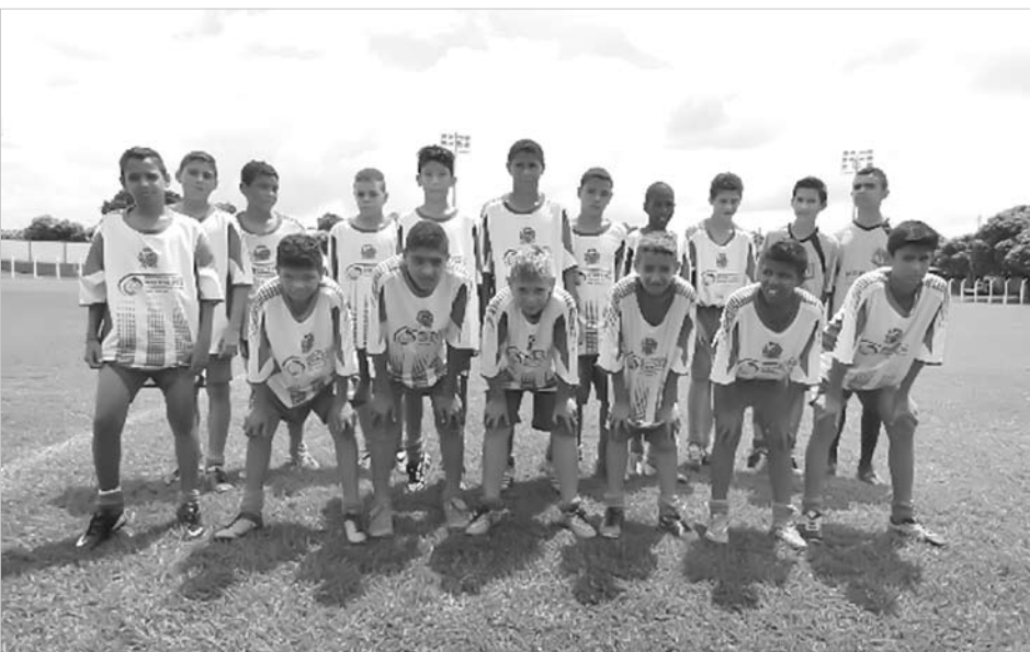
Jogadores campeões da categoria de base Sub-13: bons de bola