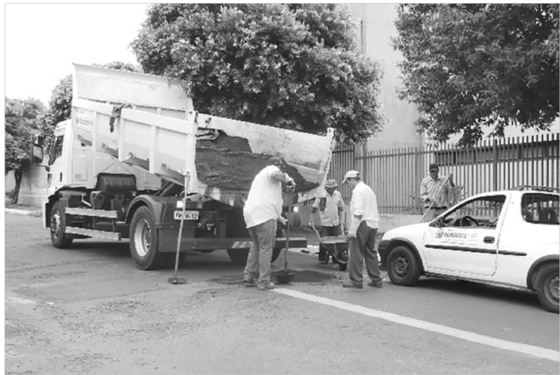
A Prefeitura disponibilizou servidores municipais e todo o material para a execução das obras