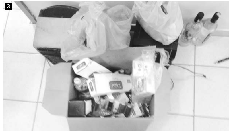
Os adolescentes infratores confessaram o furto de diversos aparelhos eletrônicos: computadores, máquinas fotográficas digitais, aparelho de som, celulares, notebook, caixas de som e pen drive foram apreendidos; dupla furtou também vários alimentos e produtos do comércio