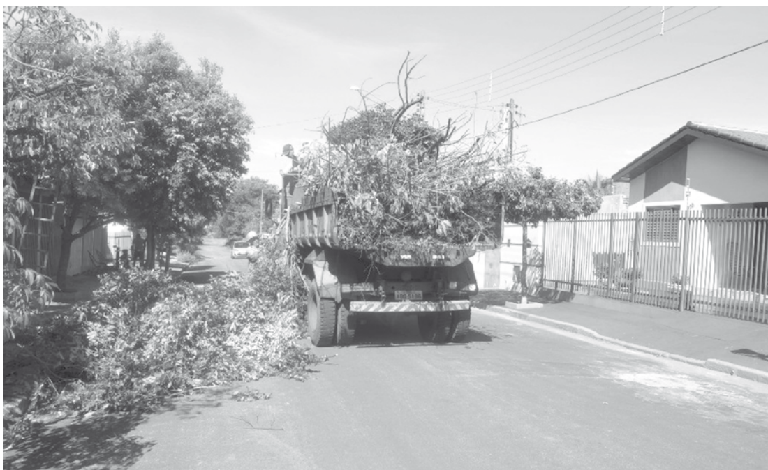
Serviços sendo executados pela Prefeitura em Brasitânia