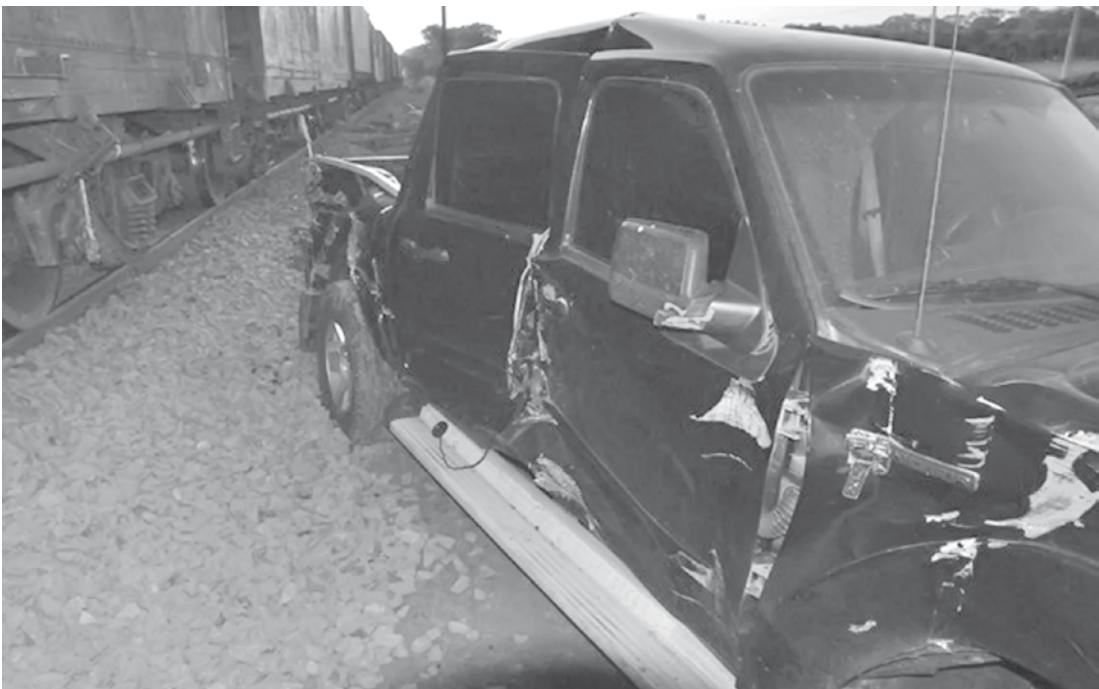
Caminhonete ficou com uma das laterais danificada após a colisão.

No veículo em questão estavam um casal e uma jovem. Os ocupantes não sofreram nenhum tipo de ferimento. Com a batida, o