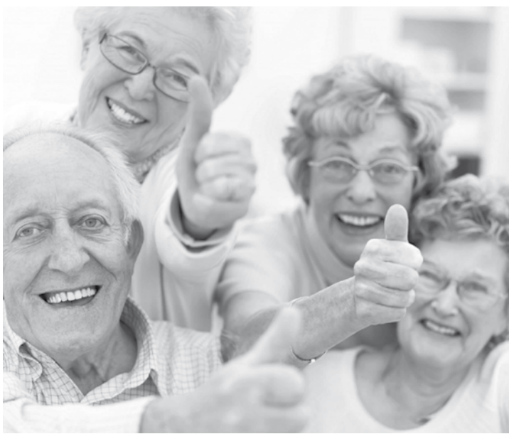
Aposentados e pensionistas não podem perder prazo de regularização

A tecnologia para fazer a identificação pode ser biométrica. O segurado ou pensionista deve levar um documento de identificação com foto e de fé pública, como a carteira de identidade, carteira de trabalho, Carteira Nacional de Habilitação (CNH), entre outros. Caso esteja impedido de ir à agência bancária, o beneficiário deve fazer a prova de vida por meio de um procurador devidamente cadastrado no INSS.