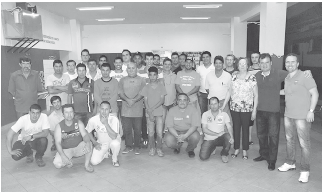
Formandos da primeira turma do Campus Fernandópolis

O Instituto Federal de São Paulo Campus Avançado Fernandópolis realiza hoje, dia 17, às 20h, a formatura da 1ª turma do curso Segurança em Instalações de Serviços em Eletricidade. Esta também é a primeira turma formada pelo Campus Fernandópolis. O curso teve início em outubro, abrindo os trabalhos do Instituto no município e outros dois estão em andamento, o de Extensão “Ciências da Natureza, Matemática e suas Tecnologias aplicadas ao ENEM e Vestibulares I” e o de Informática Básica e suas apli-