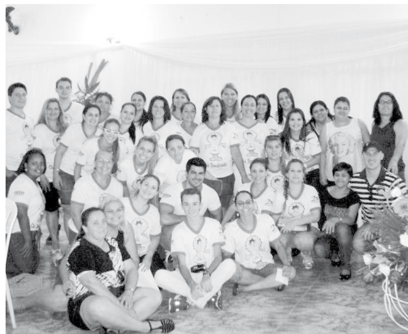
Equipe de funcionários e colaboradores durante evento promovido pela APAE

As ações de atendimento, orientação e encaminhamento psicológico e social são de suma importância, visto que a vida da família dos usuários não é regida apenas pela pressão dos fatores socioeconômicos e necessidade de sobrevivência; elas precisam ser compreendidas em seu contexto cultural, inclusive ao se tratar da análise das origens e dos resultados de sua situação de risco e de suas dificuldades de auto-organização e de participação social.