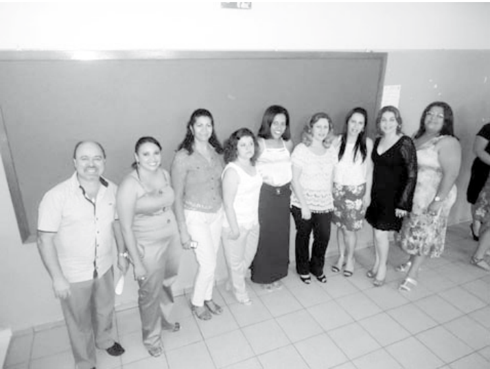
Professores nas dependências da escola durante a formatura