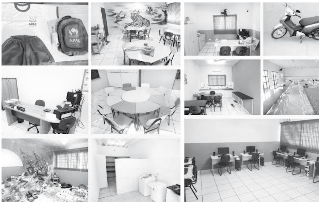
Com ampla e moderna estrutura, entidade oferece diversas atividades em prol dos alunos

Como qualquer um de nós, a pessoa com deficiência intelectual percebe tudo que se passa ao seu redor. Portanto, devem ser criadas oportunidades para que ela possa realizar todas as atividades que achar interessantes e auxiliá-la no que for possível. Fundada no município há 43 anos, a APAE de Fernandópolis tem por missão promover e articular ações de defesa de direitos, prevenção, orienta-