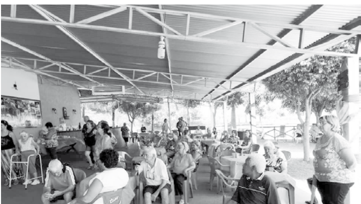
Idosos do Parque recebem diversas visitas e participam de eventos festivos

não cansamos de agradecer aos vicentinos voluntários que doam um pouco de seu tempo e as pessoas que colaboram ativamente conosco em cada novo