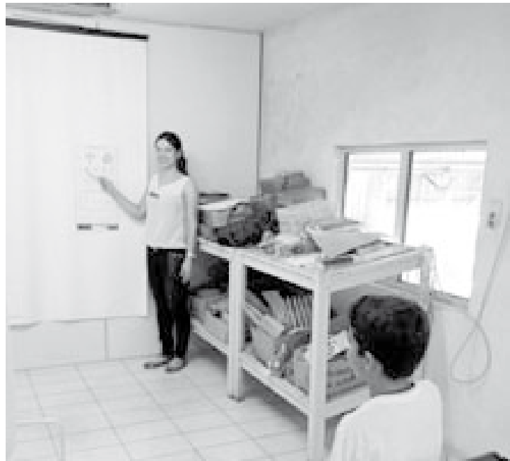
A iniciativa visa contribuir para o fortalecimento de ações que articulem Saúde e Educação, para o enfrentamento das vulnerabilidades que comprometem o desenvolvimento de crianças e adolescentes