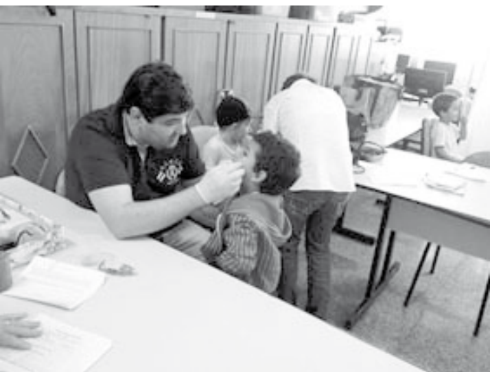
Profissional realizando avaliação odontológica nos alunos