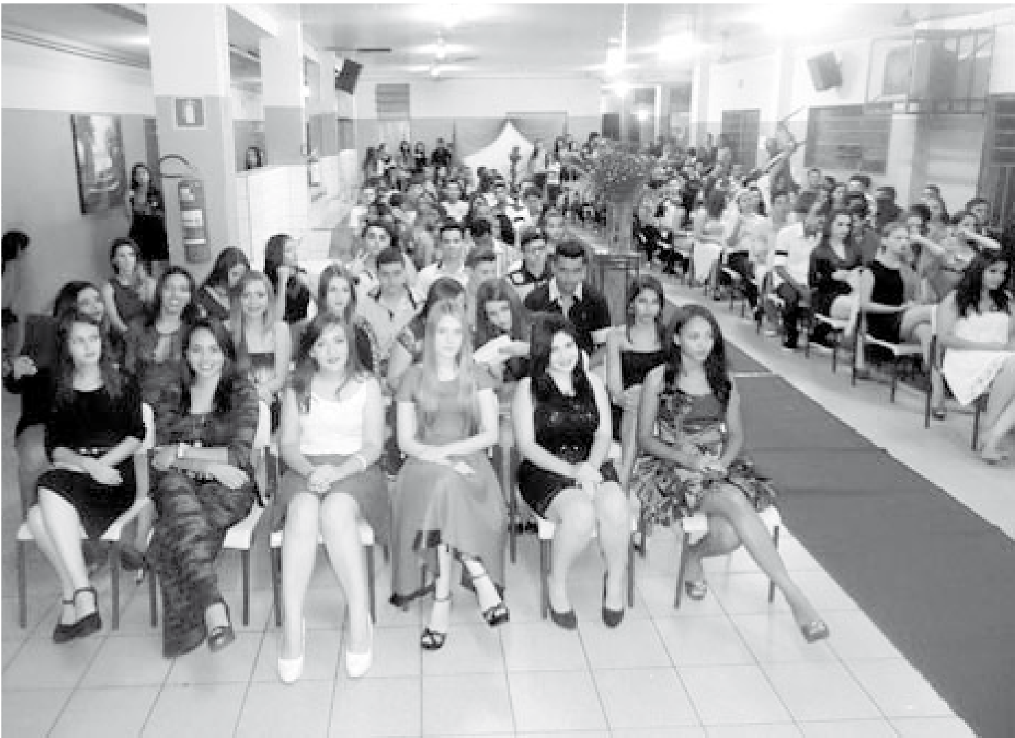
A cerimônia de formatura contou com a participação de 120 formandos

abrilhantaram o evento. Em sua fala, a diretora parabenizou a turma e ressaltou a importância deste momento na vida dos jovens, enfatizando a necessidade no prosseguimento dos estudos. Várias homenagens foram prestadas aos professores, bem como aos paraninfos das turmas. A escola parabeniza a todos os formandos e seus familiares, agradecendo por terem acreditado no trabalho da Instituição de Ensino.