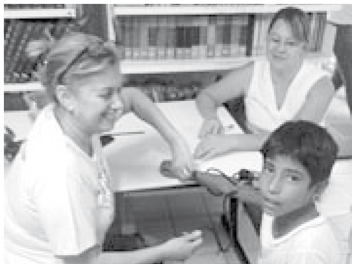
Entre as avaliações clínicas, foi realizada a aferição da pressão arterial dos alunos