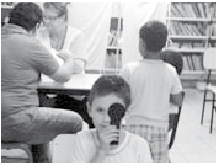
Foram realizadas avaliações para detectar as dificuldades visuais