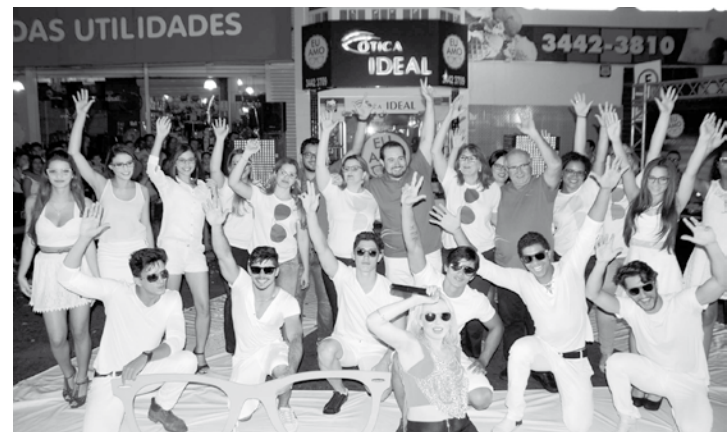
Registro de alguns momentos do desfile realizado nas ruas de Fernandópolis