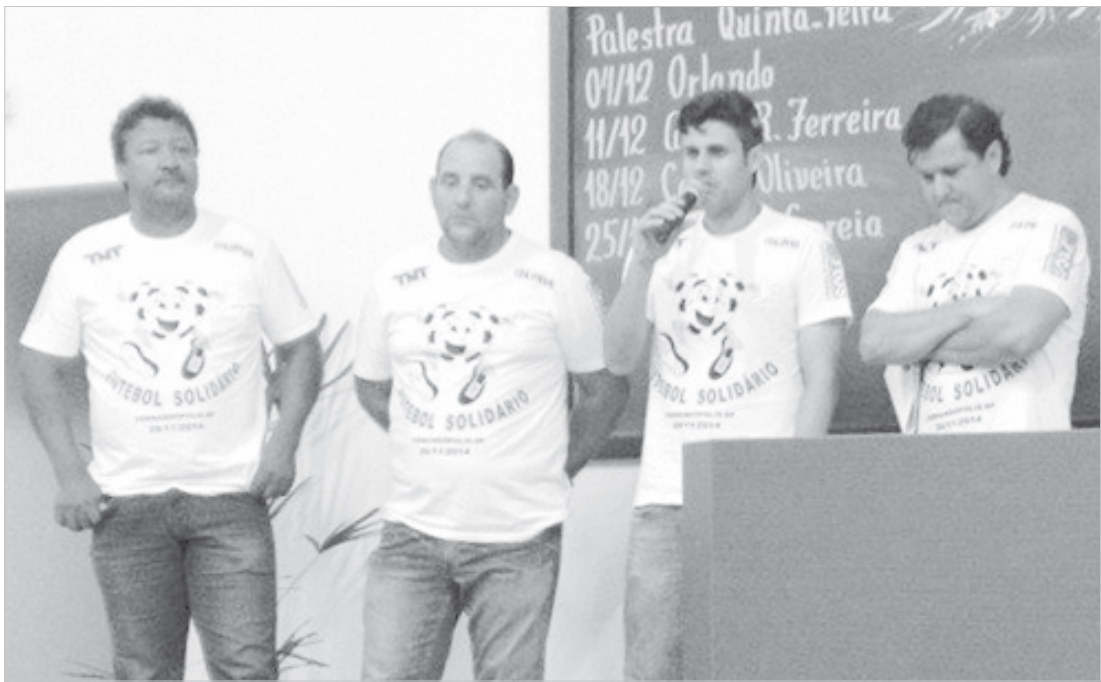
Momento do anúncio do valor arrecadado pelo Futebol Solidário, destinado ao “Girassol”