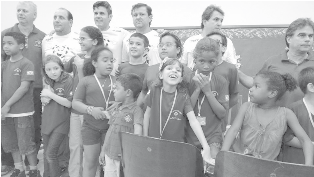
Organizadores do Futebol Solidário com as crianças atendidas pelo Projeto

O Núcleo é a única entidade social na região periférica do município de Fernandópolis, que abrange os seguintes bairros: Parque Paulistano, Jardim Redentor, Pôr-do-Sol, Jardim Rosa Amarela, Jardim Ipanema, Cohab Antônio Brandini e São Lucas.