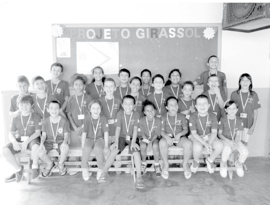
Parte dos alunos atendidos no Projeto Girassol