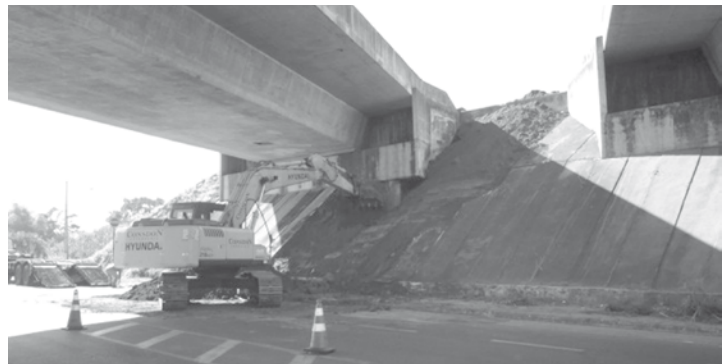
Pontilhão teve que passar por obras de reparo após alerta ao DER