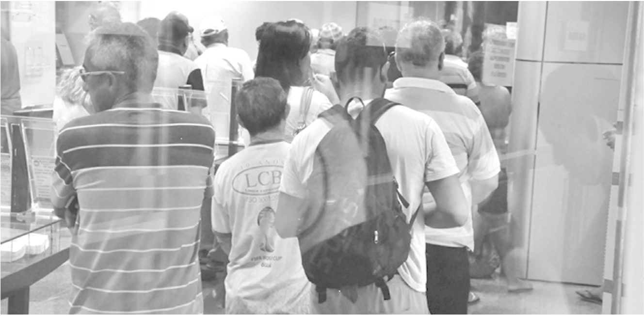
Último dia de atendimento no ano foi de intensa movimentação nas agências bancárias de Fernandópolis

Apenas os serviços de autoatendimento funcionarão neste período de festas