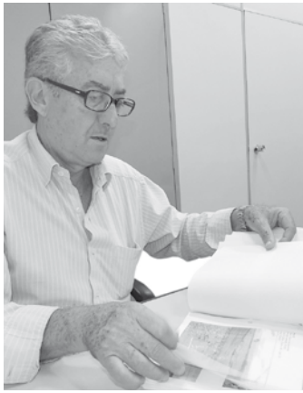
Venda de imóveis públicos pode render mais de R$ 20 milhões à Prefeitura