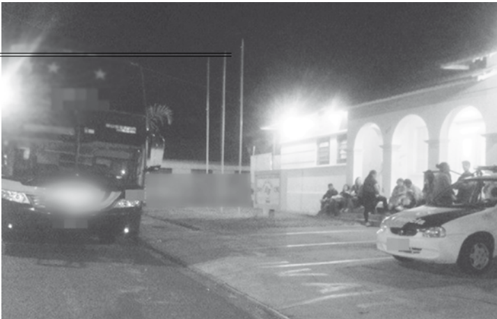
No ônibus, onde estavam cerca de 26 pessoas, também se encontrava um policial militar, que reagiu à ação dos criminosos