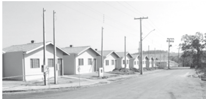
ALÔ?: O Residencial São Francisco viveu seus primeiros dias “habitado” sem linha telefônica