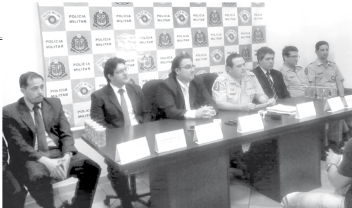
O Ministério Público, por meio do GAECO e o 16º BPMI, realizou a Operação Salus, cujo objetivo era desestruturar o tráfico de drogas na região, por meio do cumprimento de 85 mandados judiciais. A operação contou com a participação de 250 policiais militares

Em sessão ordinária na Câmara, vereadores votaram e aprovaram projeto de lei que previa um aumento salarial da ordem de 60% para cada um dos edis: seus salários atuais, em torno de R$ 5