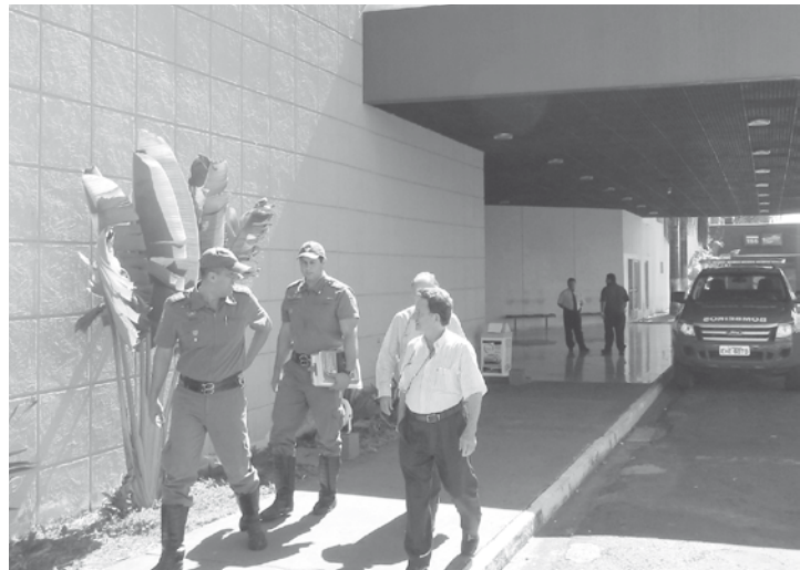
Oficiais dos Bombeiros durante averiguação no Shopping