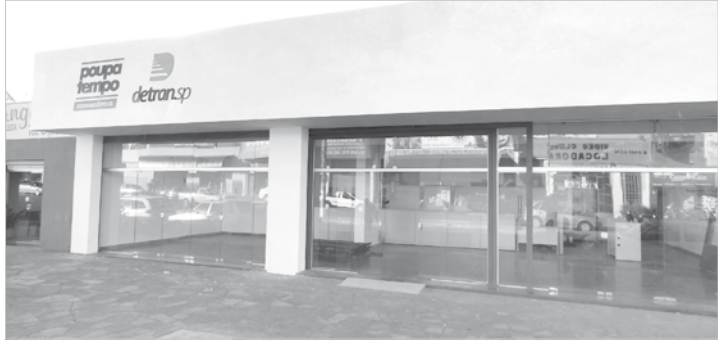
Foi inaugurado em Fernandópolis, o posto de atendimento do Poupatempo. No mesmo prédio, também passou a funcionar o novo Detran e a Central de Atendimento da Prefeitura

mil, seriam ampliados para R$ 8 mil, com os vencimentos entrando em vigor já na próxima legislatura. E ainda com uma ampliação de duas cadeiras na Câmara, totalizando 15 vereadores, saindo das 13 vagas também após