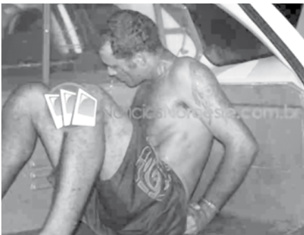
Jovem foi vítima de estupro ao retornar da faculdade. Acusado, conhecido como “Tiquinho” foi detido minutos depois pela PM em um bar, no Bairro Araguaia. Ele já tinha várias passagens nos meios policiais

no controle social de políticas públicas de igualdade de gênero, bem como auxiliar o Município na criação de políticas públicas que promovam a igualdade e o atendimento dos anseios das mulheres.