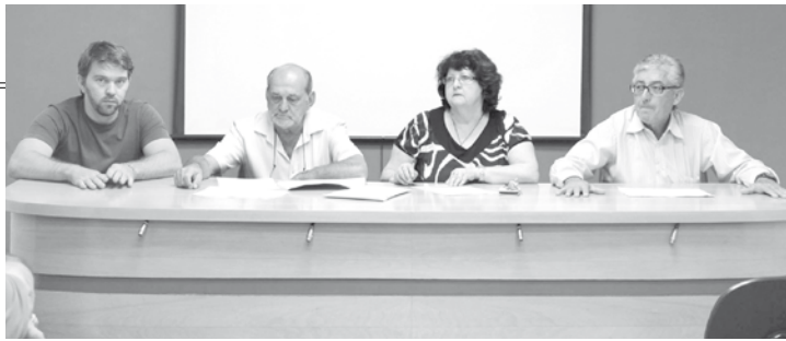
Na primeira semana do mês de maio, em Audiência Pública, executivo fernandopolense previu orçamento de R$ 148 milhões para o ano 2015

Fernandópolis também foi destaque no esporte, a De-