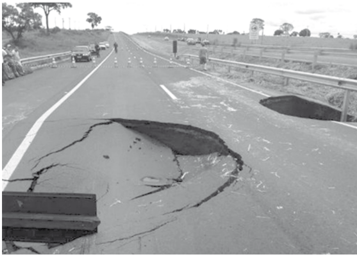
Euclides da Cunha rachada

Mesmo antes da tão aguardada “inauguração oficial”, principalmente politicamente, já que 2014 foi um “ano eleitoral”, a Rodovia Euclides da Cunha já consumia recursos públicos para sua “manutenção”. Para chegar a Rio Preto, saindo da região de Fernandópolis, a Polícia Rodoviária orientava os motoristas sobre duas opções: seguindo de Fernandópolis a General Salgado, passando por São João das Duas Pontes e São João do Itacema, e assim acessando a SP-310, a Rodovia Feliciano Sales Cunha; ou então, seguir até Vo-