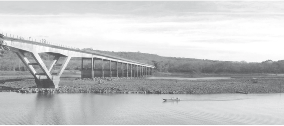
O reservatório de Água Vermelha registrou 15,21% % do volume útil, o pior índice para o mês de julho em 15 anos, segundo registro do Operador Nacional de Sistema Elétrico (ONS) que gerencia o sistema