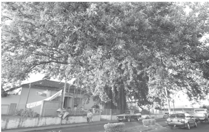
A Seringueira do JAP como era e como foi ficando antes de seu corte total

8 estabelecimentos comerciais foram lacrados por fiscais da Prefeitura de Fernandópolis no início do