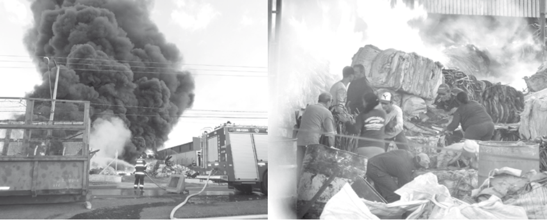
Depósito de reciclável, na marginal da Rodovia Euclides da Cunha, em Fernandópolis, pega fogo e causa maior incêndio já registrado na cidade. 200 mil litros de água foram usados para combater as chamas

um comunicado à população, se diz “surpresa” com a decisão do Partido dos Trabalhadores local.