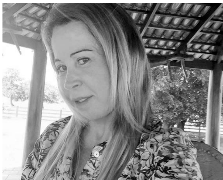
A ex-mulher de Zezé Di Camargo pediu paz para o ano que vem e desejou mais união para as famílias.

raram em definitivo em junho de 2012 e assinaram o divórcio em maio deste ano, após 30 anos de casamento. Pais de Wanessa, Camilla e Igor Camargo, os dois protagonizaram uma separação delicada em rede nacional com direito a idas e vindas nos últimos anos, além de muitos boatos de traição por parte do sertanejo. Após Zilu começar um relacionamento com o cantor Zé Henrique, Zezé decidiu assumir o namoro com Graciele Lacerda, com quem mantém uma relação há dez anos. As filhas de Zezé e Zilu pare-