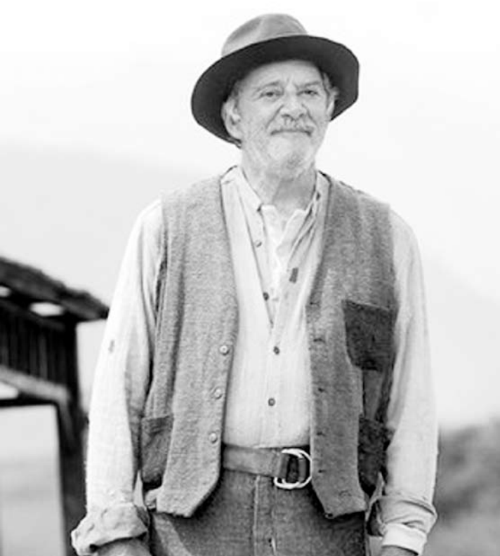
Com arritmia cardíaca e pneumonia, o ator está sob cuidados médicos no CTI da Clínica São Vicente

Cláudio Marzo está internado desde o último domingo, 28, com arritmia cardíaca e pneumonia no Centro de Tratamento Intensivo (CTI) da Clínica São Vicente, na Gávea, no Rio de Janeiro. Segundo a assessoria do hospital o ator, de 74 anos, teve a arritmia controlada, está tomando antibióticos e não tem previsão de alta. Ele está sendo cuidado pelo cardiologista João Emanuel Pedrosa. Cláudio já havia sido internado outras três vezes no ano passado. A última, em novembro de 2013, com quadro de hemorragia digestiva e diver-