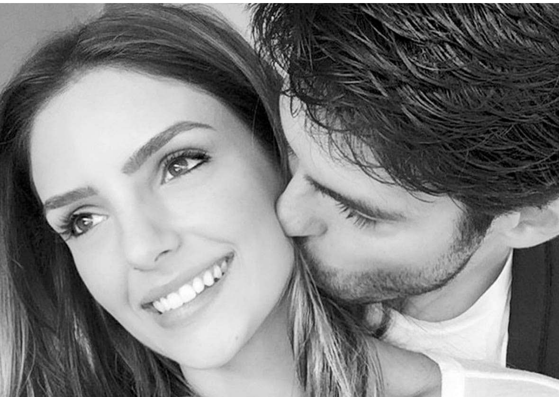
Socialite postou, foto em que aparece ganhando um beijo do jogador de futebol