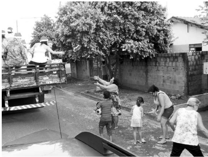
Os Papais Noéis liderados pelo “Pedrinho Mecânico” percorreram alguns bairros da cidade entregando presentes para as crianças