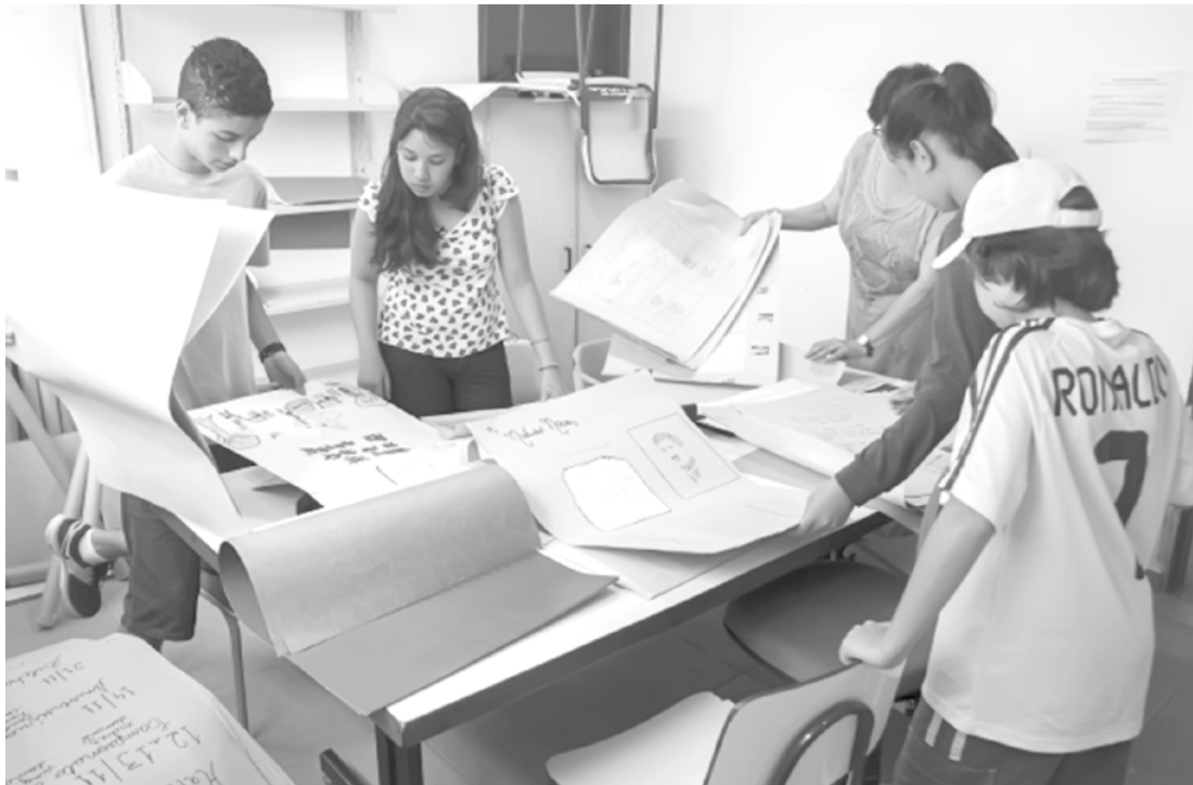
70% das unidades de Ensino Médio mantêm agremiações ativas; Secretaria da Educação dá dicas para criação de novos grupos já durante as férias

→ ASSESSORIA DE IMPRENSA Secretaria da Educação Levantamento que acaba de ser concluído revela que o ano letivo terminou na rede estadual com 3.477 escolas de Ensino Médio com grêmios estudantis ativos. O número corresponde a 70% de unidades em todo o Estado. Em apenas dois anos, cerca de 100 grupos novos foram criados. Os dados da pesquisa marcam o lançamento da página dedicada ao projeto no Portal da Educação, aberta a alunos e professores que podem elaborar as ações do grupo já no período de férias escolares. Em São Paulo, as agremiações têm papel fundamental na gestão das escolas. Os líderes atuam atua nas áreas de