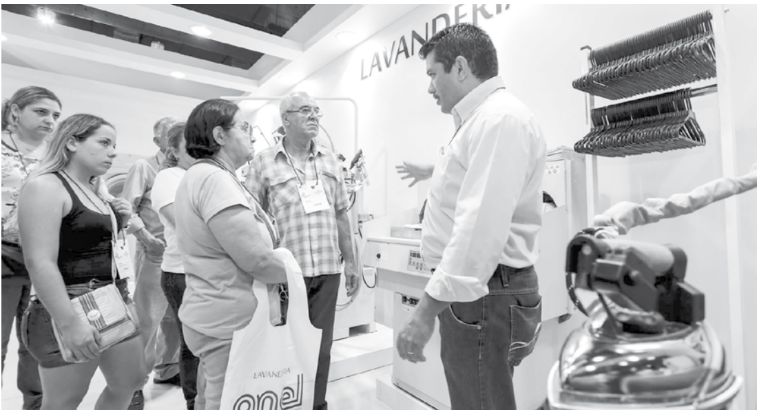
Imagem da Feira do Empreendedor realizada no ano passado