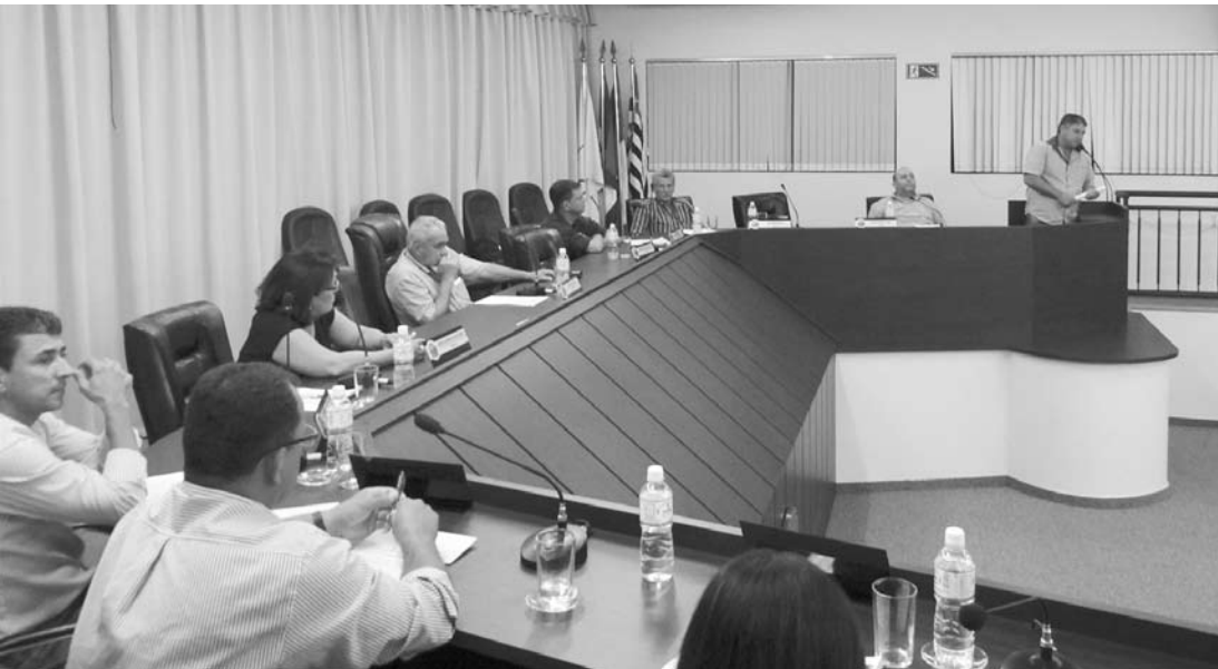
Vereadores durante a Sessão Ordinária realizada no dia 15 de agosto, quando foram aprovados quatro Projetos de Lei do Poder Executivo