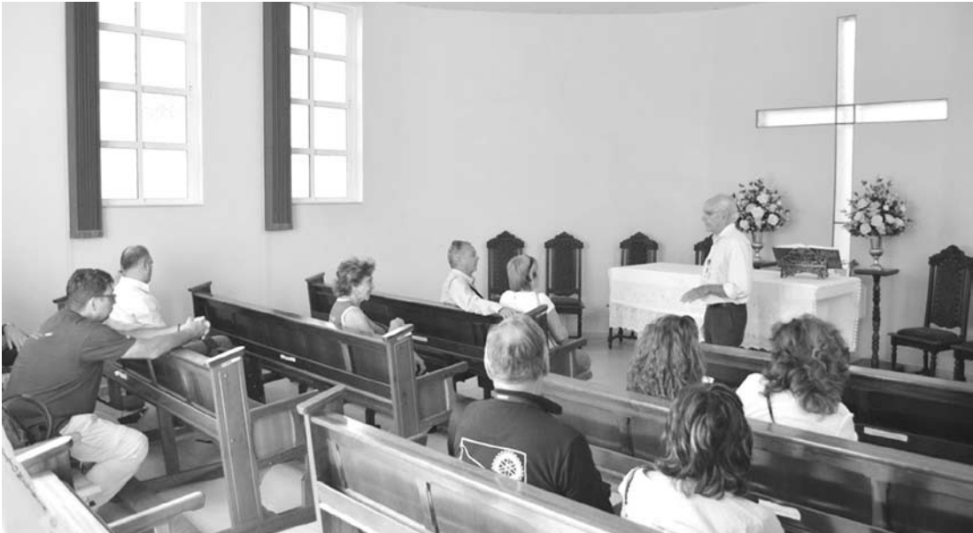
Diversas alas do hospital foram conhecidas pelos integrantes do Rotary Internacional

O grupo ficou na cidade até a última quinta-feira, dia 21. Em Fernandópolis, eles ainda visitaram a Prefeitura Municipal, a FEF, Unicastelo e outras instituições importantes para o município.