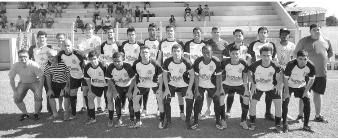
Jogadores e equipe técnica do Clube Esportivo de Ouroeste