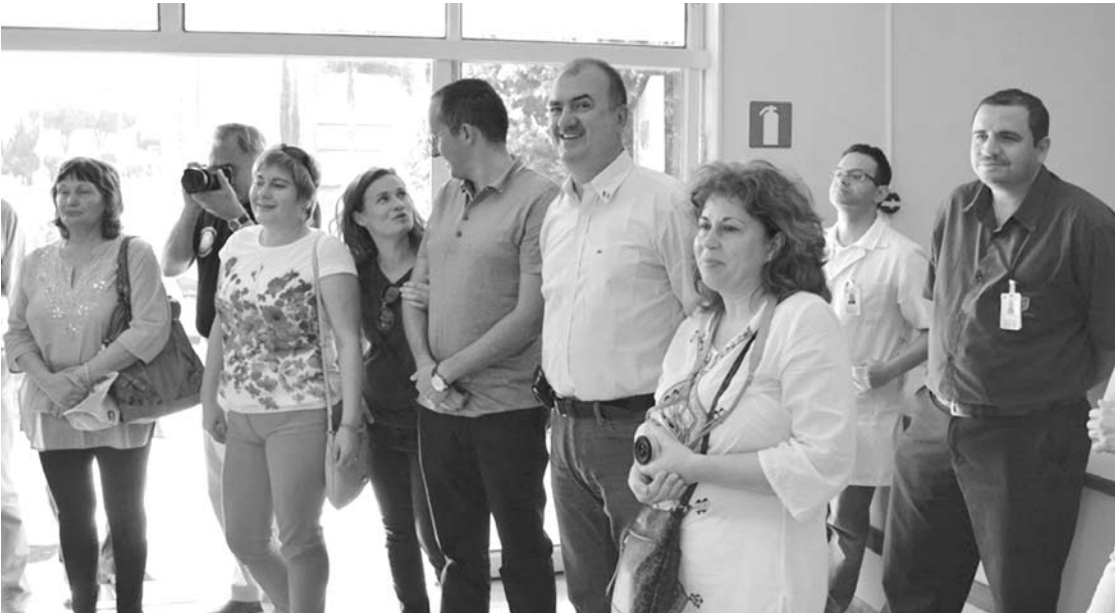
Grupo de romenos se interessou pelo funcionamento clínico e pelo atendimento ao sistema público de saúde oferecido na Santa Casa de Fernandópolis