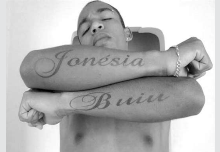
Acusado está foragido desde fevereiro, quando aconteceu o crime

Crime O crime aconteceu em 16 de fevereiro deste ano, em Votuporanga, no apartamento do suspeito, que havia deixado o sistema penitenciário há 30 dias. Segundo a ocorrência, ele e a vítima começaram uma briga generalizada no prédio, quando ele expulsou a filha e a sobrinha da vítima do local, trancando-as para fora. Testemunhas ouviram gritos e pedidos de socorro. Logo depois, ouviram o barulho do corpo caindo do terceiro andar do prédio. Segundo informações, ele teria fugido do local de bicicleta.