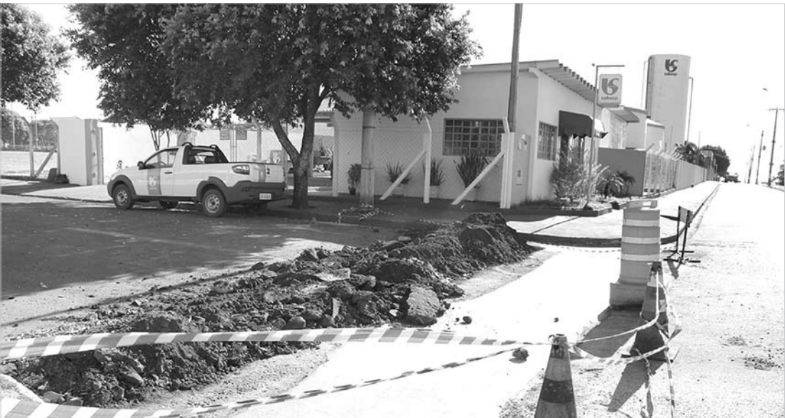
A construção dos sarjetões proporciona melhores condições aos motoristas, bem como facilita e minimiza os impactos dos veículos