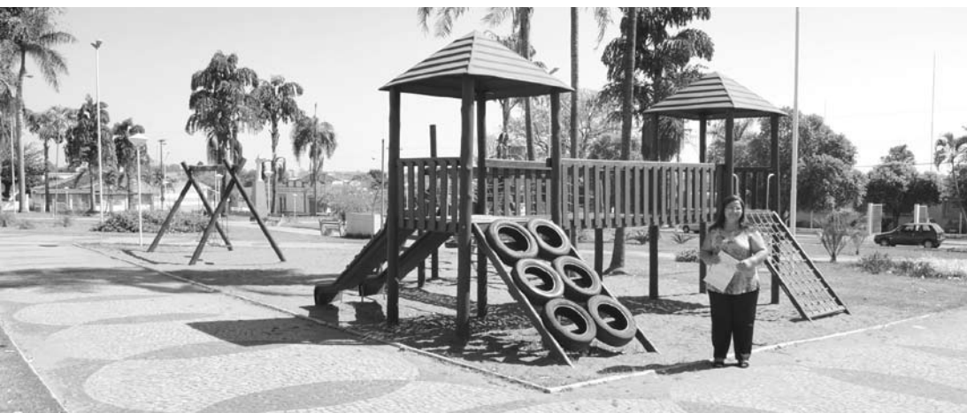
Neide visitou o local onde será instalada a Academia

A Praça da Brasilândia conta atualmente com um playground, que também foi reivindicação da vereadora Neide Garcia.