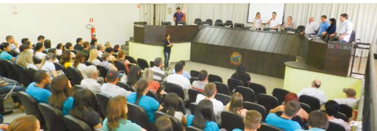
Profissionais do IAGUA e a Administração Municipal finalizaram em Audiência Pública, a elaboração do Plano Diretor Participativo