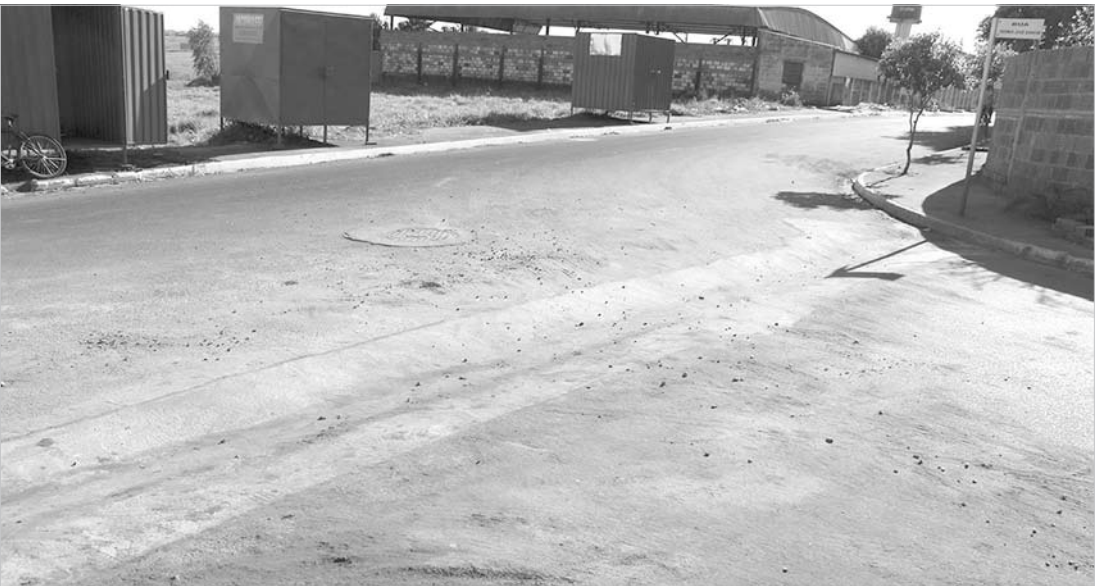
Os sarjetões substituem os locais com “depressão” existentes em esquinas para escoamento de águas pluviais.

sas obras, e outras que estão em andamento, devem complementar a excelente infraestrutura que hoje é oferecida a toda população do município.