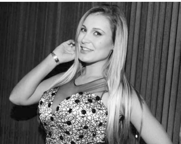
Andressa não se machucou