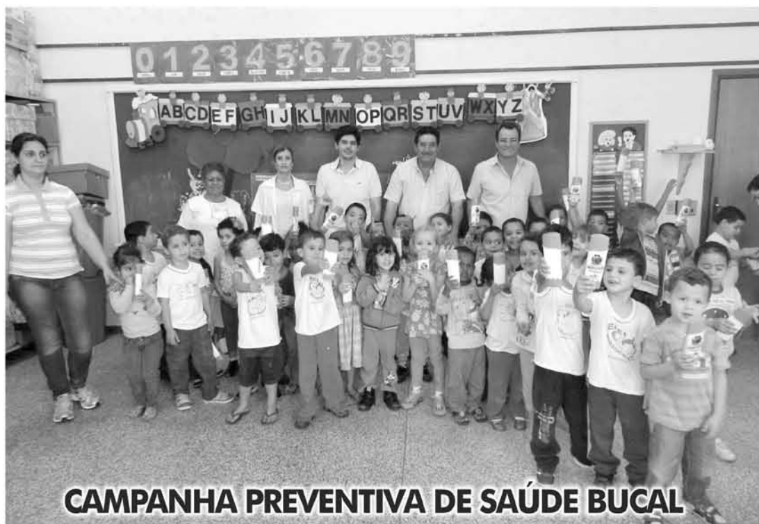
CAMPANHA PREVENTIVA DE SAÚDE BUCAL