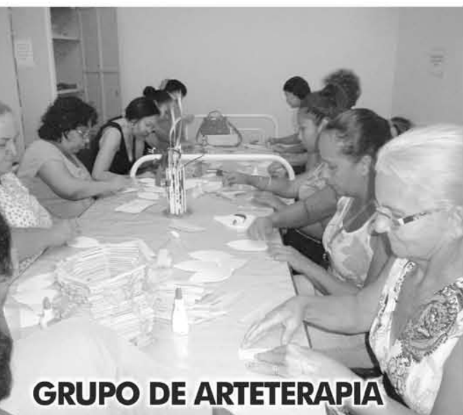
GRUPO DE ARTETERAPIA