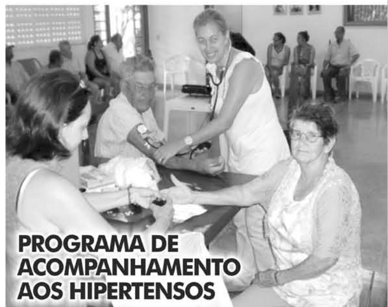
PROGRAMA DE ACOMPANHAMENTO AOS HIPERTENSOS