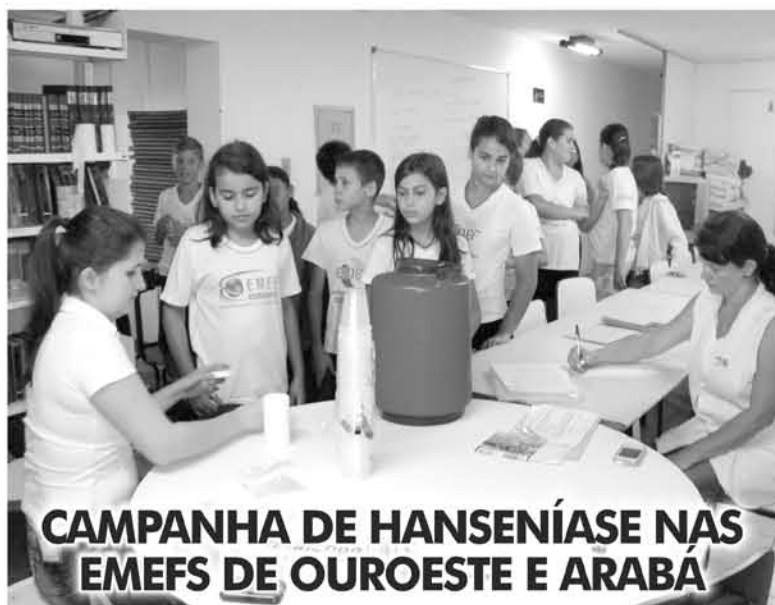
CAMPANHA DE HANSENÍASE NAS EMEFS DE OUROESTE E ARABÁ