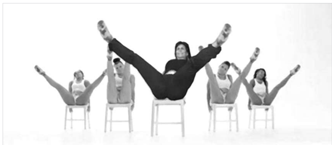
O 'mashup' - mistura das duas faixas - foi postado por um internauta com direito a montagem do rosto da brasileira no corpo da americana

na do clipe da americana. Morando em Portugal, Gretchen assistiu ao vídeo e aprovou o resultado. "Nicki é linda, sensual e muito charmosa. Tem o rebolado das mulheres brasileiras, das funkeiras e das africanas. Vi o remix que fizeram da música dela com o 'Melô do Piri Piri e amei'", contou ela.