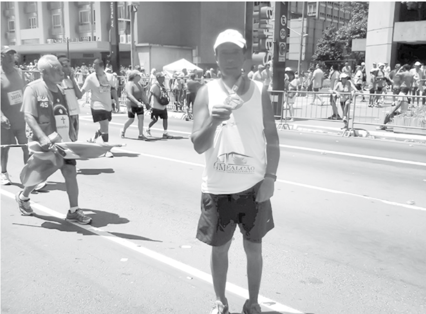
Em plena Avenida Paulista, atleta fernandopolense mostra sua medalha conquistada na corrida de São Silvestre