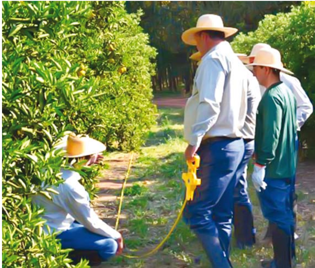
Agentes em visita às propriedades de citros

tabelecimento das metodologias da pesquisa. No mesmo sentido, a SAA tem se voltado para o Departamento de Agricultura dos Estados Unidos, responsável pela realização da estimativa de safra de citros da Flórida, segundo maior produtor mundial de suco de laranja.