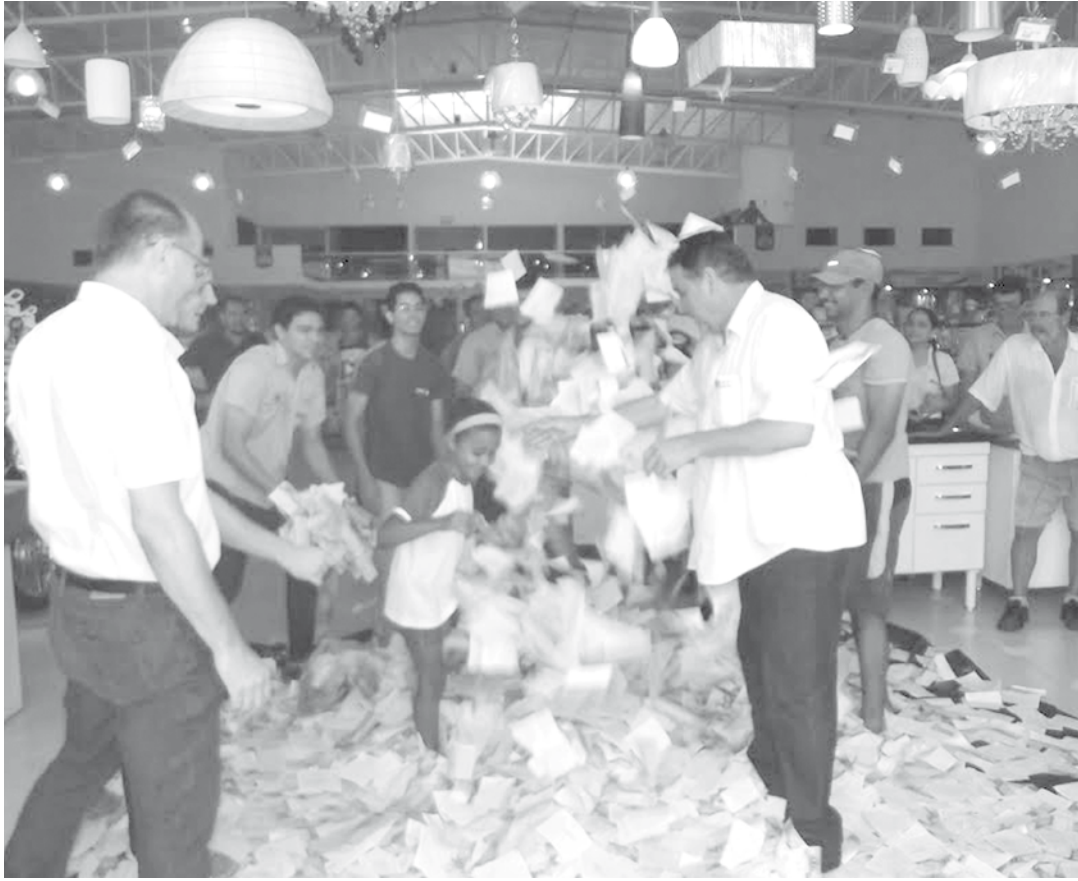
Momento do sorteio que contemplou a fernandopolense