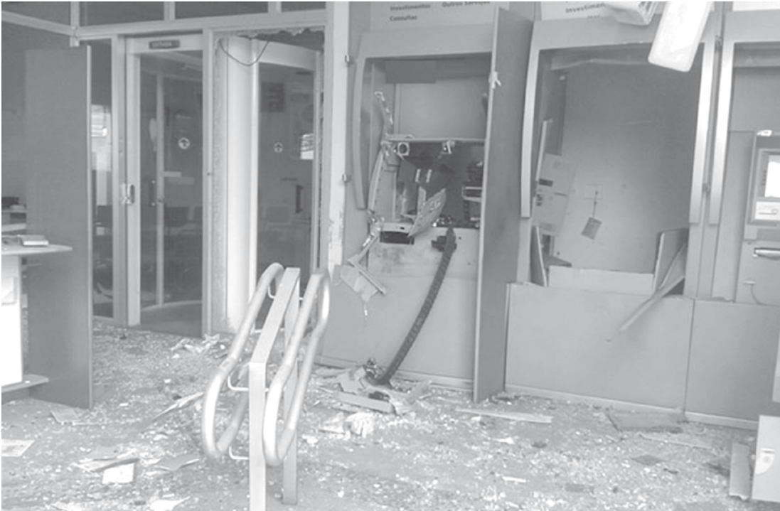
Dois dos três caixas eletrônicos da agência foram danificados

acionada e procura pelos suspeitos. Ainda não há informações sobre quantos bandidos participaram da ação. Gravações das câmaras de segurança dos estabelecimentos ao redor da agência poderão ajudar nas investigações.