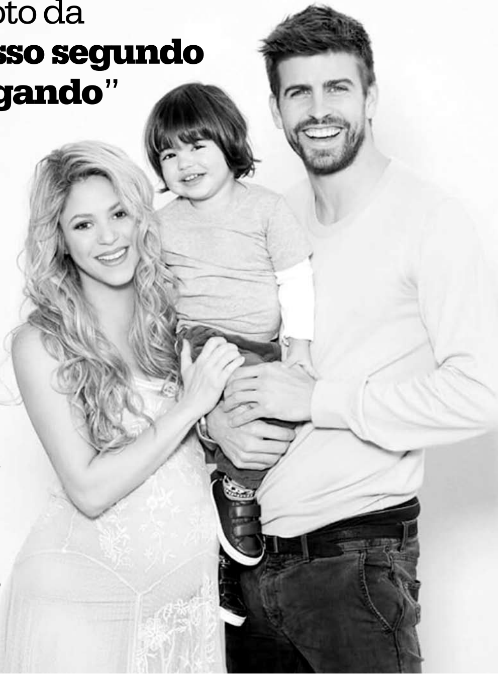
Cantora convocou seus seguidores a participarem de um chá de bebê beneficente em parceria com a UNICEF