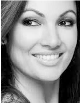
Enquanto isso, Poeta permanecerá na geladeira da Globo

Além disso, o canal recebeu uma série de projetos de