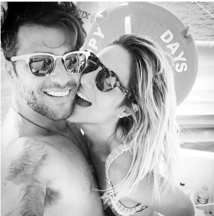
Será que o herdeiro chega este ano?

O ator, que afirma já ter iniciado os trabalhos para que a gravidez se concretize, tam-