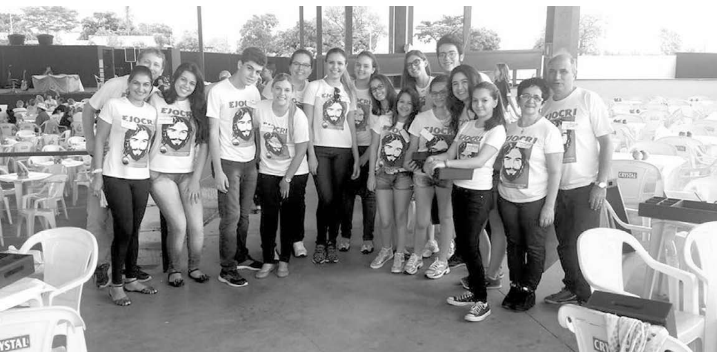
Destaque para a galera do EJCRI em mais um ano de participação nos festejos de São Sebastião, que completou 50 anos de tradição na cidade.