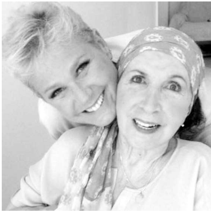
Em gesto de carinho, Xuxa aparece ao lado da mãe

(acidentes vasculares cerebrais) em 2014. Ela sofre de Mal de Parkinson, doença neurológica e degenerativa em estágio avançado. Apesar disso, em outubro do ano passado seu quadro apresentou melhora e ela voltou a re-