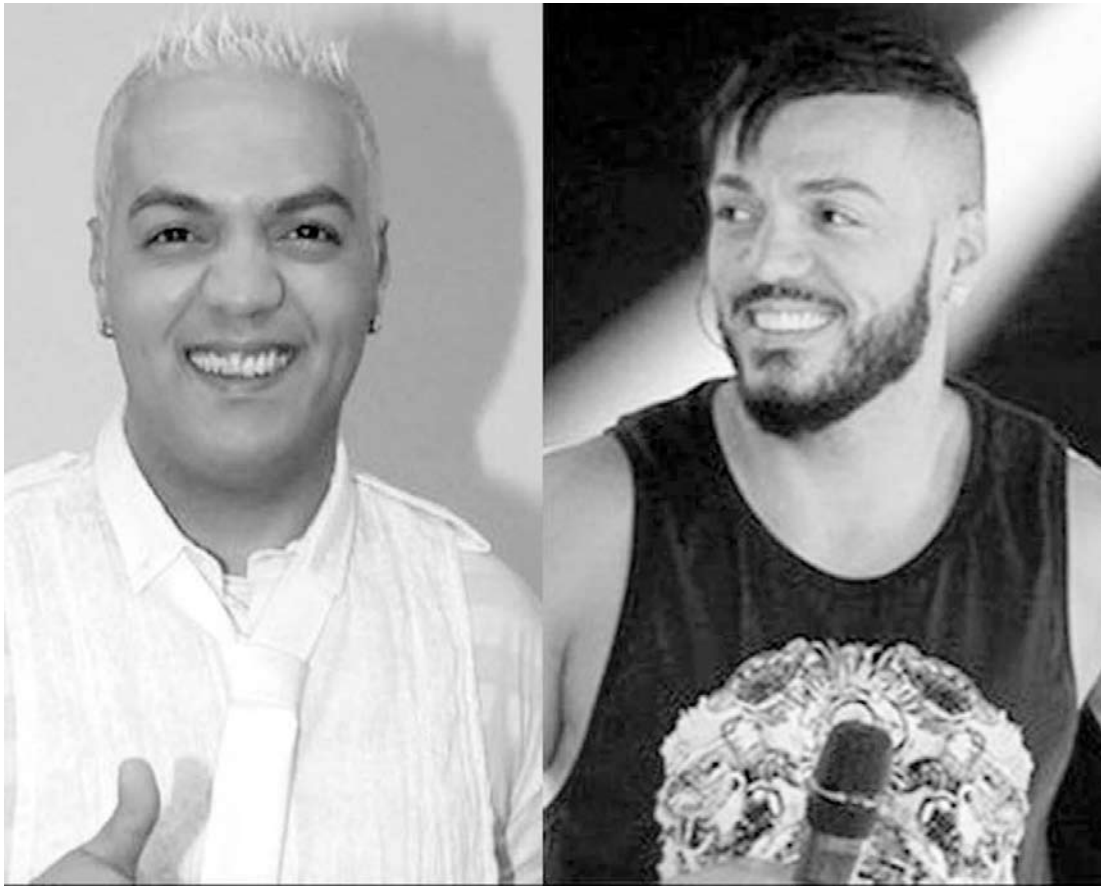
A evolução de Belo

tária. O procedimento, muito usado por personalidades hollywoodianas, tem finalização natural e foi feito em apenas cinco dias. O cantor, que confessou que não procurou um profissional antes por medo, disse que ficou surpreso com a agilidade do procedimento e muito feliz com o resultado. “Estou sorrindo à toa. Se eu soubesse que seria assim tão fácil, teria feito muito antes. Agora me sinto completo. Minha esposa e todos à minha volta estão orgulhosos”, declarou.