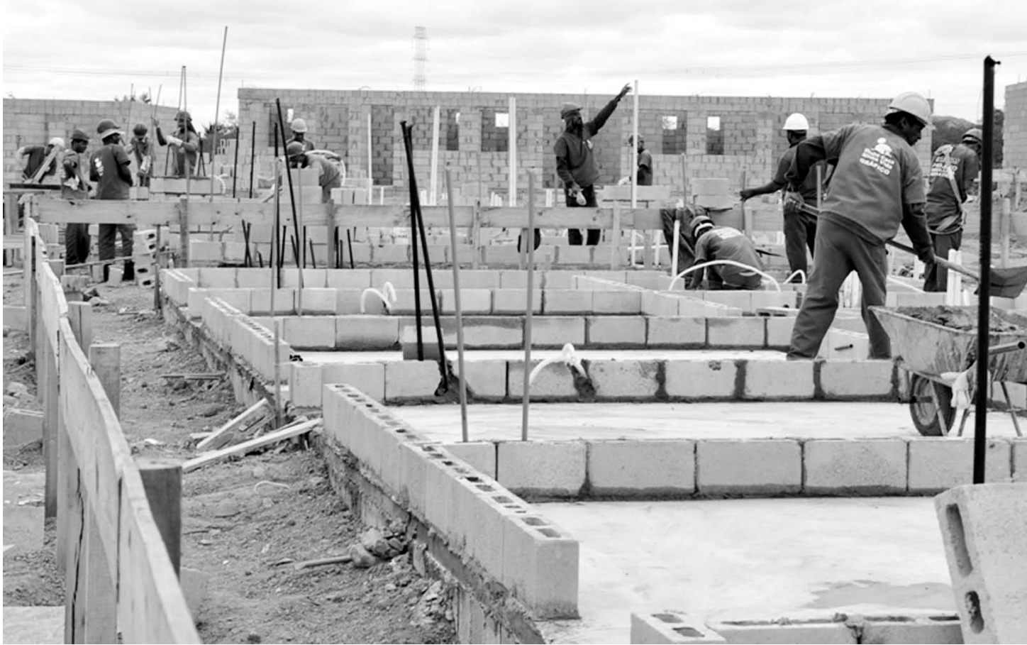
O indicador de evolução da atividade, em relação ao usual para o mês, alcançou 38,2 pontos em dezembro do ano passado

de unidades em todo o Estado. Em apenas dois anos, cerca de 100 grupos novos foram criados. Em São Paulo, os líderes atuam nas áreas de comunicação, cultura, esporte, e social. Eles também ajudam em atividades que melhoram o aprendizado, como a promoção de cursos e debates, e em projetos que podem mudar o comportamento dos estudantes.