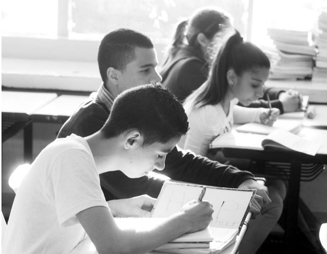
O Conselho de Escola é formado por diretor, professor, funcionário, aluno, família e representantes da comunidade

Para participar do Conselho, pais e responsáveis devem ter um perfil de multiplicador. É importante que eles tenham disponibilidade para acompanhar o dia a dia da escola, relacionar-se bem com