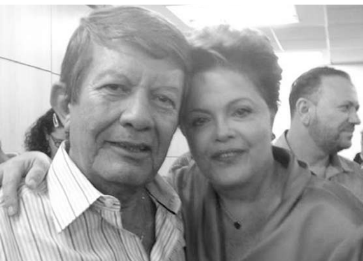
O ex-deputado petista Devanir Ribeiro também apaga velinhas nesta terça. Na foto, com a presidenta Dilma Rousseff.