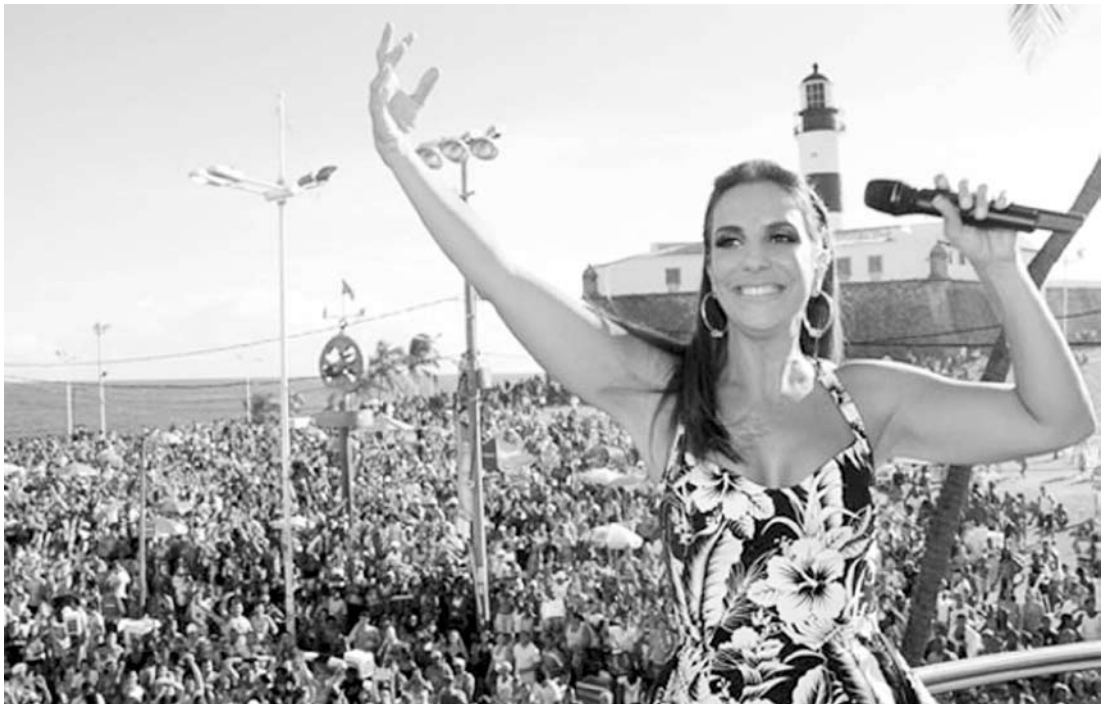
A cantora baiana irá cantar na terça-feira de Carnaval na cidade de Votuporanga

Em 2015, Ivete Sangalo irá se apresentar pela primeira vez fora de Salvador durante o carnaval. A cantora baiana irá cantar na terça-feira de carnaval na cidade de Votuporanga.