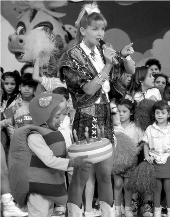
Registros de Xuxa no comando de seus primeiros programas infantis na TV Globo: adeus à emissora carioca foi confirmado no início desta semana

Na Globo, Xuxa estava na “geladeira” havia mais de um ano. A emissora dos Marinho, aparentemente, não tinha mais espaço para ela, que foi uma das principais e mais rentáveis estrelas da casa por quase 30 anos. Depois que soube que a Record estava interessada em seu passe, a