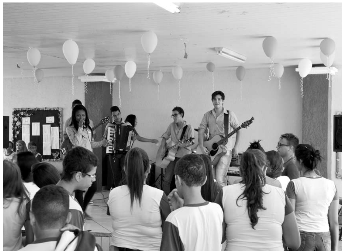
Os músicos do projeto " Os Sonhadores " foram a grande atração na volta às aulas na escola JAP, na última segunda-feira (02). Nas boas vindas aos alunos, eles cantaram e animaram o retorno à escola para o início do ano letivo, após período de férias.