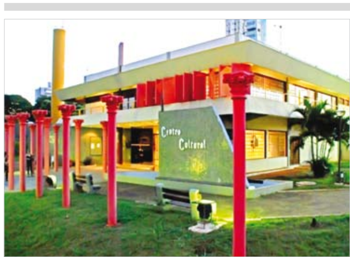
Aulas no Teatro serão totalmente gratuitas

O encerramento do evento aconteceu no domingo, com a peça “O menino sem Lugar”, do grupo de Catanduva, apresentado no bosque da cidade.