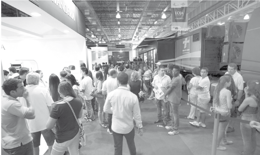
A 4ª Feira do Empreendedor acontece entre os dias 7 a 10 deste mês: acima, registros do principal evento do empreendedorismo brasileiro realizado em 2014, e que agora será anual

Os pequenos negócios, que somam mais de nove milhões no Brasil e 2,5 milhões somente no Estado de São Paulo, ganham em 2015 uma oportunidade especial de fomento, capacitação e profissionalização. De 7 a 10 de fevereiro, será realizada no Pavilhão do Anhembi a 4ª Feira do Empreendedor. O Escritório Regional do Sebrae-SP terá uma missão no dia 9, com a participação de 80 empresários de Votuporanga, Fernandópolis, Jales, Nhandeara e Santa Fé do Sul. Promovida pelo Sebrae-SP, a maior feira de empreendedorismo brasileira, que acontecia a cada dois anos, passa a ser anual, ampliando a oferta de orientação, produtos, serviços e possibilidades de network a um segmento da economia que, apesar de todas as dificuldades, vem crescendo em várias frentes de atividade e se mantém como o grande gerador de emprego no país. Levando suporte e estímulos à competitividade das micro e pequenas empresas, a Feira do Empreendedor também se expande: recebeu no início de 2014, em sua última edição, 82 mil visitantes, 50% a mais do que em 2012, e em 2015