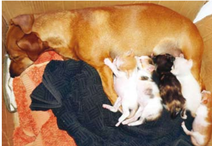
Cadela “Mel” amamenta os cinco filhotes abandonados na porta da casa dos seus donos

Ana Paula tirou fotos da cena e compartilhou na rede social Facebook. A postagem teve quase 200 curtidas e foi compartilhada por mais de 20 vezes, somente na manhã de ontem. “As pessoas ficaram tão admiradas quanto nós porque ninguém vai imaginar que o cão e o gato, que são animais considerados inimigos, tenham esse tipo de relação” destacou a dona.