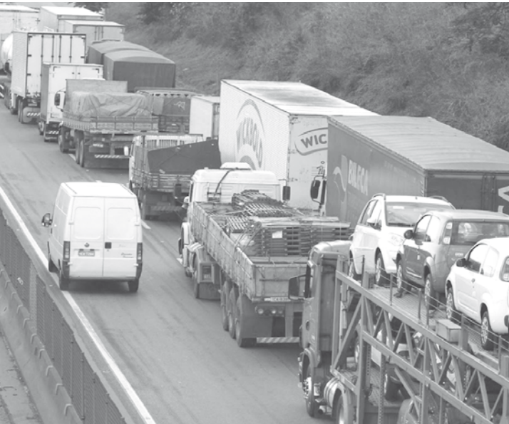
Combate ao uso de entorpecentes, causa significativa de acidentes

Medida vale a partir de 30 de abril e análise vai levar em conta consumo de entorpecentes ilícitos e até de remédios controlados cujo uso seja feito sem prescrição médica