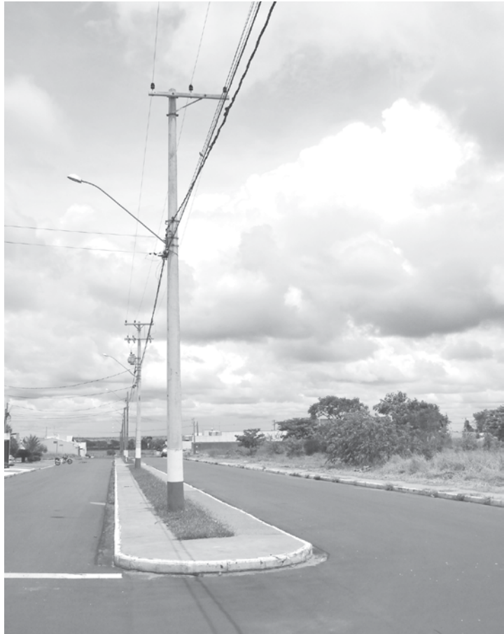
A própria população poderá solicitar os serviços da empresa através do telefone 0800 7711135