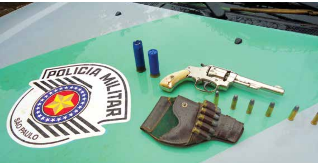
Policiais também apreenderam armas de fogo no período de fiscalização intensa na região

licciamento ostensivo foram intensificadas nas atividades de preservação da ordem pública e de proteção ao meio ambiente, com enfoque na prevenção e repressão de infrações liga-