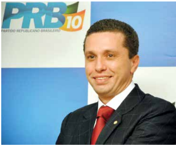
Deputado fernandopolense, Fausto Pinato

→ Da REDAÇÃO contato@oextra.net Em apenas 19 dias de mandato, o deputado federal Fausto Pinato (PRB-SP) já apresentou seis propostas de projetos de lei que já estão em análise na mesa da presidência na Câmara dos Deputados, em Brasília. Alguns deles já foram encaminhados às comissões permanentes antes de ir a plenário. Já nos primeiros dias, após assumir o cargo, Pinato protocolou projeto de lei (PL 181/2015) que dispõe sobre a isenção do Imposto sobre Produtos Industrializados (IPI) e do Imposto de Importação (II) para todo material de construção, obra de arte ou objeto decorativo considerado sagrado e/ou de valor histórico cultural, importados para a reprodução de templos religiosos ou lugares sagrados, em razão do simbolismo religioso para seus fiéis, contribuindo para estimular o turismo religioso no país. A PL182/2015 trata do reuso de águas residuais pelas empresas. Hoje, as indústrias são as que mais consomem água tratada; ocorre que, parte dessa água tratada e que poderia ser utilizada para consumo humano está sendo usada pelas indústrias não só como matéria prima, mas, também para lavar o chão, os equipamentos, jardins, etc. Isso acontece porque o preço de captação da água e o valor do despejo dessa mesma água são mais baratos do que sua reutilização. Faus-