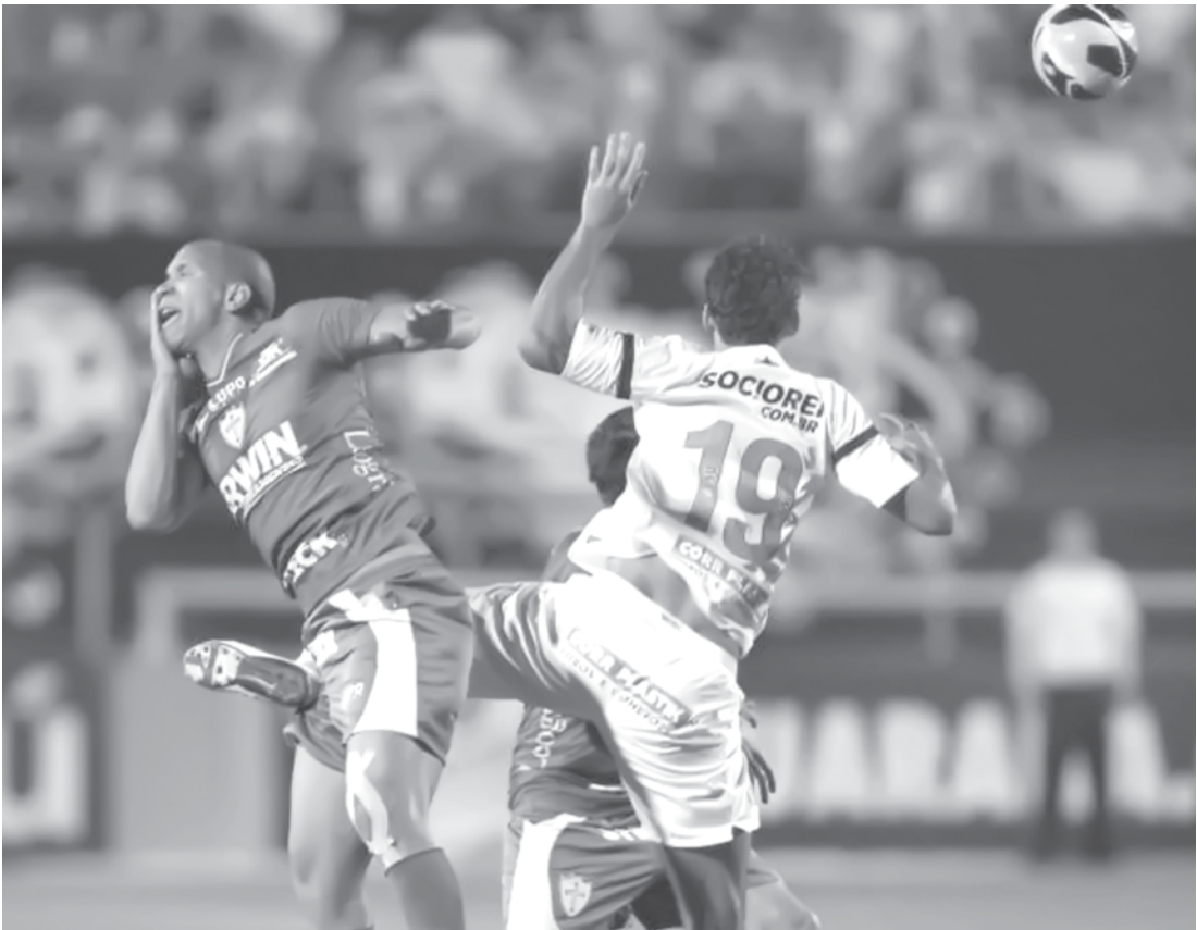
Santos e Portuguesa fazem o clássico da rodada

Ituano. O atual campeão vem engrenando após estreitar com derrota e promete acirrar ainda mais a briga pela segunda vaga, que hoje pertence ao Mogi Mirim. O Sapo soma 11 pontos, contra oito do Galo. DE OLHO NOS GRANDES Vivendo altos e baixos e modelando o seu elenco, o Palmeiras tenta engatar a terceira vitória seguida contra o penapolense, time que ainda não venceu, tem apenas dois pontos e está na zona de rebaixamento. O Verdão não pode titubear, pois pode perder a liderança do Grupo C para a Portuguesa, que tem um jogo a menos. O São Paulo, por sua vez, tenta “esquecer” a derrota para o Corinthians e focar no confronto diante do Osasco Audax. O Tricolor está invicto no Paulistão e é o líder do forte Grupo A com 11 pontos. Já o time osasquense ainda não venceu. O tiki-taka ainda não engrenou e vem de quatro empates seguidos, todos por 1 a 1. Se reabilitar diante de um grande