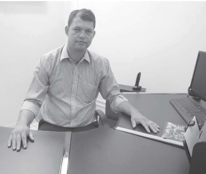
O presidente da Câmara esclareceu durante a última sessão sobre a nova situação da iluminação pública do município