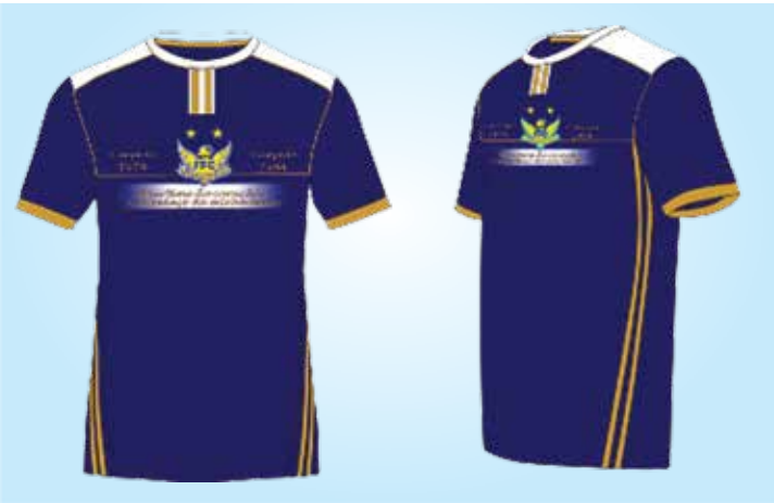
Camisa oficial do Fefecê para a temporada 2015