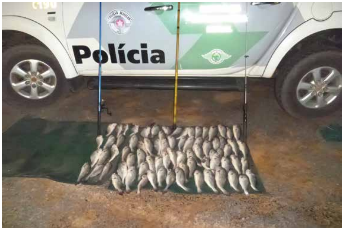
Peixes apreendidos durante a operação

das à ictiofauna e caça de animais silvestres. As ações tão foram intensificadas na prevenção do cometimento de delitos praticados nesse período, em especial furto e roubo, salvaguardando as pessoas de seu patrimônio e de sua integridade física, sendo ao final atingidos os resultados estabelecidos no planejamento da Operação.