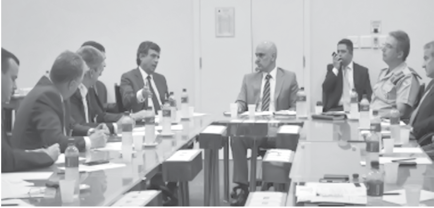
A reunião foi realizada na sede da Secretaria da Segurança Pública (SSP), no Centro da Capital

eles sejam mapeados e georreferenciados, de modo a facilitar o trabalho de inteligência policial e o mapeamento de rotas de fugas em casos de explosões. Este trabalho de mapeamento será concluído até terça-feira, quando os locais dos caixas passarão a constar dos sistemas de georreferenciamento das polícias, em especial do Departamento Estadual de Investigações Criminais (Deic) e do Centro de Inteligência da PM (CI-PM). Este intercâmbio de informações também permitirá que as imagens das centrais de monitoramento de cada banco e agência sejam enviadas em tempo real para o Detecta – sistema inteligente de monitoramento de crimes do Estado de São Paulo. Obstáculos e força-tarefa Durante a reunião, a Febraban tse comprometeu a instalar em 100% dos caixas eletrônicos mecanismos que previnam os furtos – como emissores de fumaça e dispensadores de tintas para manchar e inutilizar as notas obtidas pelos criminosos. Estes mecanismos – chamados tecnicamente de “ofendículos” – também incluem a adoção de placas especiais que dificultam o arrombamento e a afixação de explosivos pelos criminosos. Estas medidas serão acompanhadas dos trabalhos de investigação e prevenção das polícias, que já resultaram na prisão de 173 criminosos no ano passado. “Monta-