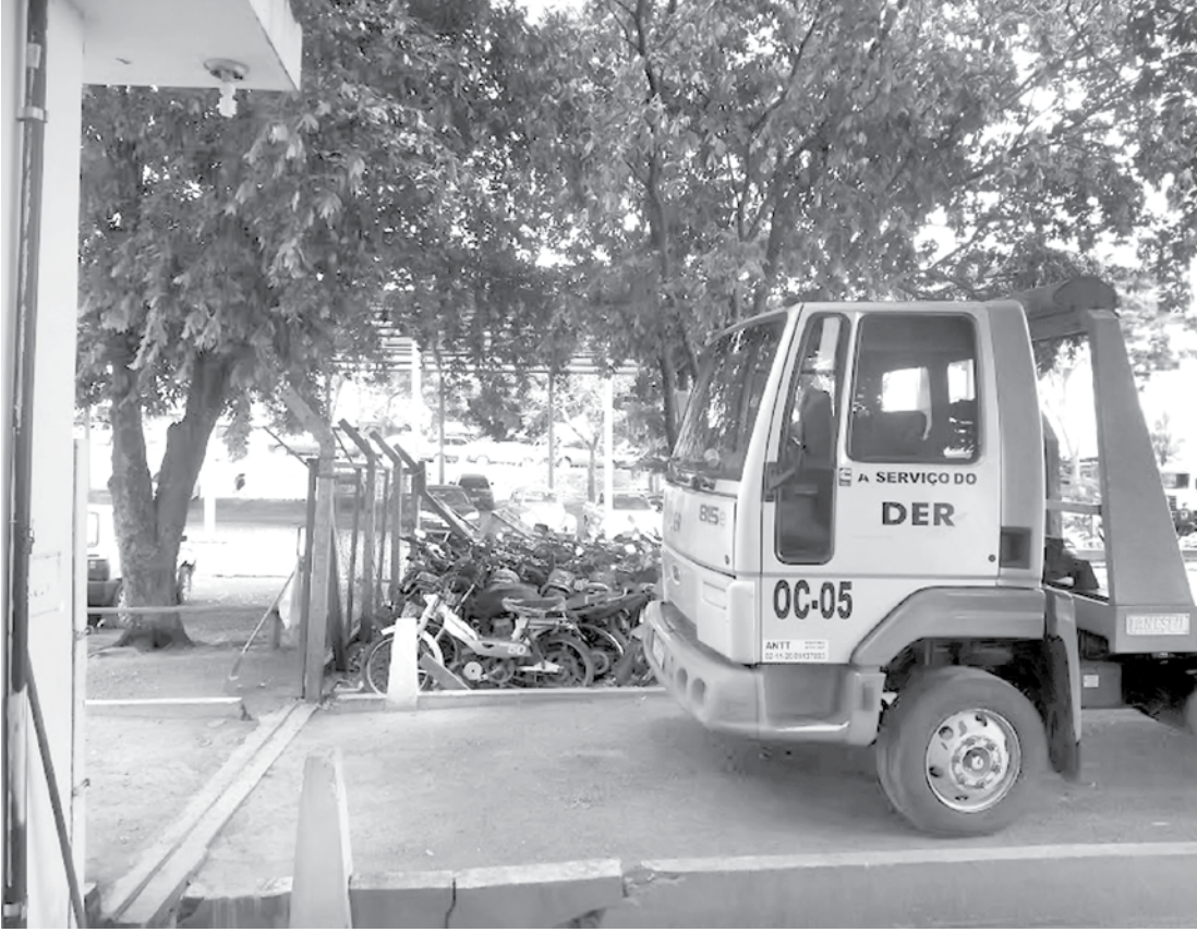
DER liberou ontem os veículos aos seus condutores