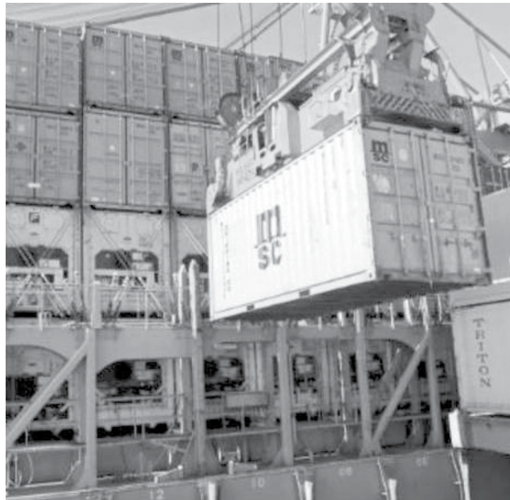
Nas importações, a média diária até a terceira semana de fevereiro é de US$ 829,8 milhões, 8,1% abaixo da média de fevereiro de 2014, de US$ 903,1 milhões

radores, óxidos e hidróxidos de alumínio, motores para veículos, açúcar refinado e autopeças. Nos semimanufaturados, a retração é de 1,3%, puxada por açúcar em bruto, semimanufaturados de ferro/aço, ferro-ligas, couros e peles e ferro fundido. Nas importações, a média diária até a terceira semana de fevereiro é de US$ 829,8 milhões, 8,1% abaixo da média de fevereiro de 2014, de US$ 903,1 milhões. Nesse comparativo, decresceram os gastos, principalmente, com farmacêuticos (-24,8%), borracha e obras (-18,4%), veículos automóveis e partes (-16,9%), instrumentos de ótica/precisão (-16,6%), combustíveis e lubrificantes (-16,1%), químicos orgânicos/inorgânicos (-13,8%) e equipamentos mecânicos (-13,3%).