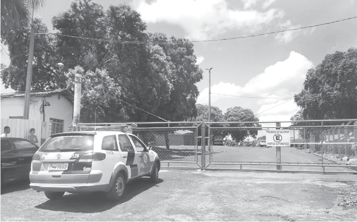
PM foi acionada para elaborar Boletim de Ocorrência no local

Segundo o condutor, todo o procedimento foi realizado e, posteriormente, ele foi até a base da Polícia Rodoviária para retirar o “Auto de Liberação”, concedido pelos policiais. Com o documento e comprovante do pagamento em mãos, o condutor seguiu até o pátio do DER às margens da Rodovia Euclides da Cunha. No local, foi recebido por uma funcionária que, ao pegar o comprovante do pagamento (boleto), disse que não poderia liberar o veículo. Segundo ela, o boleto que foi pago em um correspondente bancário deveria ter sido pago em uma casa lotérica, porque, embora o recibo tenha sido gerado no sábado, o pagamento seria efetivado no próximo expediente bancário, ou seja, somente ontem (23). Quando condutor e atendente conversavam, chegou outra proprietária de veículo no local, também para retirar seu carro e, após entregar o boleto pago, desta vez em uma casa lotérica, foi in-