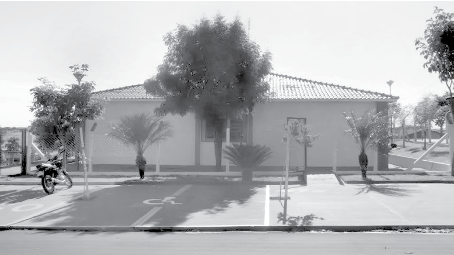
Prédio que abriga a Creche Municipal recebeu uma série de melhorias

Unidade atende a cerca de 100 crianças de 3 a 5 anos, matriculadas na educação infantil da Rede Municipal