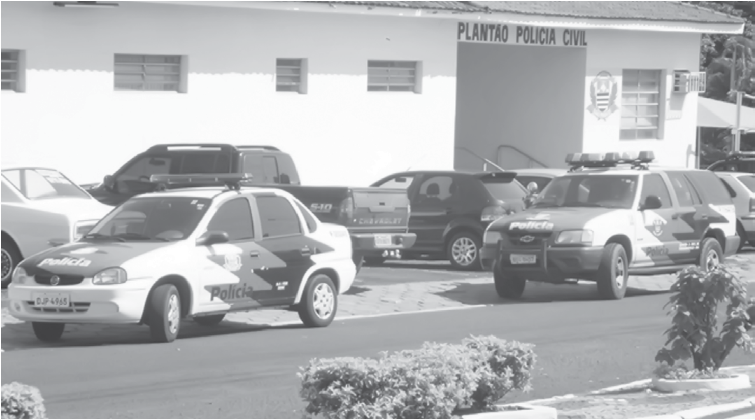
Plantão Policial foi movimentado em Fernandópolis no último final de semana