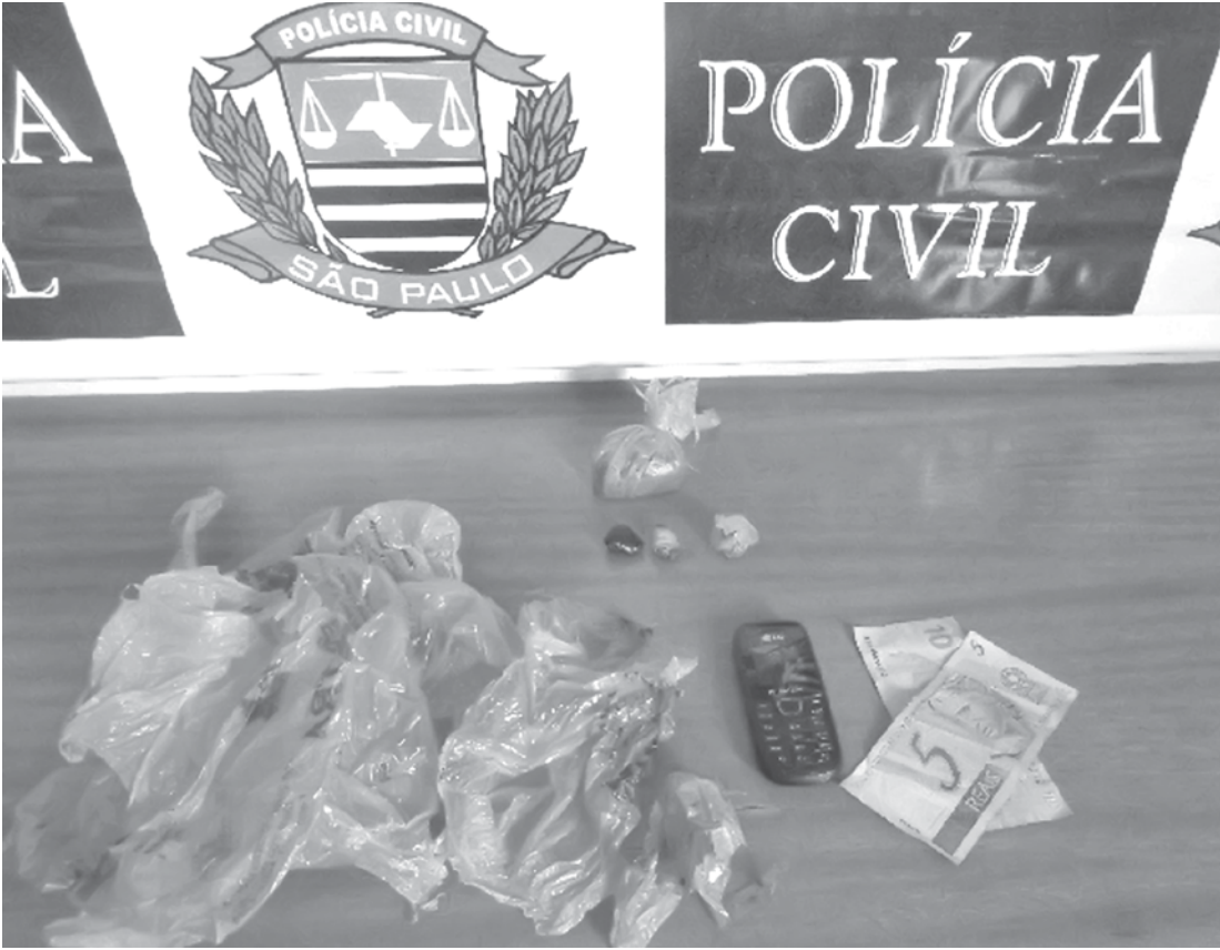
Droga apreendida pela DISE