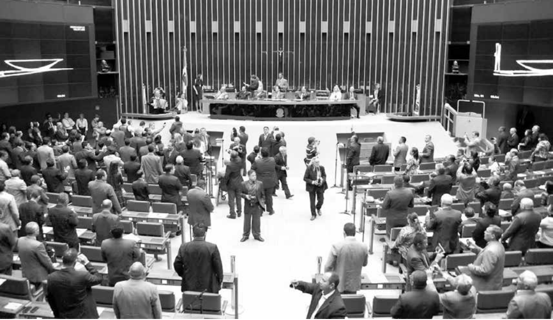
Com a revogação, volta a valer a proibição de pagamento de passagens para cônjuges em vigor desde 2009

caso que ficou conhecido como “farra das passagens”. Desde então, apenas parlamentares e assessores têm o benefício para viagens oficiais. O peemedebista não explicou quais seriam os critérios para o pagamento de passagens em casos excepcionais. Ele citou a deficiência física da deputada Mara Gabrilli (PSDB-SP), terceira secretária da Mesa Diretora, que precisa de cuidados especiais e da presença constante de acompanhantes. “Não dá para criar critérios para definir a excepcionalidade”, afirmou a tucana.