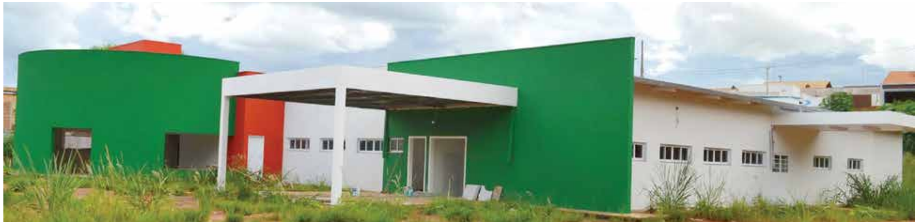
Cerca de 80% da obra já está concluída

A unidade está sendo construída em um terreno na Avenida dos Arnaldos, no bairro Residencial Pôr do Sol, uma das principais avenidas da cidade, facilitando a logística das ambulâncias para qualquer área do município. Além disso, estrategicamente o prédio fica a uma peque-