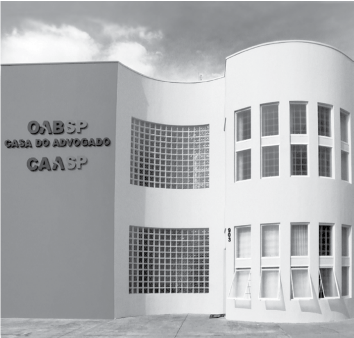
Evento festivo será realizado em dois dias na 45ª Subseção da OAB

A Comissão da Mulher Advogada e a 45ª Subseção da OAB Fernandópolis ressalta a importância da união da classe, como fortalecimento para a manutenção da ordem e respeito à cidadania, em especial às mulheres advogadas, indispensáveis ao estrito cumprimento da lei, mas com a delicadeza que lhes é peculiar.