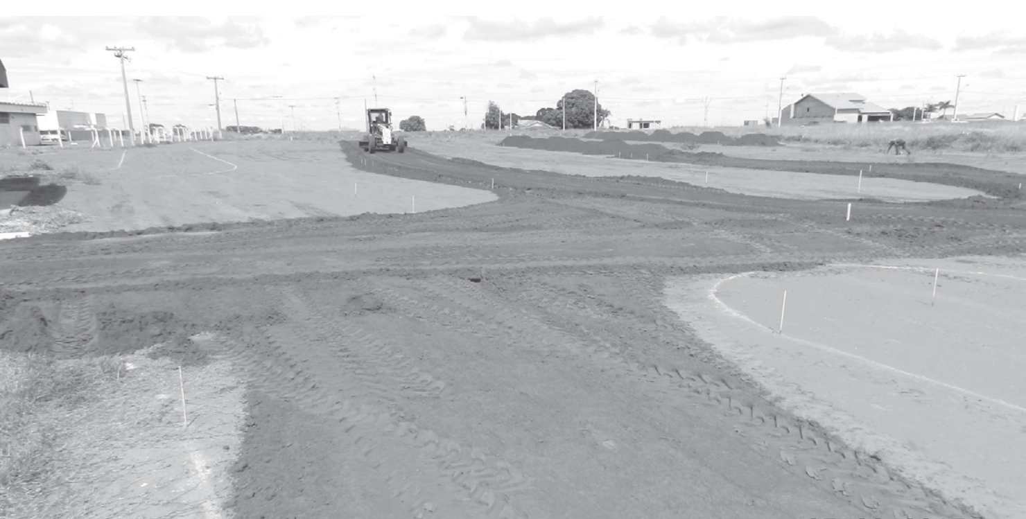
Toda população poderá se beneficiar com a conquista