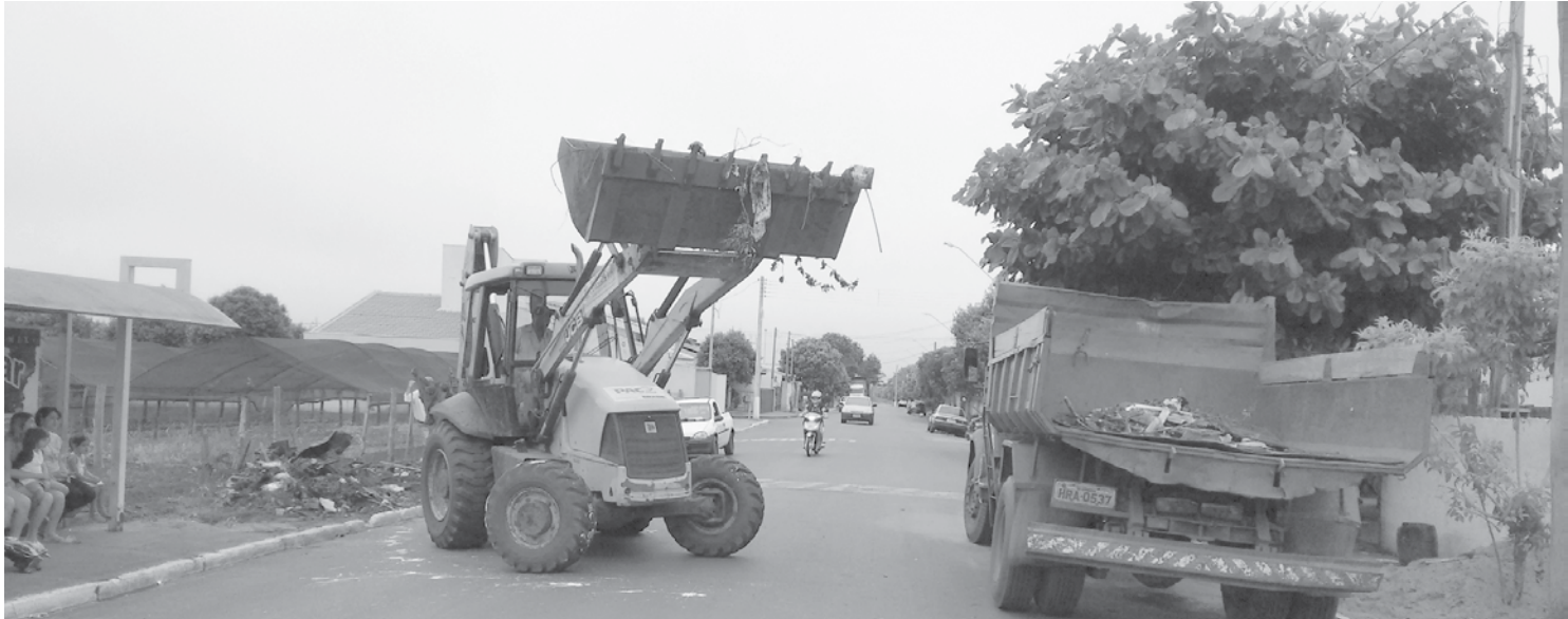
Este é o terceiro ano que o município desenvolve o projeto