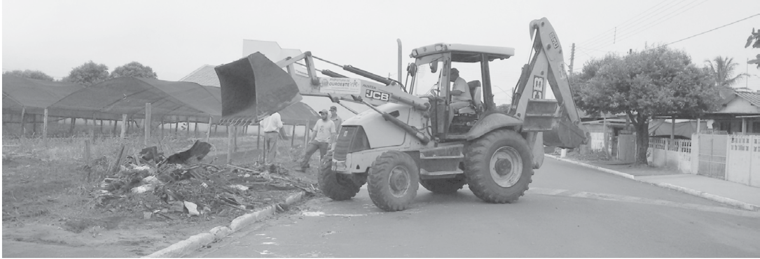
Foram recolhidas mais de 70 toneladas de material inservível