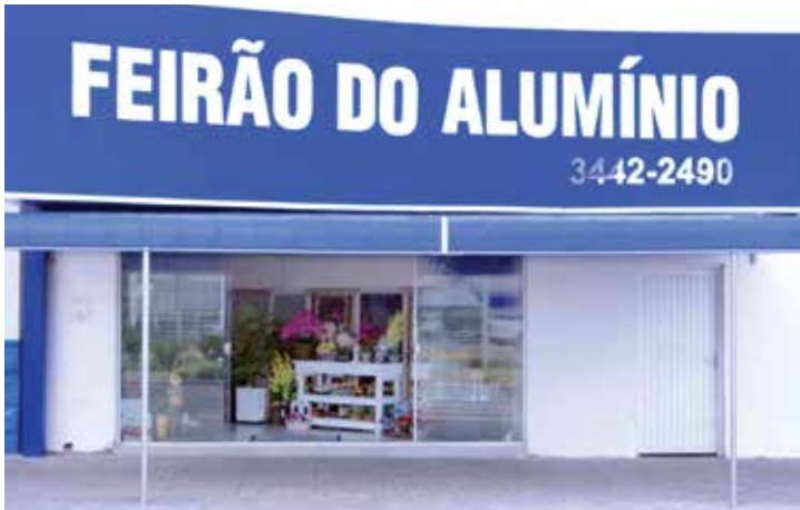
Entrada da loja que fica na Avenida Expedicionários Brasileiros