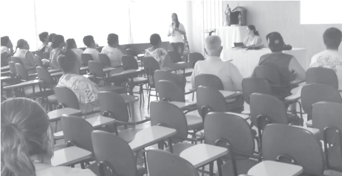
Evento foi organizado pela ESF e NASF do município

-se rapidamente, estas células tendem a ser agressivas, formando tumores benignos ou neoplasias malignas. Um tumor benigno significa uma massa de células que se multiplicam sem constituir um risco de vida. Os diferentes tipos de câncer correspondem aos vários tipos de células do corpo. NOVO ENCONTRO Uma nova palestra volta a ser realizada aos cuidados da saúde já está agendada em Ouroeste. Será no próximo dia 18, também no Salão Paroquial, às 9h, desta vez trazendo como o tema: “Todos contra a dengue”.