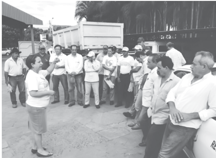
Objetivo foi motivar a comunidade a dar destino correto aos materiais que não utiliza mais