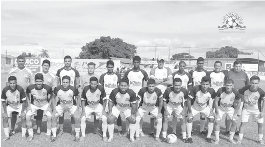
Jogadores e equipe técnica que integram o Clube Esportivo de Ouroeste

As equipes de base do município de Ouroeste participam hoje, logo mais às 8h, do campeonato que acontece na cidade de Pontalinda.