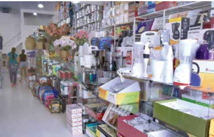
Estabelecimento oferece as melhores marcas a preços imperdíveis