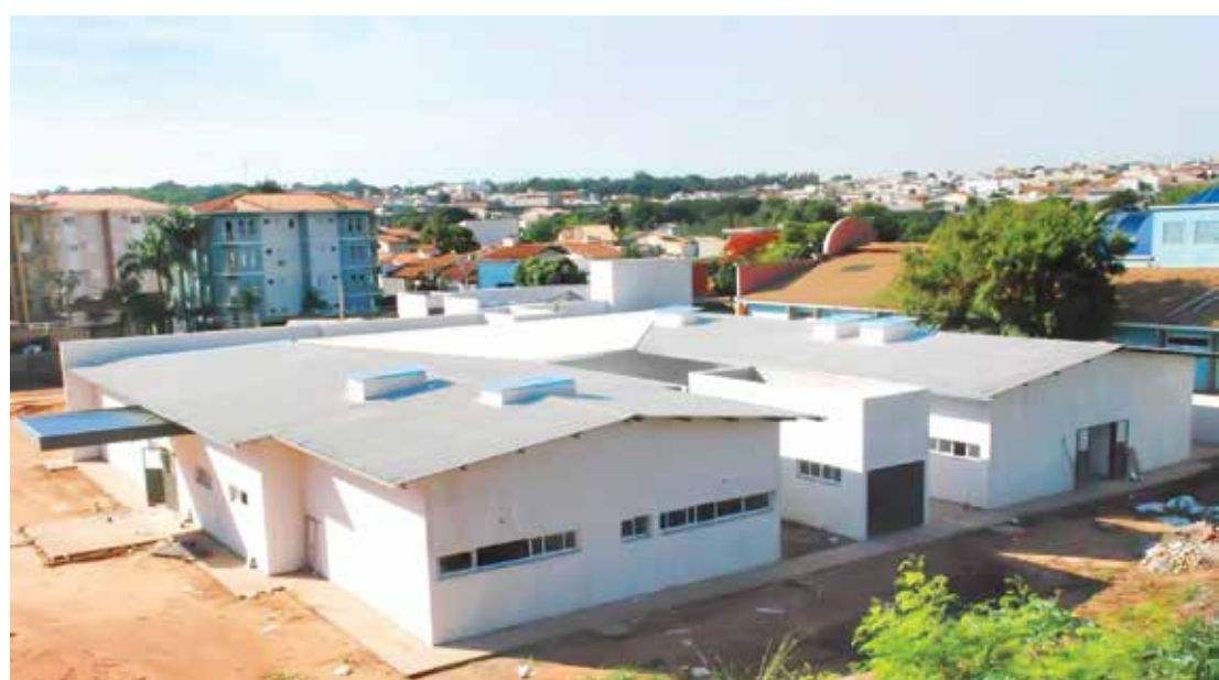
A obra tem o valor total de um milhão, setecentos e sessenta mil reais

Unidades de Pronto Atendimento (UPA) funcionam 24 horas por dia, sete dias por semana e podem resolver grande parte das urgências e emergências, como pressão e febre alta, fraturas, cortes, infarto e derrame. Com isso ajudam a diminuir as filas nos prontos-socorros dos hospitais. A UPA inova ao oferecer estrutura simplificada, com raios-X, eletrocardiografia, pediatria, laboratório de exames e leitos de observação. Nas localidades que contam com UPA, 97% dos casos são solucionados na própria unidade.