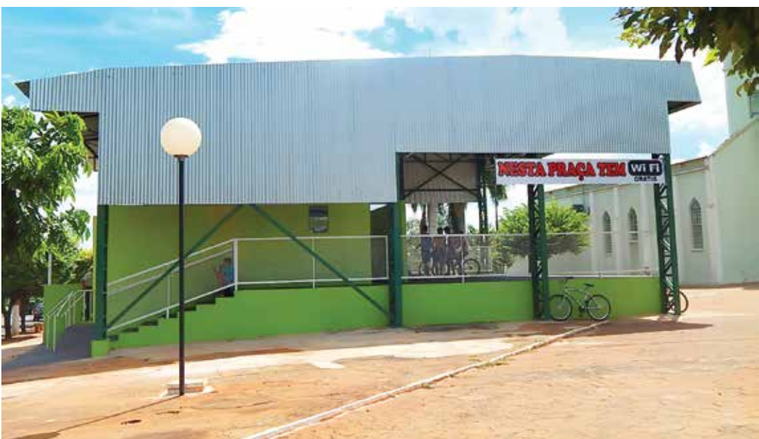
Inovação agrada moradores de Pedranópolis que frequentam costumeiramente a praça