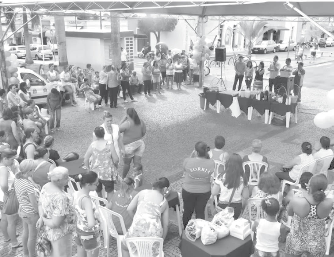
Evento contou com diversas atividades gratuitas e presença de autoridades