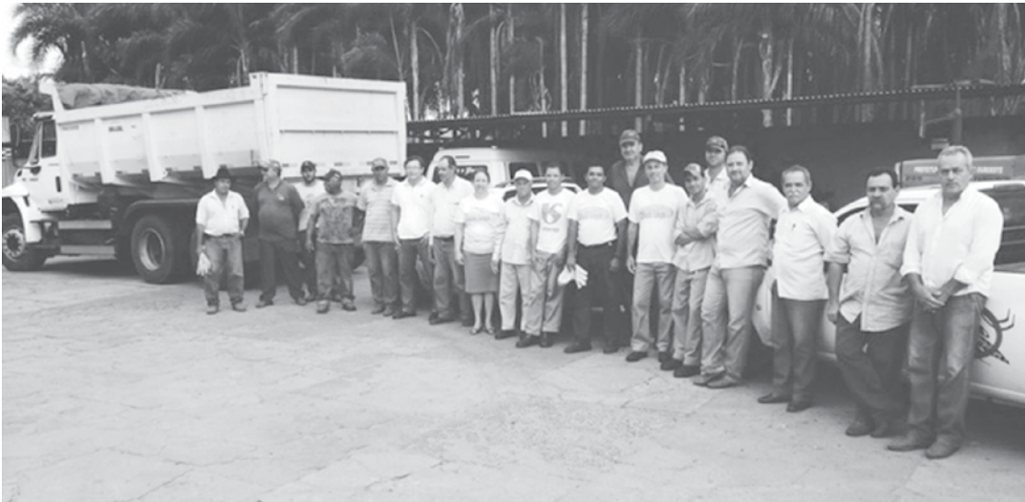
Projeto mobilizou diversos veículos