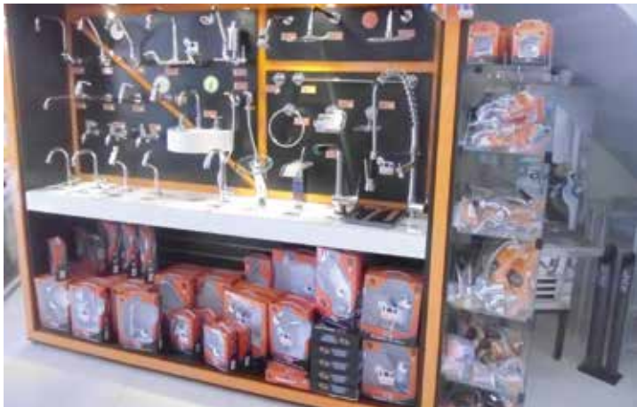
Linha de torneiras é a novidade no Feirão do Alumínio