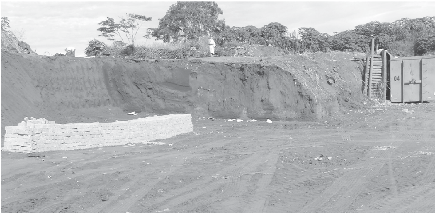
Início das obras de construção do transbordo de lixo definitivo

Sanitário particular da cidade de Meridiano, pela empresa Proposta Engenharia Ambiental Ltda. Os resíduos domiciliares domésticos coletados diariamente, cerca de 7,9 toneladas, são levados para o Transbordo (local onde fica a caçamba estacionária provisoriamente) e posteriormente transportados para o Aterro Sanitário de Meridiano, três vezes por semana.