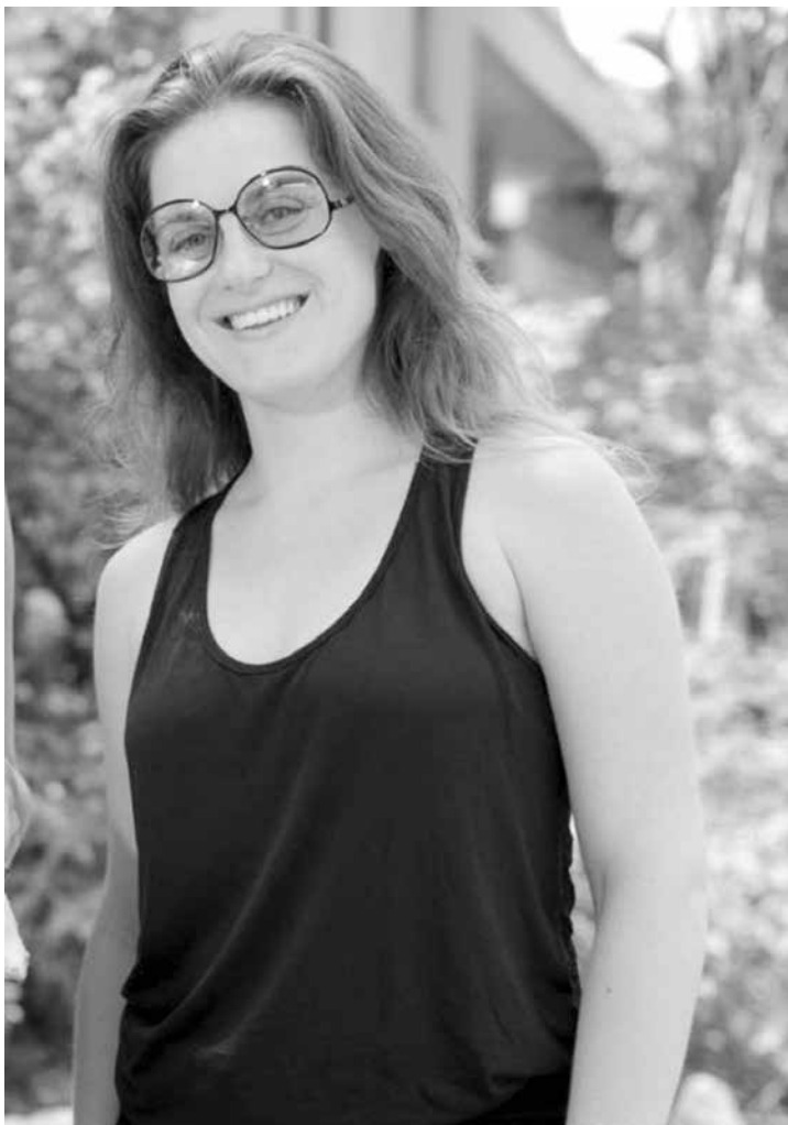
Atriz diz que recebe várias manifestações de apoio de fãs e amigos

uma tsunami de amor”, disse ela, em entrevista. Atualmente solteira, a atriz e cantora, conhecida por interpretar a empregada doméstica Bozena, do seriado “Toma lá, dá cá”, escreveu um texto no ano passado explicando que estava farta de ter que aparentar ser uma pessoa que ela não era. “As pessoas costumam assumir o seu amor e não a sua sexualidade. Não as julgo. Mas eu aqui estou me assumindo, não porque esteja apaixonada e nem mesmo porque esteja procurando um amor para o momento. Não é o caso, definitivamente. Estou me assumindo porque estou exausta. Pra mim já deu”.